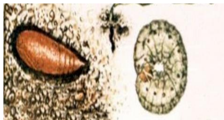
Fot.30. Poczwarzka i gąsienica rolnicy fot. Studziński A.

Podana ilość wystarcza na 25 arów powierzchni pola. Rolnice występują „placowo”, stąd też stosowanie przynęty można ograniczyć do miejsca występowania szkodników. Zabieg wykonuje się tylko w okresie, kiedy są one widoczne na powierzchni ziemi lub są płytko pod ziemią. Bezpośrednio przed zabiegiem, zaleca się wzruszenie gleby za pomocą narzędzi do uprawy międzyrzędowej, ponieważ większość rolnic w czasie dnia ukrywa się płytko pod ziemią (do 10 cm).