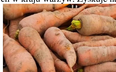
Fot.1. Korzenie marchwi

Marchew to jedno z najważniejszych i powszechnie uprawianych w kraju warzyw. Zyskuje na popularności dzięki wielokierunkowym zastosowaniom oraz walorom smakowym i zdrowotnym. W Polsce marchew wykorzystywana jest przez przemysł przetwórczy do produkcji soków i mrożonek oraz do konsumpcji bezpośredniej, jako składnik wielu potraw.