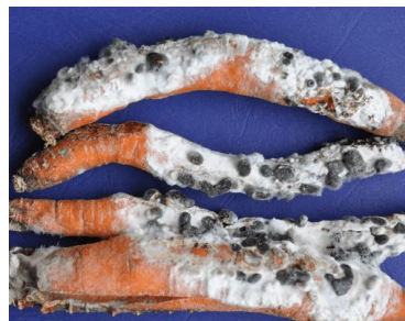
Fot.20. Botrytis cinerea na korzeniach marchwi

Szara pleśń ( Botrytis cinerea ) – grzyb jest typowym polifagiem, pasożytującym na wielu