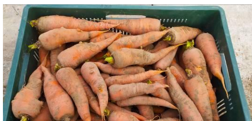
Fot.9. Wysadki przygotowane do przechowywania

Zbiór wysadków prowadzi się w III dekadzie września lub I dekadzie października, na