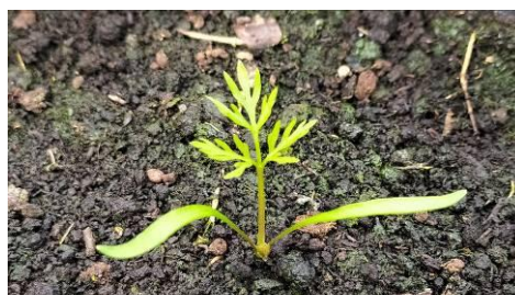
Fot.3. Siewki marchwi

Podczas dwuletniej uprawy ekologicznej marchwi na nasiona, warunki klimatyczne mają duży wpływ na wzrost i rozwój roślin. Najważniejszą rolę odgrywa temperatura. Nasiona marchwi zaczynają kielkować w temperaturze 4 - 6°C, siewki znoszą przymrozki do -4°C. Niskie temperatury opóźniają wschody roślin, wówczas marchew zaczyna kielkować po 4-5 tygodniach, natomiast w sprzyjających warunkach (siew