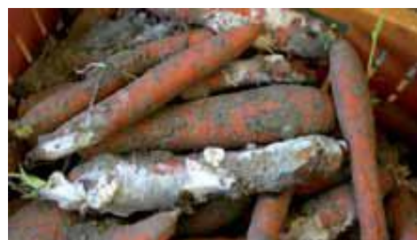
Fot.19. Korzenie marchwi porażone Rizoctonia carotae

Rizoktonioza marchwi ( Rizoctonia carotae ) – grzyb poraża marchew najczęściej w okresie