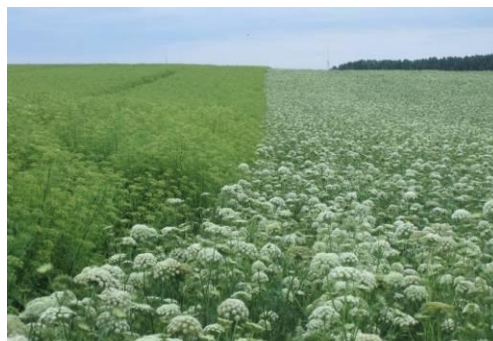
Fot.7. II rok uprawy ekologicznej marchwi na nasiona

W uprawie marchwi na redlinach ważnym zabiegiem jest obredlanie , czyli podsypywanie roślin, jeśli zostały odsłonięte podczas ulewnych deszczy lub deszczowania. Zabieg ten