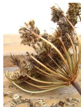
Fot.11. Baldach w fazie dojrzałości zbiorczej

Zbiór wykonuje się rano, gdy rośliny są wilgotne, aby zapobiec osypywaniu. Na małych plantacjach zbiór nasion marchwi można prowadzić dwufazowo, na dużych jednofazowo, młóćąc nasiona kombajnem.