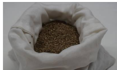
Fot.12. Nasiona marchwi przechowywane w workach lnianych

Przed zapakowaniem do torebek niehermetycznych nasiona muszą być wysuszone do wilgotności nie wyższej niż 10%, a w przypadku opakowań hermetycznych nie wyższej niż 7%. Nasiona przeznaczone do obrotu handlowego muszą być ocenione w specjalistycznych laboratoriach pod względem energii i zdolności kiełkowania, czystości i wilgotności. Do zbioru nasion, młócenia, czyszczenia, suszenia, przechowywania i paczkowania nasion używa się specjalistycznego sprzętu oferowanego przez liczne firmy krajowe i zagraniczne.