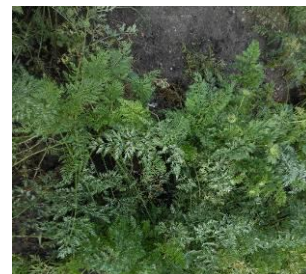
Fot.17. Mączniak prawdziwy na naci marchwi

marchwi , pochodzenia grzybowego. Patogen powoduje spadek jakości nasion i ich wartości siewnej. Powszechnie występuje na marchwi, pietruszce i cykorii, pod koniec okresu wegetacji roślin. Biały mączysty nalot grzybni z zarodnikami pojawia się u marchwi na górnej stronie blaszki liściowej, baldachach i łodygach nasienników. Liście ulegają chlorozie i stopniowo zamierają. Przy dużym nasileniu choroby, zwłaszcza podczas chłodniejszych i wilgotnych dni może nastąpić wtórne zakażenie przez inne grzyby i bakterie patogeniczne. Grzyb atakuje w okresach ciepłych i suchych, lecz do zakażenia roślin niezbędny jest krótki okres zwilżenia liści, występujący podczas nocnych i porannych mgieł. Zimuje w resztkach roślin z rodziny selerowatych. Patogen może być