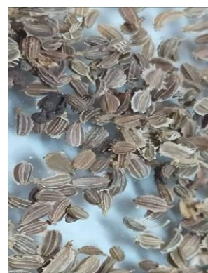
Fot.13. Materiał siewny marchwi

Straty plonu nasion zwłaszcza w przypadku roślin dwuletних są związane z porażeniem roślin przez patogeny glebowe, powodujące wypadanie roślin w drugim roku