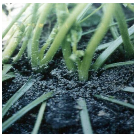
Fot.23. Mszyca ondulująca na marchwi Fot.24. Mszyca głogowo-marchwiana