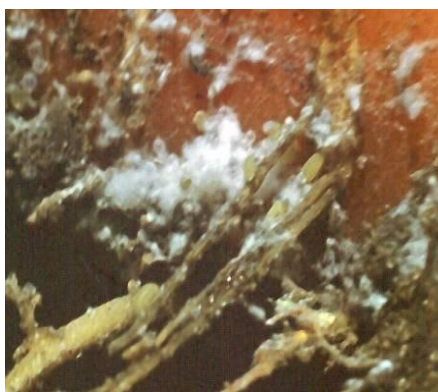
Fot.25. Marchew porażona bawełnicą topolowo-marchwianą