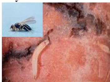
Fot.21. Połyśnica marchwianka i porażone przez nią korzenie marchwi

Największe szkody w produkcji marchwi corocznie powoduje połyśnica marchwianka , bawelnica topolowo-marchwiana oraz rolnice . Groźnym szkodnikiem atakującym rośliny nasienne marchwi w drugim roku uprawy są zmieniki ( Lygus sp.) a głównie zmienik lucernowiec ( Lygus rugulipennis ) – wysysający sok z kwiatów a następnie uszkadzający zarodki