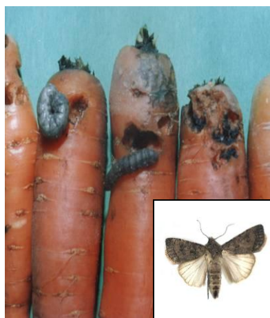
Fot.28. Korzeń marchwi uszkodzony przez