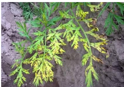
Fot.15. Nac marchwi porażona przez Alternaria dauci

Alternarioza naci marchwi (czarna plamistość liści) i czarna zgnilizna korzeni ( Alternaria dauci , A. radicina ) – powszechnie występująca choroba grzybowa, powodująca największe straty na plantacjach nasiennych. Patogen poraża liście marchwi (nac), które tracą właściwości asymilacyjne, co wpływa na obniżenie jakości i wielkości plonu korzeni. Na liściach i ogonkach liściowych pojawiają się początkowo drobne brązowo czarne plamy, które w późniejszym okresie rozwoju choroby zlewają się ze sobą. Porażeniu ulegają zwykle najstarsze liście. W przypadku wczesnego i silnego porażenia następuje przedwczesne zasychanie naci i znaczne obniżenie plonu. W warunkach niższych temperatur i wysokiej wilgotności na liściach mogą być widoczne zarodniki konidialne grzyba. Silnie porażone i obumarłe liście uniemożliwiają zbiór mechaniczny korzeni. Przy porażeniu naci w II roku uprawy marchwi na nasiona, następuje zamieranie korzeni w okresie tworzenia się kwiatostanów i wiązania nasion na roślinach matecznych. Porażone nasiona są pierwotnym źródłem infekcji na plantacjach marchwi w