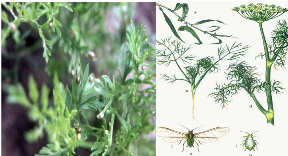
Fot.27. Mszyca wierzbowo – marchwiana