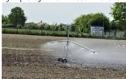
Fot.8. Nawadnianie plantacji

Nawadnianie - marchew jest rośliną, dobrze znoszącą niedobory wody w glebie. Wymagania wodne marchwi wynoszą około 350–400 mm. Okres największej wrażliwości na suszę przypada w czasie wschodów oraz intensywnego przyrostu korzeni (sierpień – wrzesień). Jeśli susza wystąpi podczas wschodów, należy stosować nawadnianie bardzo małymi dawkami wody, aby nie powodować zatapiań nasion i wymywania gleby. W późniejszym okresie przeciętna jednorazowa dawka wody powinna wynosić 25-30 mm, przy intensywności opadu wynoszącej od 8–15 mm/godz. Najlepiej nawadniać glebę w razie potrzeby przed siewem. W uprawie na redlinach dawka wody może być nieco mniejsza (20 mm), aby spływając do podstawy redlin, została szybko wchłonięta przez glebę. Zbyt intensywne nawadnianie plantacji marchwi nasiennej, może prowadzić nawet do okresowego zatapiań roślin i ich więdnienia.