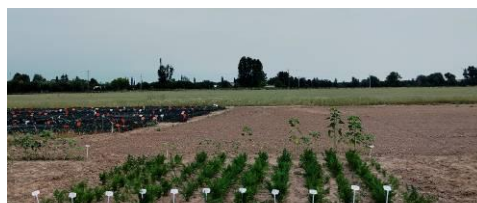
Fot.4. I rok ekologicznej uprawy marchwi na nasiona

Zgodnie z wymogami ekologicznej uprawy roślin plantacje należy lokalizować na glebach nieskażonych metalami ciężkimi, pozostałościami środków ochrony roślin lub odpadami przemysłowymi. Nie należy stosować nawozów mineralnych. Woda użyta do nawodnień musi być czysta, wolna od skażeń. Należy szczególnie zadbać o zachowanie zdrowotności roślin i gleby oraz jej żyzności i biologicznej aktywności. Zapobiegać należy także zmęczeniu gleby, co w rezultacie prowadzi do uzyskania wysokich i zdrowych plonów.