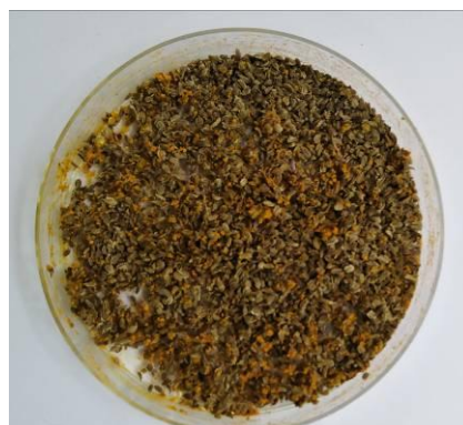
Fot.6. Nasiona marchwi zaprawione w kurkumie

kondycjonowanie nasion, biologiczne – zaprawianie środkami biologicznymi oraz fizyczne, do których należą między innymi traktowanie nasion światłem LED, laserem, polem magnetycznym, falami elektromagnetycznymi, stratyfikacja i hydrotermoterapia (traktowanie wodą o temperaturze 40-50°C około 20 minut). Stosując metody kondycjonowania (szybkiego uwilgotnienia nasion - pobudzenia do stanu, gdy korzonek zarodkowy nie przebije okrywy nasiennej), przyspiesza się kiełkowanie nasion i wschody roślin marchwi, ale istnieje wówczas ryzyko rozwoju grzybów patogenicznych, uzyskujących optymalne warunki do sporulacji. Przeciwdziałając infekcjom łączy się zabieg kondycjonowania ze środkami biologicznymi o działaniu