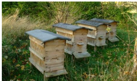
Fot.10. Pnie pszczele na plantacji

Ze względu na to, że marchew jest rośliną owadopylną, należy zadbać podczas jej kwitnienia o obecność na plantacji nasiennej pszczół (4-10 uli na ha).