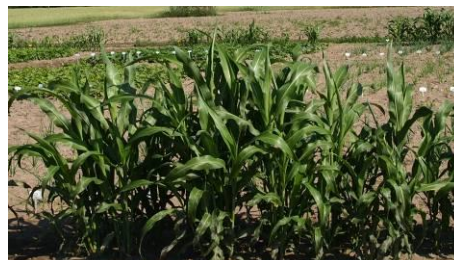
Fot.14. Pas ochronny oddzielający sąsiednie pola ekologiczne

6. Systematyczne lustracje plantacji nasiennej marchwi.