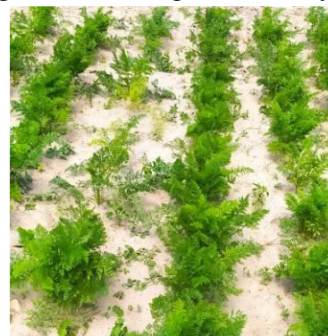
Fot.5. I rok ekologicznej uprawy marchwi nasiennej

Marchew uprawia się najczęściej w drugim roku po oborniku, a na glebach bardzo żyznych nawet w trzecim. Nawożenie nawozami