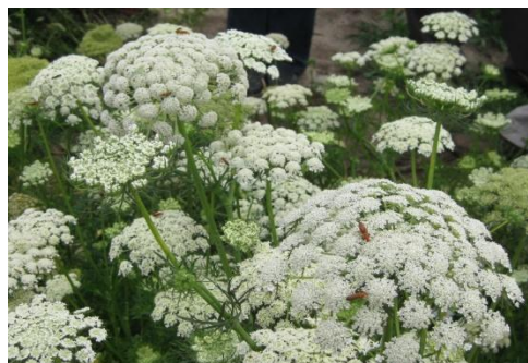
Fot.2. Kwitnący kwiatostan marchwi

Kwiatostanem roślin należących do rodziny Apiaceae jest baldach złożony z baldaszków. Kwiaty rośliny nasiennej marchwi są drobne, mają barwę białą , czasem bladnoróżową oraz intensywny zapach . Są w zasadzie obupłciowe, ale spotyka się również kwiaty męskie (pręcikowe) lub rzadziej słupekowe. Marchew jest rośliną obcopolną – kwiaty zapylane są głównie przez owady błonkoskrzydłe. Z tego względu gatunek łatwo krzyżuje się z marchwią dziką.