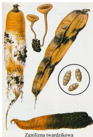
Fot.18. Studziński A

roślin żywicielskich zgnilizny twardzikowej należy stosować kilkuletnią przerwę w uprawie. Zabiegi ochrony roślin wykonuje się zapobiegawczo stosując odpowiednie środki ochrony roślin (tabela 2).