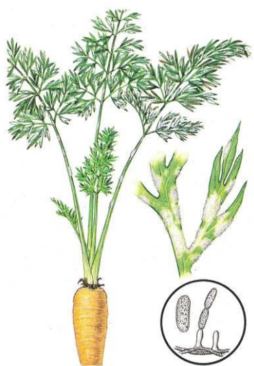
Mączniak prawdziwy baldaszkowatych