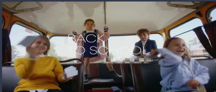
Back to school