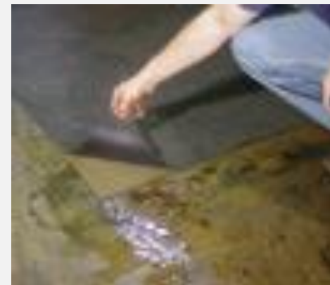
Zdjęcie 2. Chodnik sorpcyjno-izolacyjny