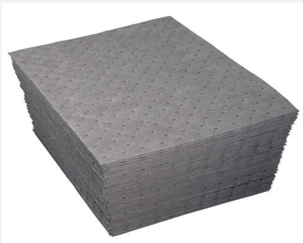
Zdjęcie 1. Ściereczka uniwersalne polipropylenowa

Sorbenty polipropylenowe charakteryzują się bardzo dużą chłonnością ok. 600 % - 1400 %. Występują jako sorbenty uniwersalne, chemiczne oraz hydrofobowe. Najczęściej, sorbenty polipropylenowe hydrofobowe stosuje się do ograniczania i zbierania rozlewisk olejów i substancji ropopochodnych z powierzchni wody. Tego typu sorbenty są selektywne, nawet w stanie najwyższego nasycenia niezatapialne. Są to sorbenty palne lecz produkty spalania są niegroźne ( CO_2 i H_2O ).