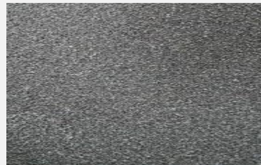
Zdjęcie 4. Sorbent Imperial