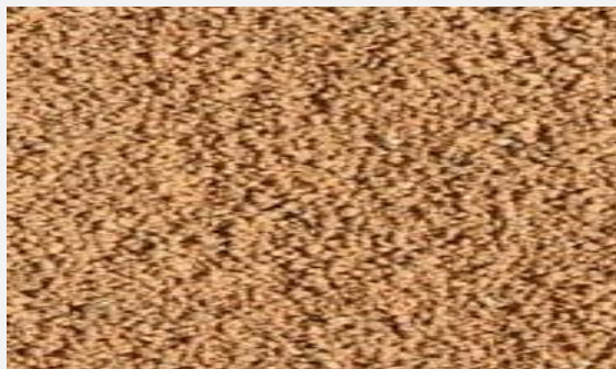
Zdjęcie 3. Sorbent Kompakt

Sorbenty chemiczne wykonane z włókniny sorpcyjnej występują w kolorze wyróżniającym się od otoczenia ( żółty, zielony, różowy ) w celu zasygnalizowania, że mamy do czynienia z sorbentem nasączonym substancją agresywną ( niebezpieczną ). Dodatkowo, na tych kolorach dokładnie widać pochłoniętą ciecz. Przykładem sorbentu chemicznego wykonanego z włókniny sorpcyjnej jest grupa: Sorbenty Polipropylenowe Chemiczne.