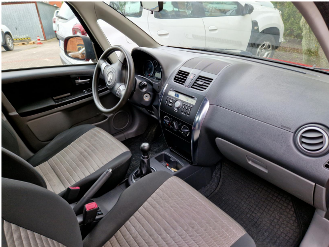
Dok. fot. z dnia 13.03.2023 fot. nr 9