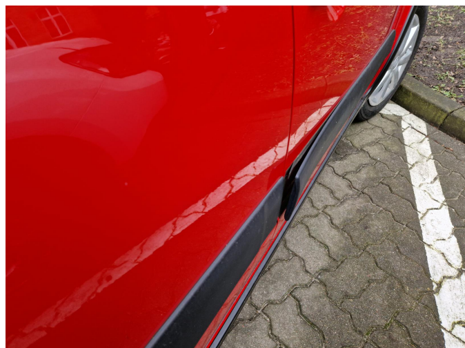
Dok. fot. z dnia 13.03.2023 fot. nr 24