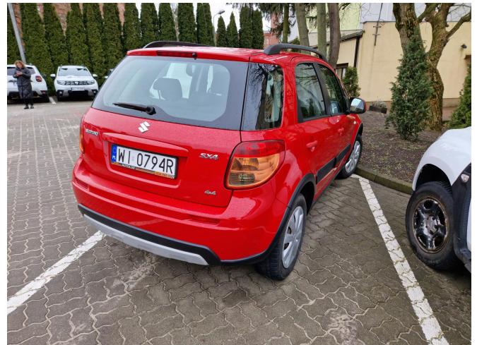
Dok. fot. z dnia 13.03.2023 fot. nr 4