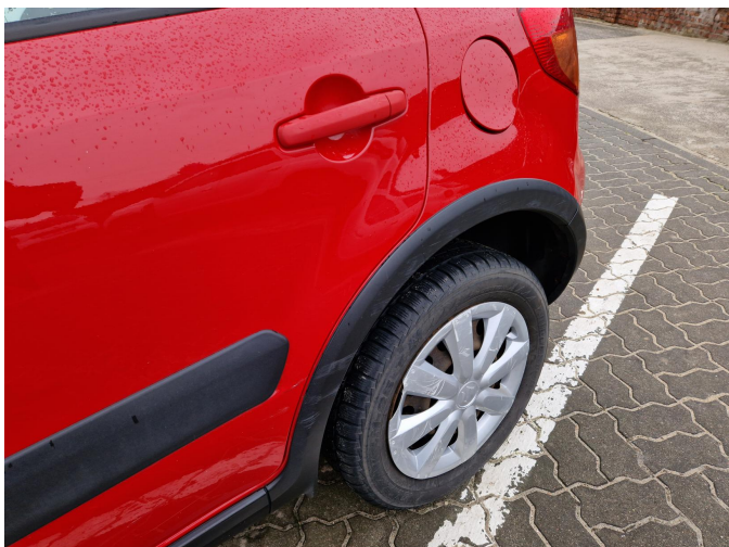
Dok. fot. z dnia 13.03.2023 fot. nr 21