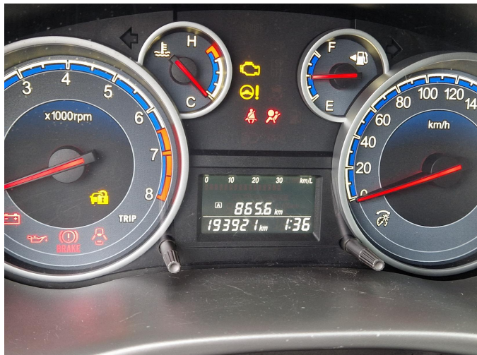
Dok. fot. z dnia 13.03.2023 fot. nr 13