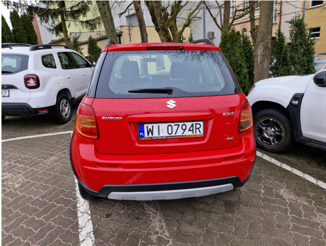
Dok. fot. z dnia 13.03.2023 fot. nr 7