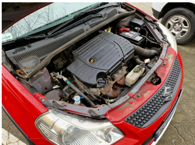
Dok. fot. z dnia 13.03.2023 fot. nr 17