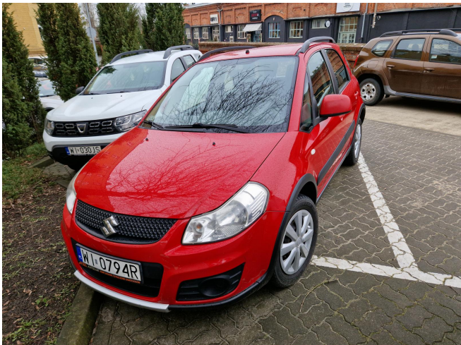
Dok. fot. z dnia 13.03.2023 fot. nr 3