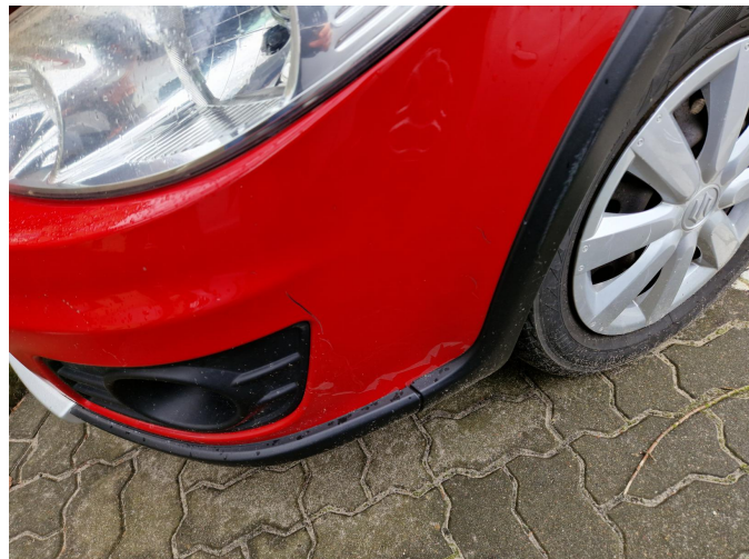
Dok. fot. z dnia 13.03.2023 fot. nr 20