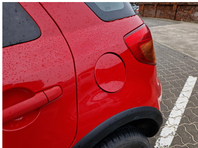
Dok. fot. z dnia 13.03.2023 fot. nr 22