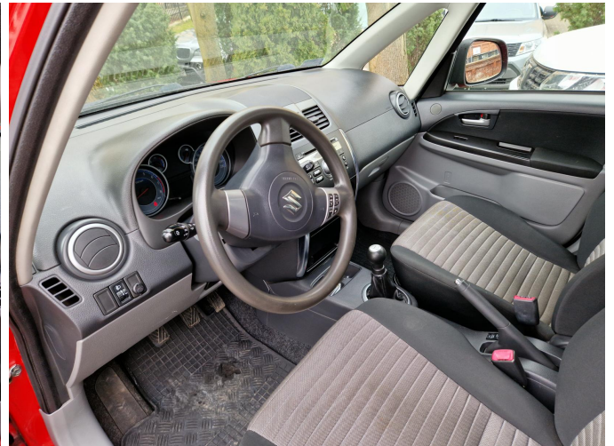
Dok. fot. z dnia 13.03.2023 fot. nr 10