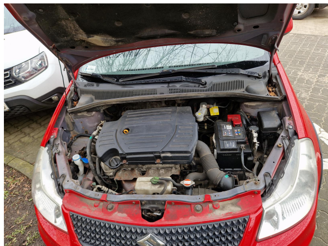
Dok. fot. z dnia 13.03.2023 fot. nr 16