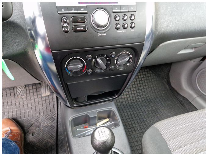
Dok. fot. z dnia 13.03.2023 fot. nr 15