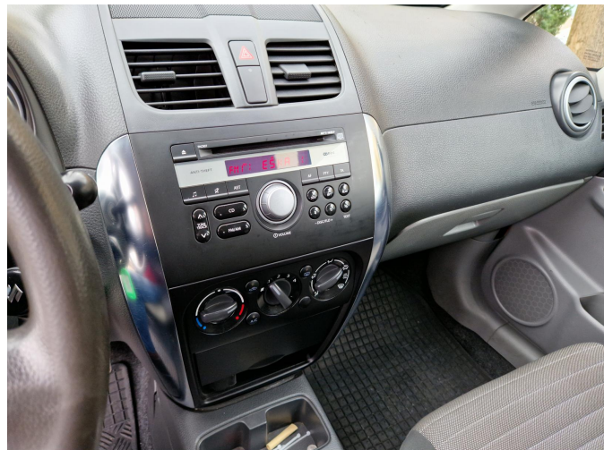
Dok. fot. z dnia 13.03.2023 fot. nr 14