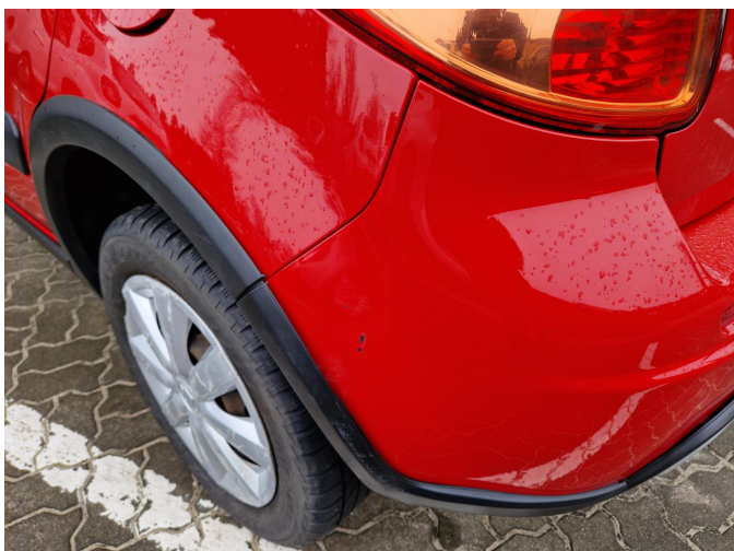
Dok. fot. z dnia 13.03.2023 fot. nr 23