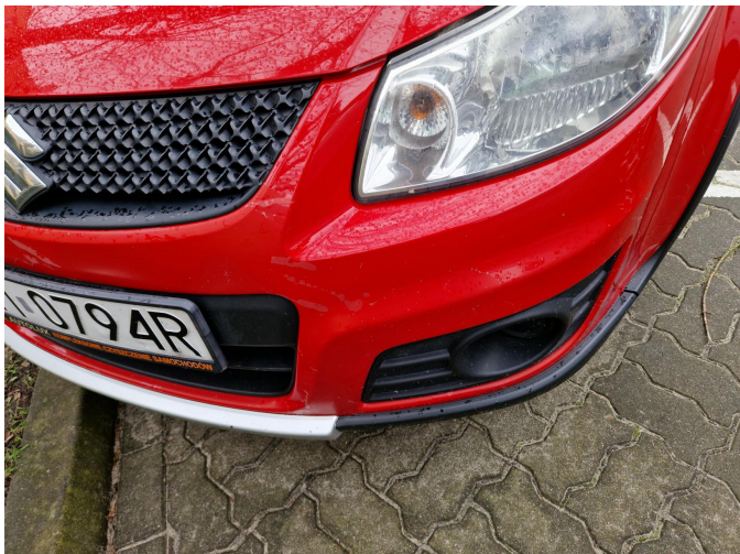
Dok. fot. z dnia 13.03.2023 fot. nr 19