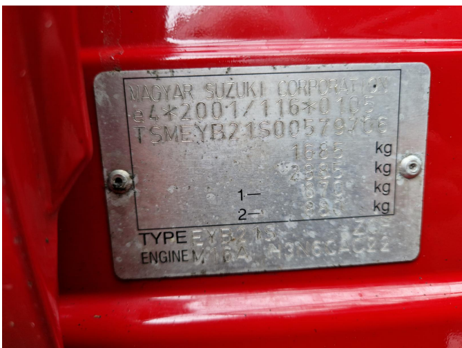
Dok. fot. z dnia 13.03.2023 fot. nr 11