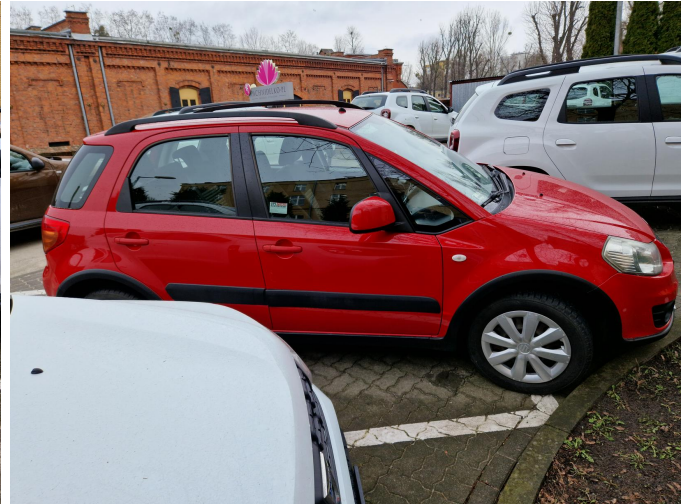
Dok. fot. z dnia 13.03.2023 fot. nr 8