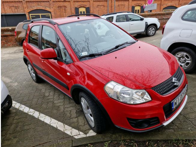
Dok. fot. z dnia 13.03.2023 fot. nr 1