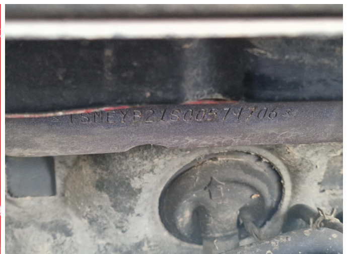
Dok. fot. z dnia 13.03.2023 fot. nr 12