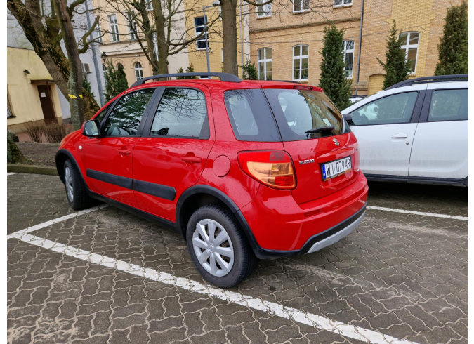
Dok. fot. z dnia 13.03.2023 fot. nr 2