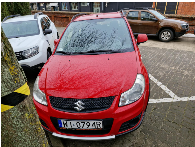
Dok. fot. z dnia 13.03.2023 fot. nr 5