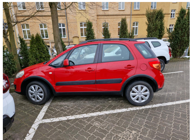
Dok. fot. z dnia 13.03.2023 fot. nr 6