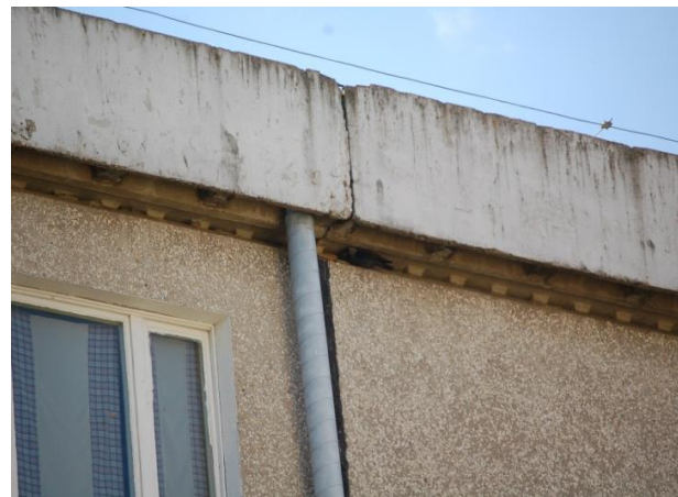
Kawka przy gnieździe pod okapem