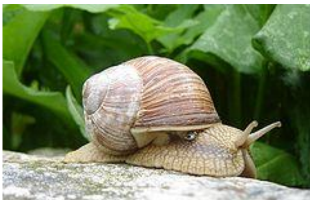
Ślimak winniczek ochrona częściowa

Ochrona częściowa – ochrona gatunków roślin, zwierząt i grzybów dopuszczająca możliwość redukcji liczebności populacji oraz pozyskiwania osobników tych gatunków lub ich części.