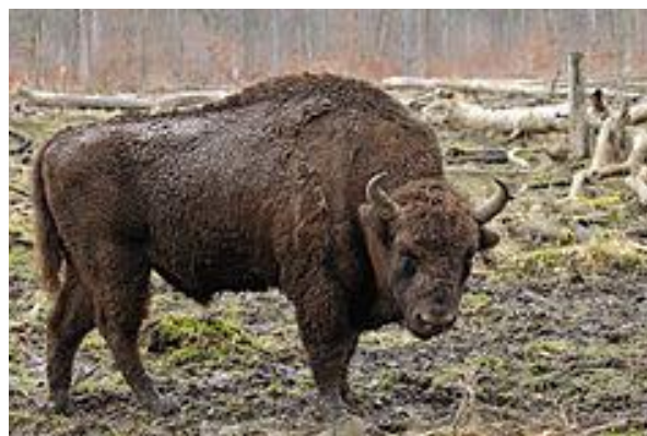
Żubr ochrona ścisła