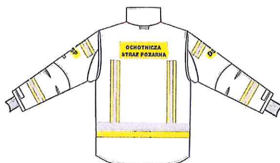
Przykładowy widok kurtki