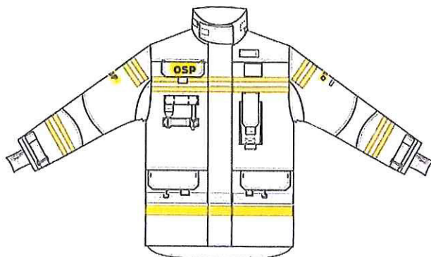
Przykładowy widok kurtki