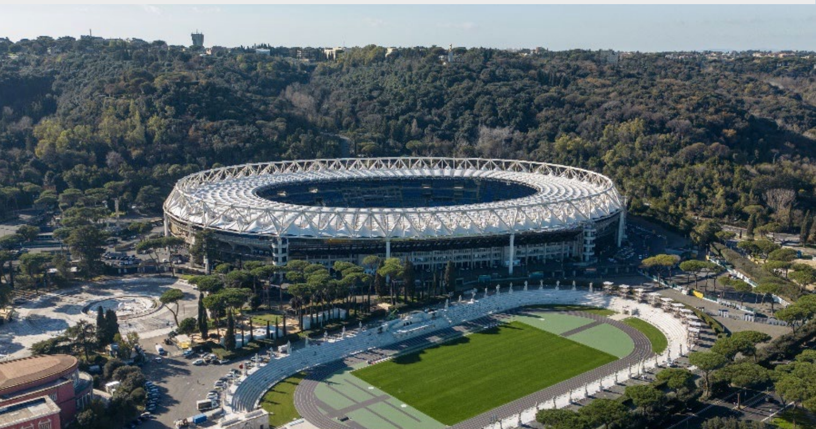
Stadio Olimpico, Rzym

Wszystkie konkurencje mistrzostw Europy (z wyjątkiem półmaratonu i chodu sportowego na 20 km) odbędą się na Stadionie Olimpijskim w Rzymie.