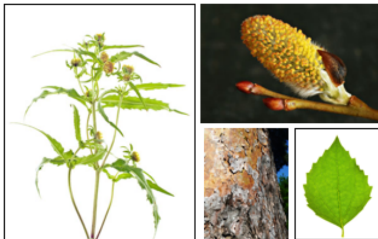
Zdjęcie nr 9. Dokumentacja fotograficzna okazu przedstawiająca różne części rośliny.

W Formularzu zbioru , w polu Zdjęcia podać odnośniki do zdjęć, np. nazwy plików: Nazwa gatunku_foto1-10. Autor zdjęć wyraża zgodę na publikację zdjęć w bazach danych LBG Kostrzyca i BOLD Systems.