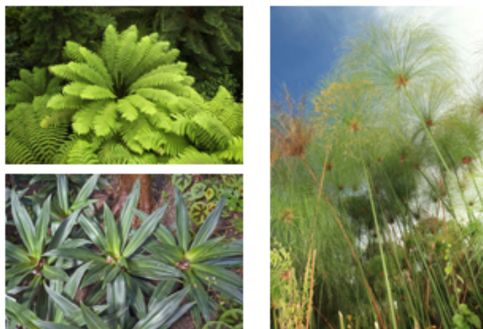
Zdjęcie nr 10. Zdjęcia okazu in situ.