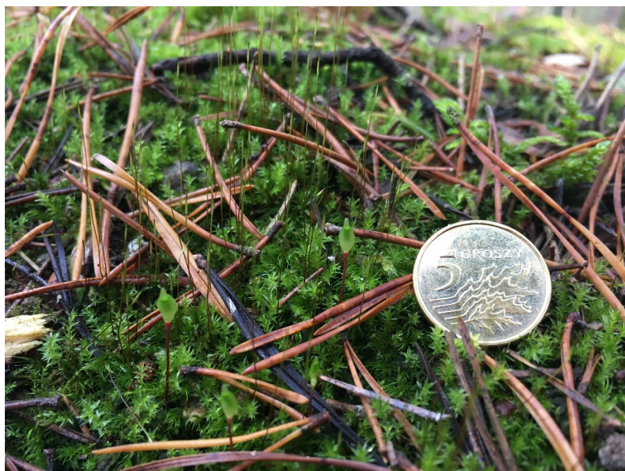
Zdjęcie nr 11. Przykład zdjęcia określającego wielkość zebranej próby.