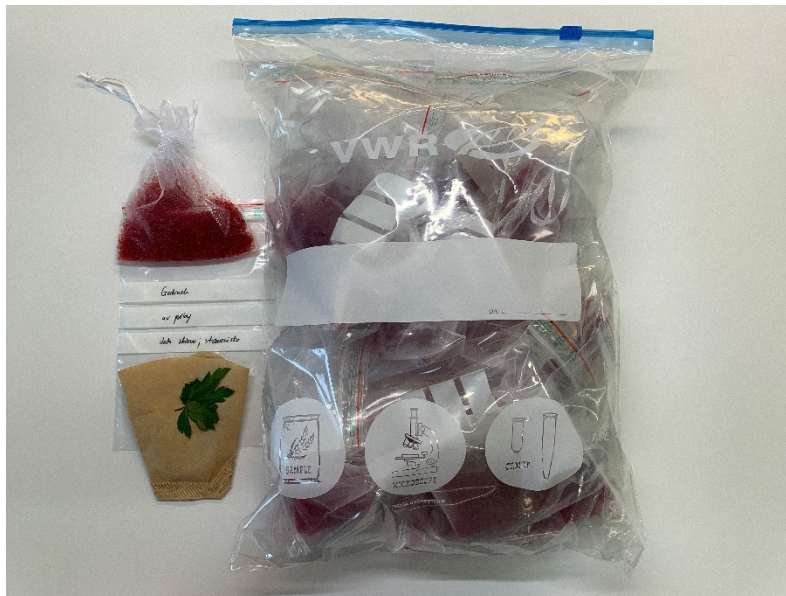
Zdjęcie nr 1. Woreczki z żelem krzemionkowym do transportu próbek do badań związanych z bankowaniem i barkodowaniem DNA.

Uwaga! Żel krzemionkowy może działać drażniąco na oczy. W przypadku dostania się do oczu - ostrożnie płukać wodą przez kilka minut. Po użyciu dokładnie umyć ręce.