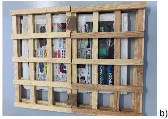
Zdjęcie nr 3. Standardowe wyposażenie do zbioru okazów zielnikowych.