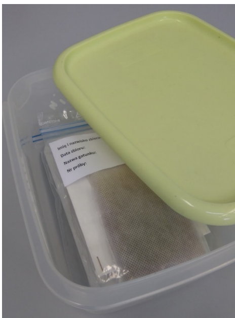
Zdjęcie nr 7. Szczelnie zamykane pudełko z materiałem roślinnym.

Należy uważać, aby przy umieszczaniu materiału w bibule, a następnie w woreczku z żelem krzemionkowym, nie doprowadzić do jego zagięcia, minimalizując tym samym ryzyko zaparzenia materiału. Większe fragmenty tkanek należy pociąć sterylnym skalpelem, w celu zwiększenia powierzchni ekspozycji tkanki na żel krzemionkowy. Woreczki z materiałem roślinnym, do czasu wysyłki do LBG Kostrzyca, należy przechowywać w pudełkach plastikowych szczelnie zamykanych, w suchym pomieszczeniu, w temperaturze pokojowej.