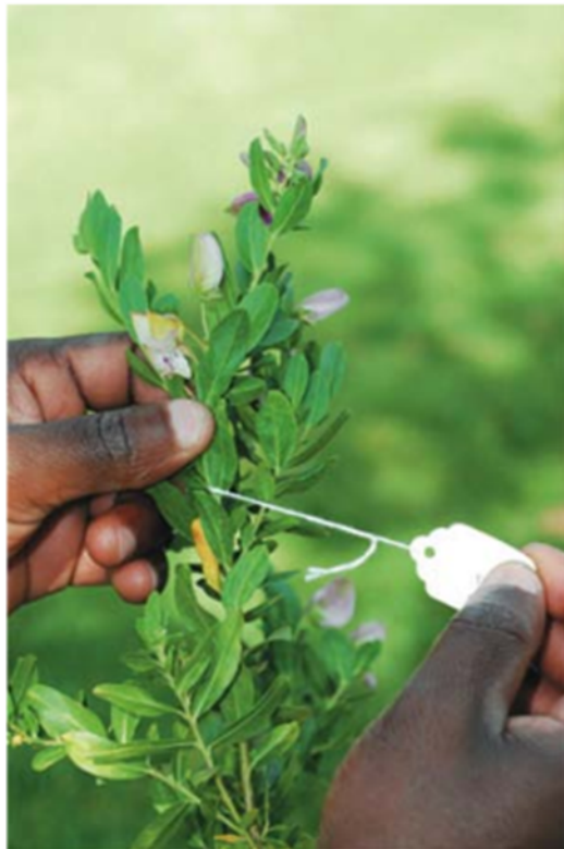
Zdjęcie nr 8. Etykietowanie okazów zielnikowych.

Na woreczku z fragmentem tkanki należy umieścić informacje umożliwiające jednoznaczną identyfikację materiału – nazwę gatunku, datę zbioru, stanowisko. Etykietę zielnikową należy dołączyć do każdego okazu zielnikowego.