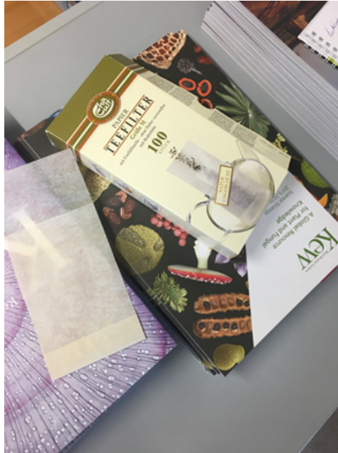
Zdjęcie nr 2. Sposoby zabezpieczenia fragmentów tkanek.

Materiał roślinny przed umieszczeniem w woreczku z żelem krzemionkowym należy zamknąć w filtrze do kawy ew. kieszonce z bibuły. Dla zabezpieczenia małych fragmentów roślin wykorzystywane są również torebki do herbaty.