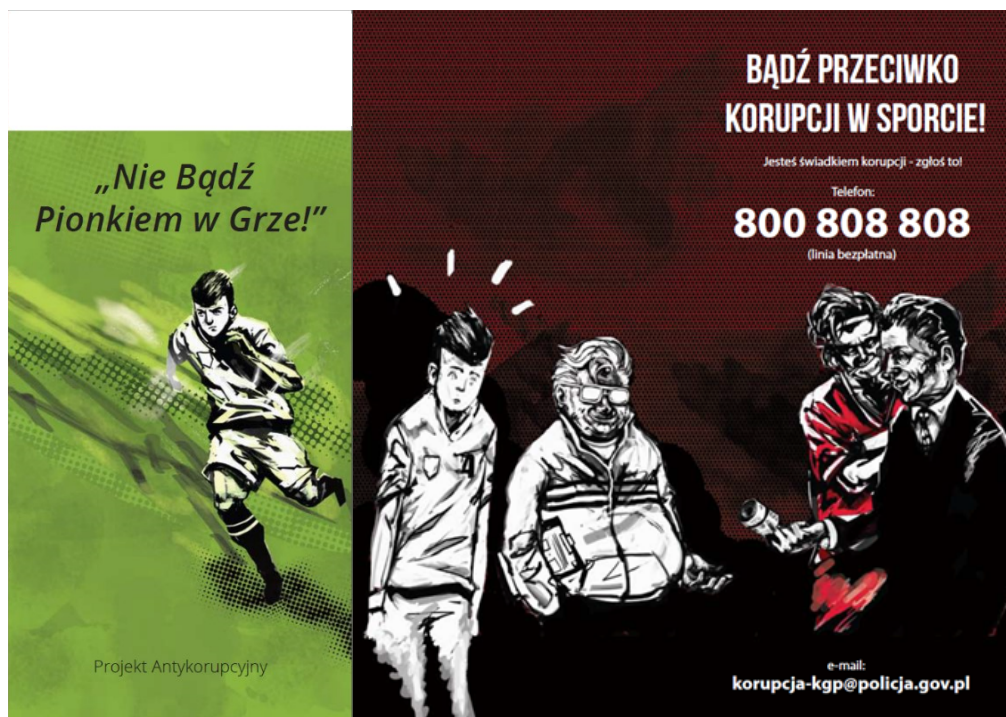
Fot. Front ulotki

Szkoleniowcy zapoznawali uczestników z kodeksem postępowania zawierającym zasady właściwego reagowania w przypadku zagrożenia korupcyjnego i propozycji ustawiania zawodów sportowych. Zbiór zasad i dobrych praktyk został, na zlecenie Ministerstwa Sportu, opublikowany w formie ulotek profilaktycznych, które były dystrybuowane wśród uczestników szkoleń.