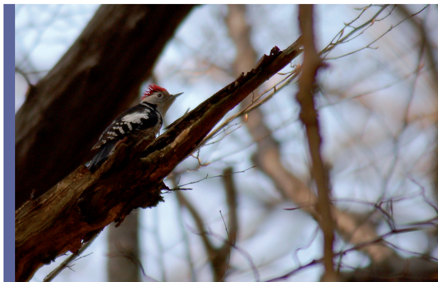
fol. Ł. Kajtoch

Kierunek zmian liczebności dzięcioła średniego w Polsce nie jest znany. Wynika to przede wszystkim z braku długoterminowych badań nad liczebnością gatunku, jak i niskiej frekwencji stwierżeń dzięcioła