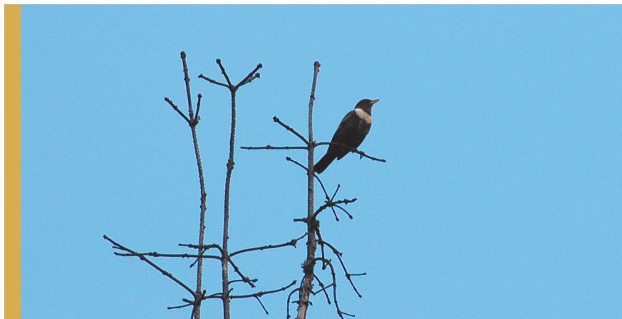
fol. Ł. Kajtoch

Ponad 1% krajowej populacji (z 2000 par) gniazduje w następujących obszarach specjalnej ochrony ptaków Natura 2000 oraz ostojach IBA: Tatry, Beskid Żywiecki, Babia Góra, Gorce, Beskid Wyspowy, Beskid Niski, Karkonosze, Góry Izerskie oraz prawdopodobnie w Beskidzie Śląskim, Bieszczadach i Ostoju Popradzkiej (skąd brak jest jednak dokładnych danych o liczebności).