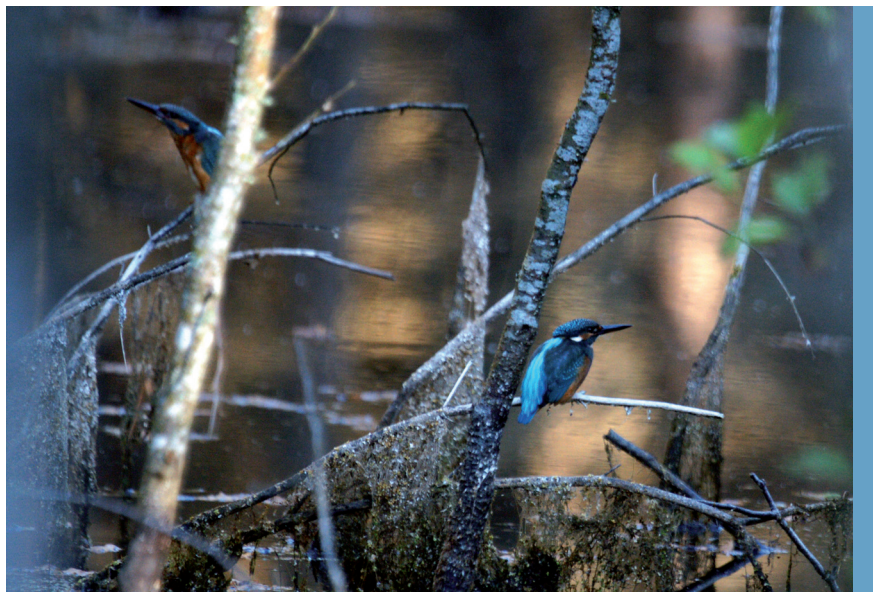
fol. G. Zawadzki

Ponad 1% krajowej populacji tego gatunku, czyli co najmniej 25 par, gniazduje w następujących obszarach Natura 2000 bądź ostojach ptaków o znaczeniu międzynarodowym (IBA): Zalew Szczeciński, Dolina Dolnej Odry, Ostoja Ińska, Ostoja Drawska, Lasy Puszczy nad Drawą, Puszcza nad Gwdą, Bory Tucholskie, Dolina Dolnej Wisły, Dolina Pasłęki, Ostoja Warmińska, Puszcza Augustowska, Puszcza Knyszyńska, Przełomowa Dolina Narwi, Dolina Dolnej Narwi, Dolina Dolnego Bugu, Puszcza Notecka, Dolina Środkowej Odry, Dolina Środkowej Warty, Dolina Środkowej Wisły, Łęgi Odrzańskie, Dolina Baryczy, Dolina Pilicy, Dolina Środkowego