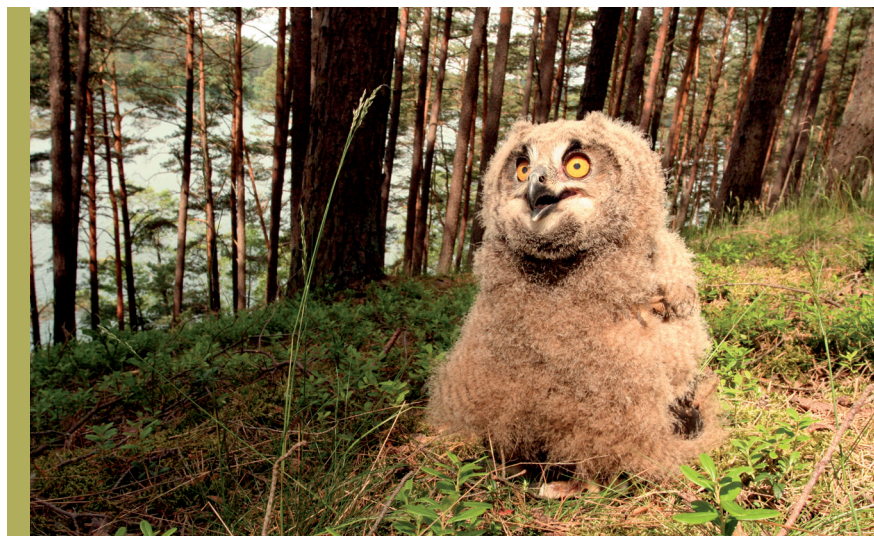
fot. D. Anderwald