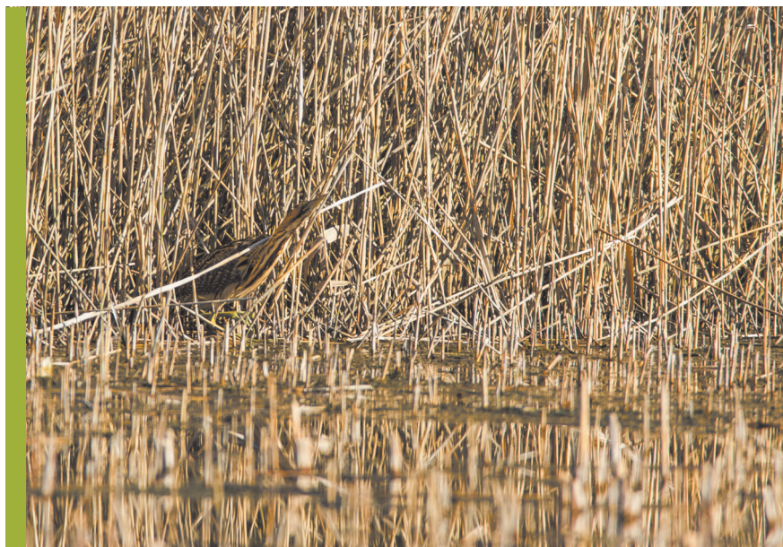
fot. G. Zawadzki

Obecnie krajowa populacja tego gatunku szacowana jest na 4100–4800 samców, czyli 1% reprezentacji wynosi około 45 samców (Dombrowski 2004, Chylarecki i Sikora 2007). Główne ostoje bąka (w granicach, których występuje powyżej 1% polskiej populacji) w naszym kraju skupiają następującą liczbę samców: Dolina Dolnej Odry (39–45 samców), Ostoja Drawska (44–51 samców), Bory Tucholskie (52–68 samców), Puszcza Piska (40–60 samców), Pradolina Warszawsko-Berlińska (50–60 samców), Ostoja Biebrzańska (27–120 samców), Dolina Baryczy (46–53 samców), Dolina Górnej Narwi (49 samców), Niecka Włoszczowska (42–48 samców) (Wilk i in. 2010, uaktualnione). Najnowsza ocena liczebności populacji krajowej została wykonana na podstawie ekstrapolacji z 31 powierzchni próbnych zlokalizowanych w całym kraju i sugeruje aż czterokrotny wzrost w ciągu dwóch dekad. Prawdopodobnie wzrost ten nie był tak spektakularny, a uzyskany wynik w dużym stopniu spowodowany był dokładniejszym poznaniem rozmieszczenia i liczebności tego gatunku w Polsce (Tomiałołć i Stawarczyk 2003). W Unii Europejskiej bąkowi przyznano kategorię SPEC 3, co ozna-