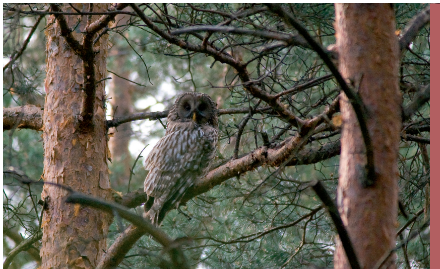
fol. G. Zawadzki