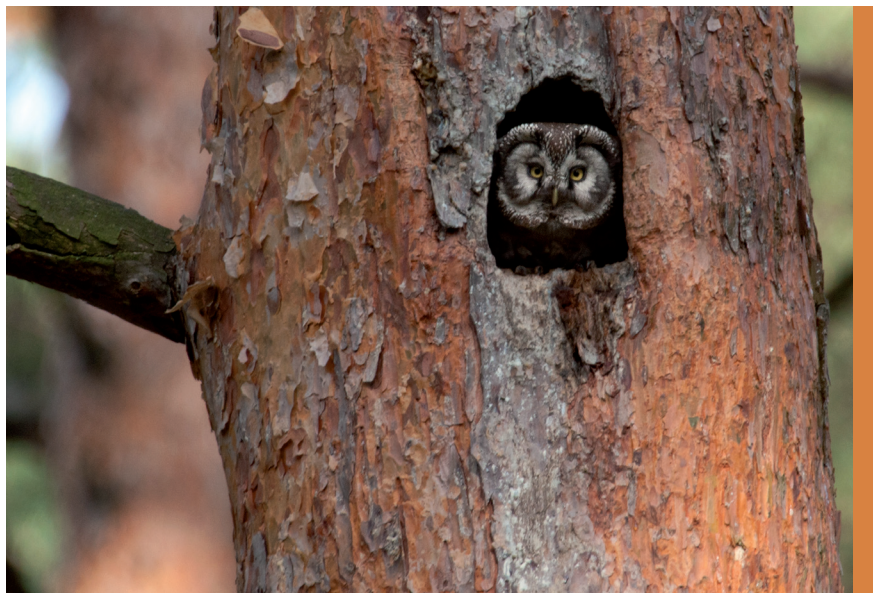
fol. G. Zawadzki