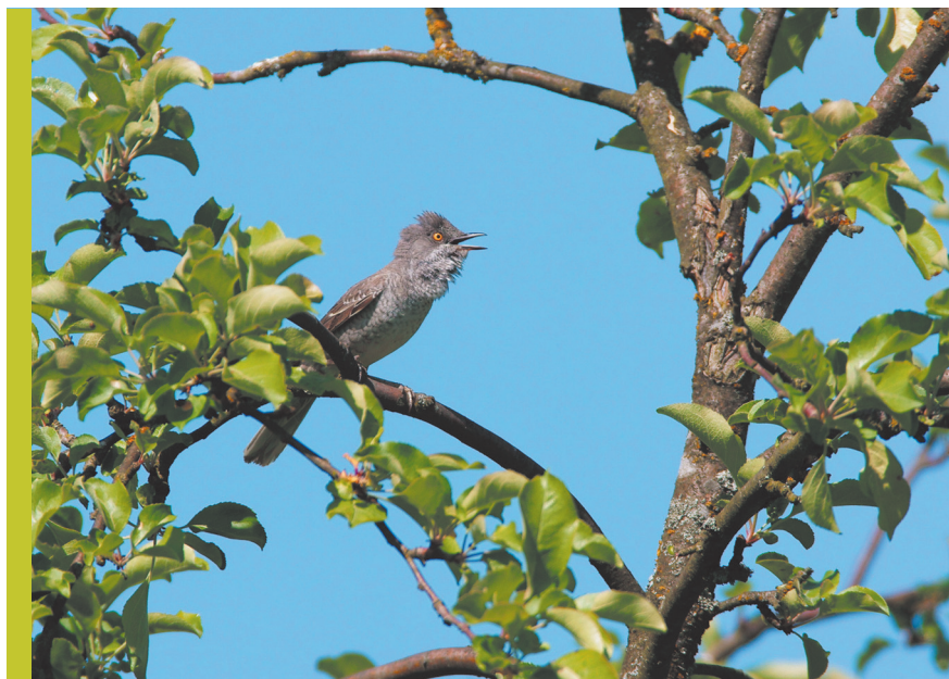
fol. G. Zawadzki