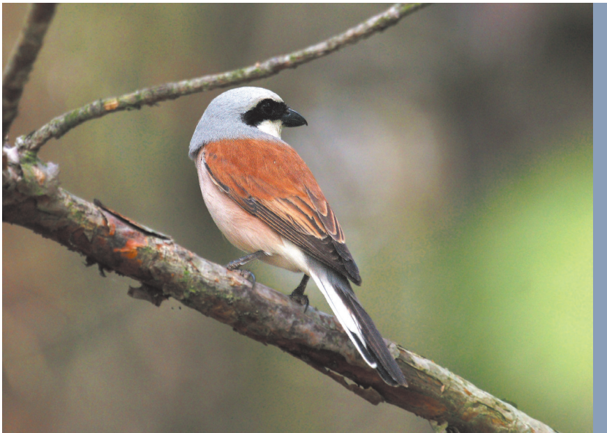
fol. G. Zawadzki

Znaczne wahania liczebności utrudniają ustalenie dokładnego przedziału liczebności i ogólnokrajowego trendu zmian populacyjnych, niemniej wieloletnie badania porównawcze prowadzone na dużych powierzchniach krajobrazowych w różnych regionach kraju wskazują na wzrost liczebności krajowej populacji w ostatnich latach (Kuźniak 2004). Tendencje wzrostowe zaznaczyły się szczególnie wyraźnie we wschodniej części Polski (Dombrowski i Goławski 2002). Natomiast jak wskazują dane zgromadzone w ramach Państwowego Monitoringu Środowiska (Monitoring Pospolitych Ptaków Lęgowych — MPPL), w latach 2000–2006, populacja gąsiorka na terenie kraju wydaje się być stabilna (Chylarecki i Jawińska 2007).