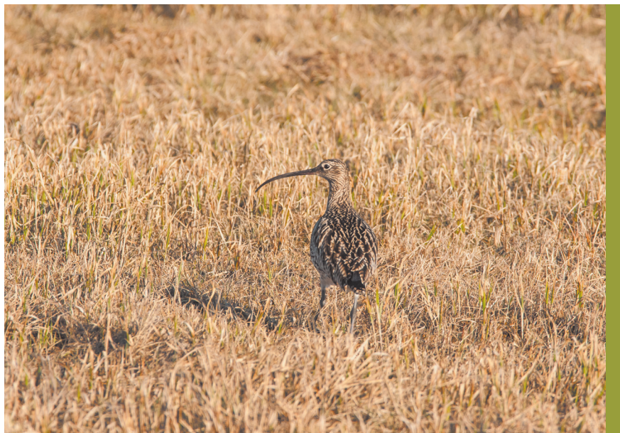
fol. G. Zawadzki

Ponad 1% krajowej populacji tego gatunku (>3 par) występuje w obszarach specjalnej ochrony ptaków Natura 2000 oraz ostojach ptaków o znaczeniu międzynarodowym (IBA): Dolina Omulwi i Płodownicy (45–56 par), Ostoja Biebrzańska (min. 50 par), Ostoja Kurpiowska (25–30 par), Nadnoteckie Łęgi (19 par), Bagno Wiczna (16–17 par), Dolina Środkowej Warty (10–14 par), Bagno Pulwy (12 par), Ujście Warty (10–12 par), Dolina Środkowej Noteci i Kanału Bydgoskiego (10–12 par), Jezioro Miedwie i Okolice (2–10 par), Dolina Neru (9–10 par), Wielki Łęg Obrzański (2–8 par), Bagno Bubnów (7 par), Dolina Górnego Nurca (2–5 par).