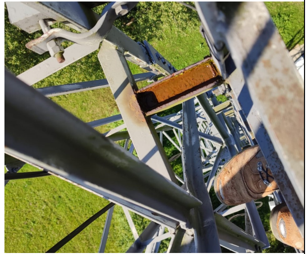
Uwaga 3.1, 3.2