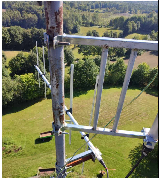
Uwaga 3.1, 3.2, 4.1