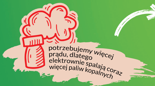
Diagram ma na celu zobrazowanie negatywnych konsekwencji wynikających z zachodzących zmian klimatu.