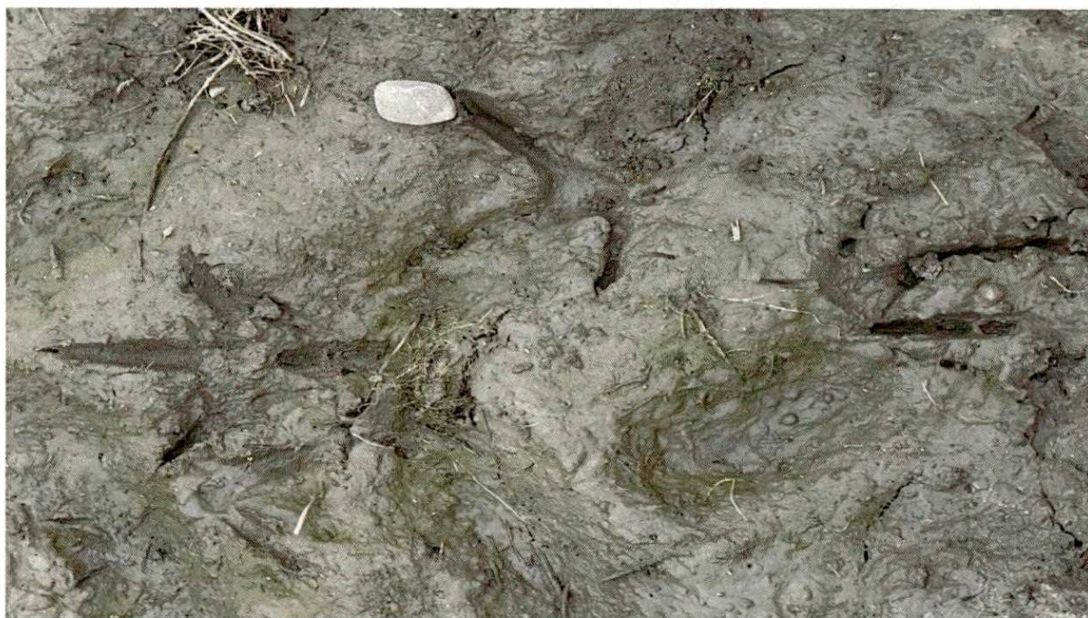
Zdjęcie nr 2. Ślady żurawi bytujących na działkach przeznaczonych pod inwestycję - działki nr 161, 159/2, 159/1 (Kobiela).