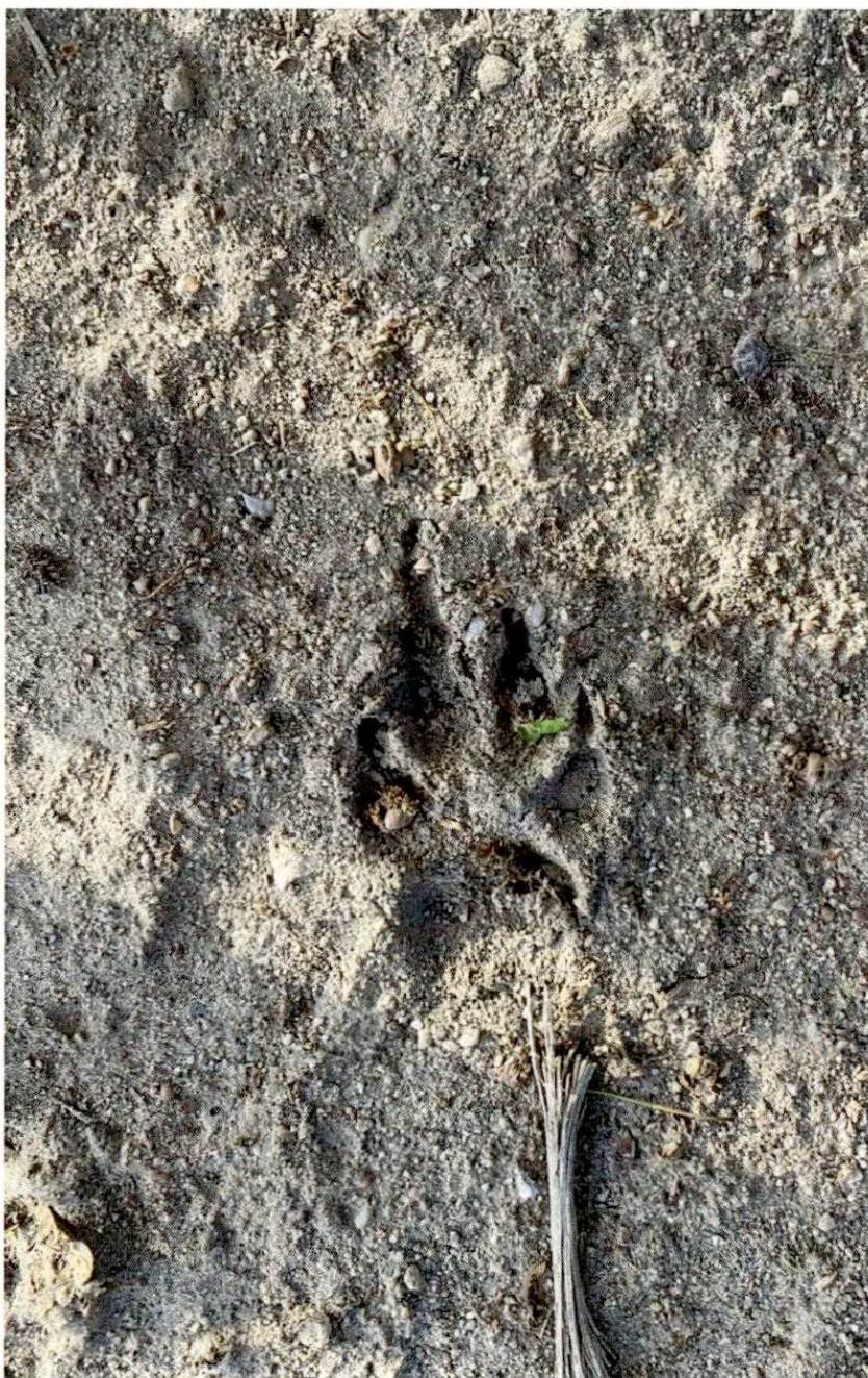
Zdjęcie nr 3. Ślad wilka - zdjęcie wykonane przy działkach przeznaczonych pod inwestycję – działki nr: 175/2, 177 (Kobiela).