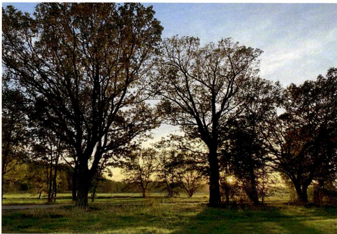
Zdjęcie nr 7. Dęby rosnące na działce przeznaczonej pod inwestycję – działka nr 175/2 (Kobiela). Dęby są blisko i ponad 100-letnie. Są drzewami będącymi Naszymi „lokalnymi pomnikami przyrody” charakterystycznymi dla pięknego krajobrazu Naszej wsi. Zdjęcie wykonano w październiku 2024 r.