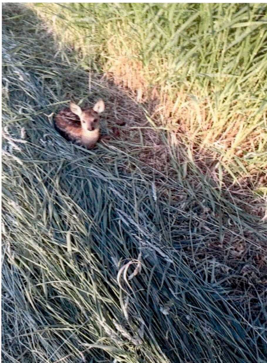
Zdjęcie nr 4. Mała sarenka bytująca na działce przeznaczonej pod inwestycję – działka nr 178 (Kobiela).