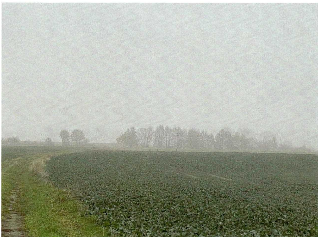
Zdjęcie nr 1. Sarny bytujące na działce nr 165 (Kobiela) – działka przeznaczona pod inwestycję dot. budowy farmy fotowoltaicznej.