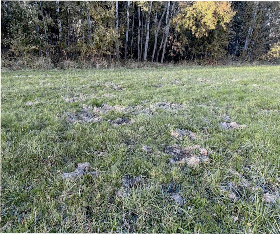
Zdjęcie nr 5. Ślady bytowania dzików na działce przeznaczonej pod inwestycję – działka nr 175/2 (Kobiela). Działka zlokalizowana przy kompleksie leśnym.