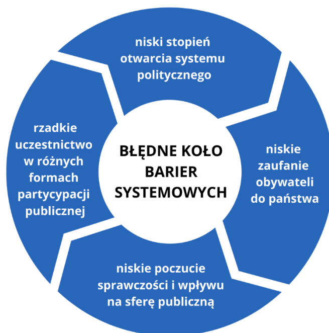
Diagram 2: Błędne koło barier systemowych