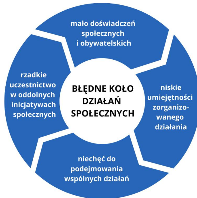
Diagram 1: Błędne koło działań dla społeczności