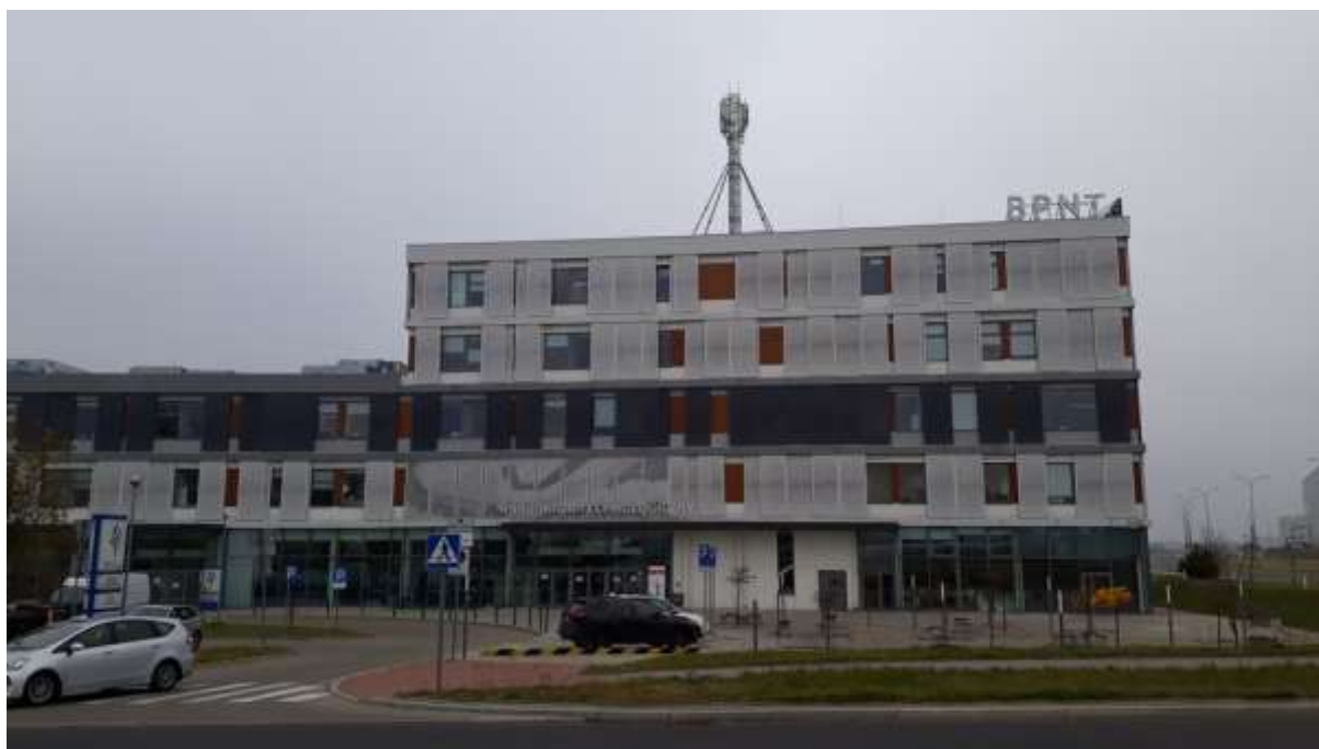
Fot. 1: Widoki anten stacji bazowej ID: BT13215, zlokalizowanej: ul. Żurawia 71, 15-540 Białystok