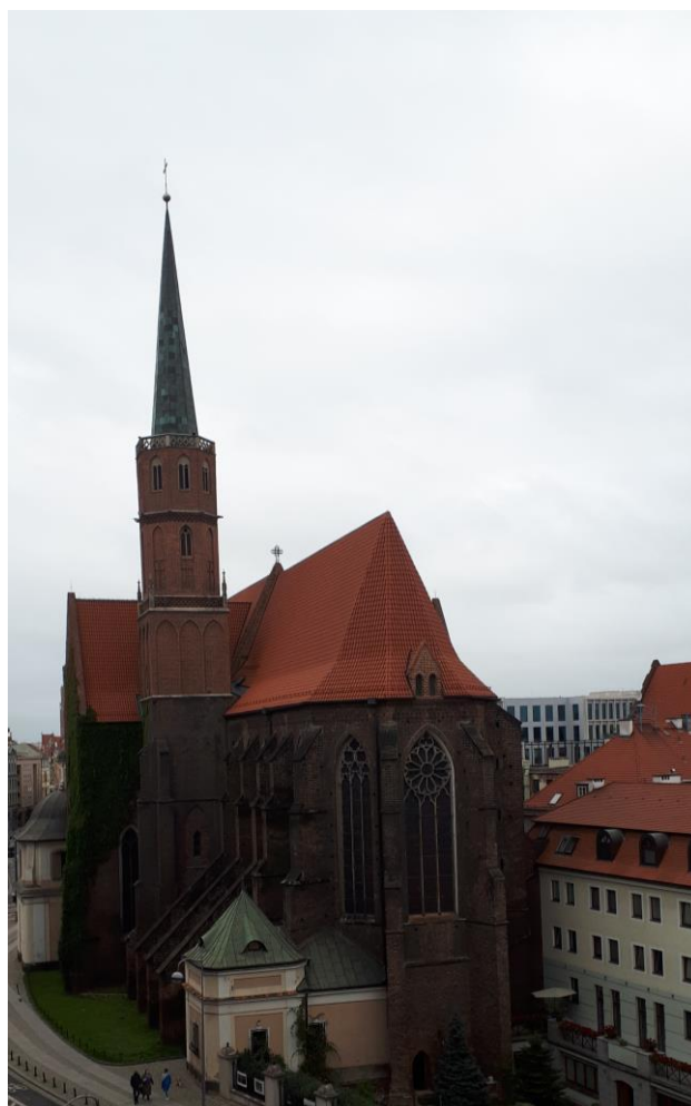
Fot. 1: Widoki anten stacji bazowej: ID: 14803, zlokalizowanej: pl. Dominikański 2, Wrocław