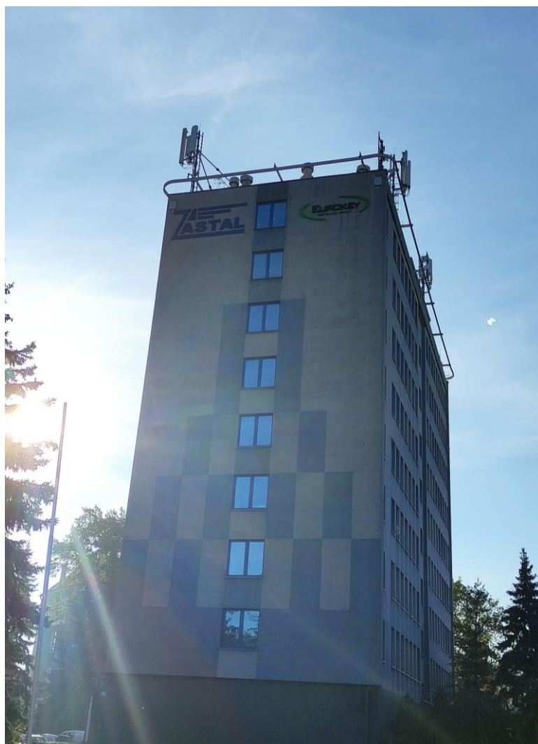
Fot. 1: Widoki anten stacji bazowych: ID: BT33530 oraz ID: 41090, zlokalizowanych: ul. Sulechowska 4a, Zielona Góra