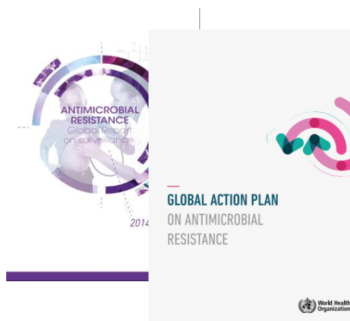
Rysunek 1 Raport Światowej Organizacji Zdrowia „Oporność drobnoustrojów na antybiotyki: raport podsumowujący monitorowanie antybiotykooporności na świecie w 2014 r.” (kwiecień 2014 r.) oraz „Światowy plan działania w zakresie antybiotykooporności” przyjęty przez Światowe Zgromadzenie Zdrowia (2015 r.)