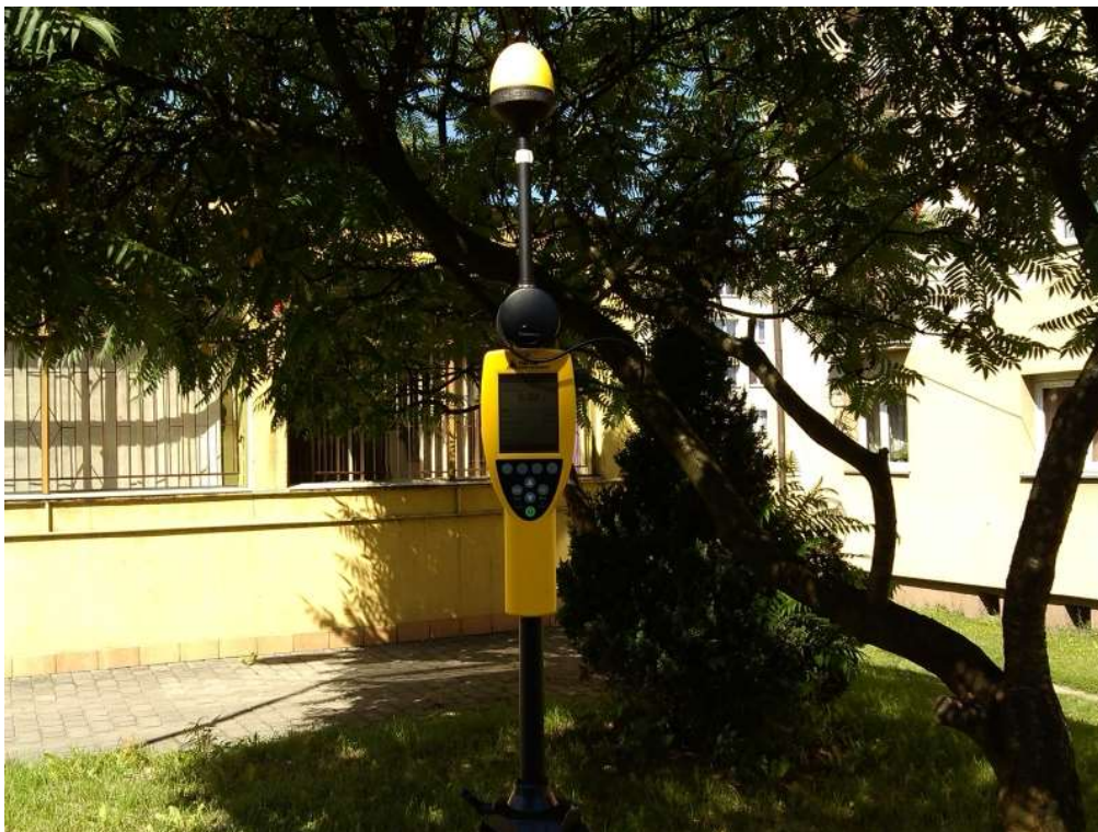
Fot. 4. Przyrząd pomiarowy w trakcie prowadzonego badania