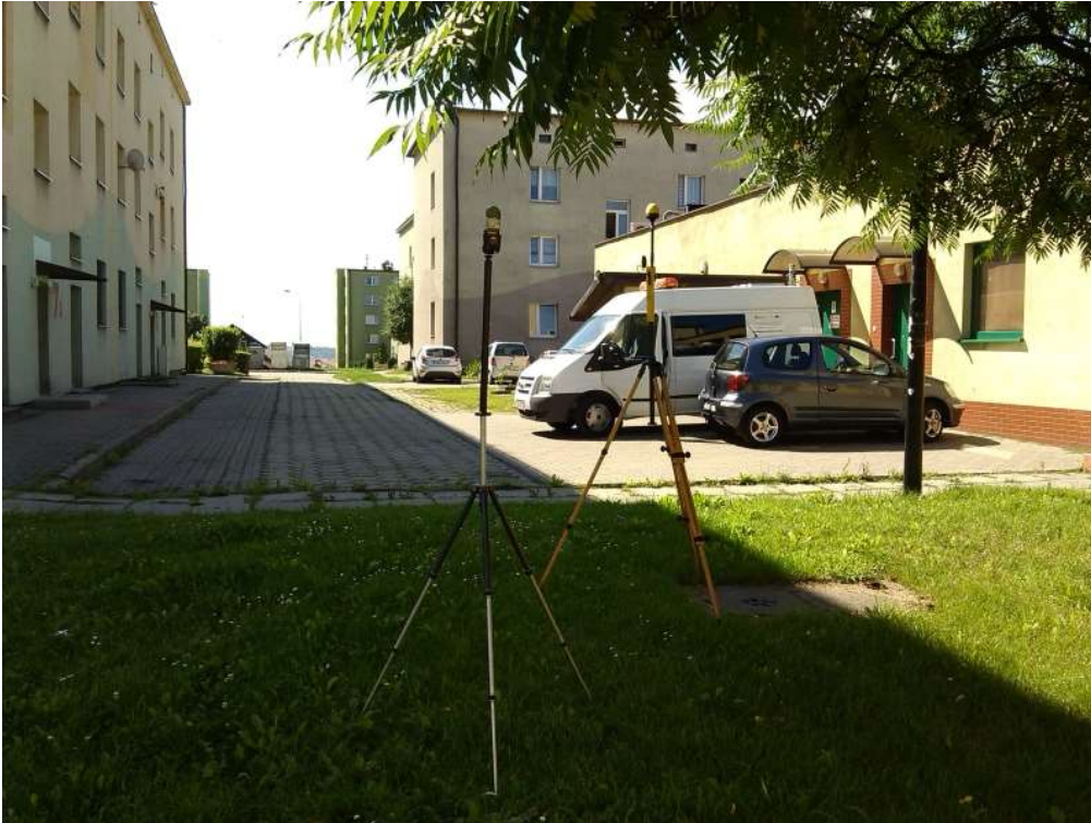
Fot. 1. Rejon badań, widok w kierunku południowym