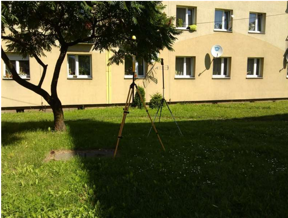
Fot. 3. Rejon badań, widok w kierunku północnym