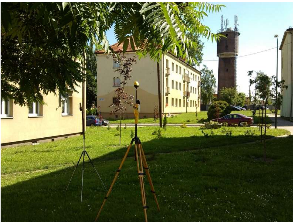
Fot. 2. Rejon badań, widok w kierunku wschodnim