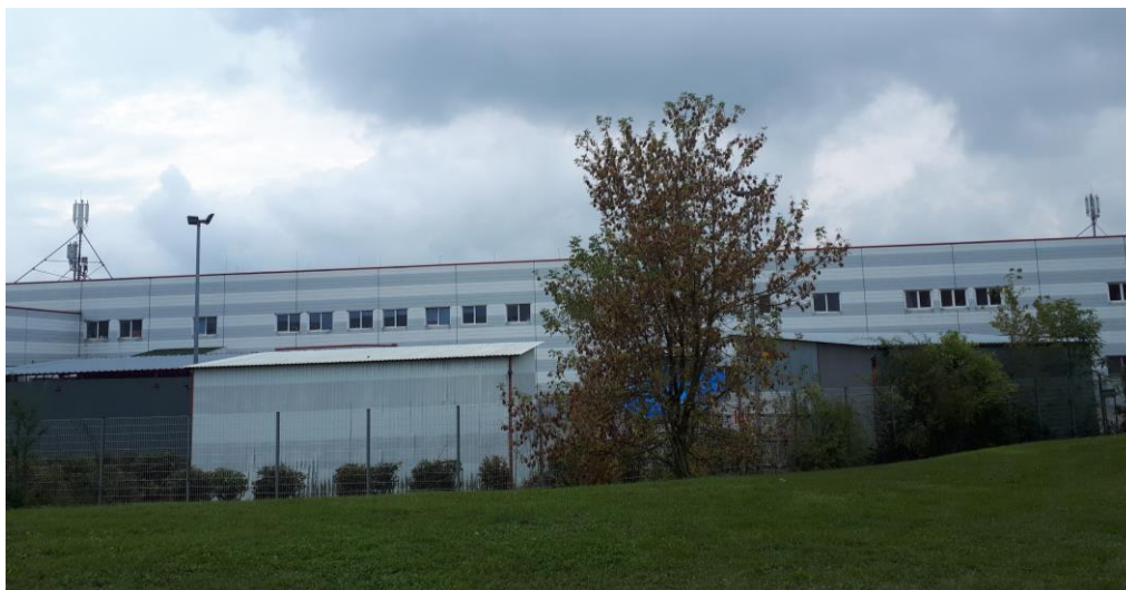
Fot. 1: Widok anten stacji bazowej ID: OPO1017_A, zlokalizowanej pod adresem: ul. Sosnkowskiego 16, 45-267 Opole