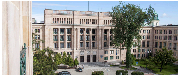
Stuletnia topola przed wejściem głównym

Z piaskowcem ozdabiającym modernistyczne linie gmachu doskonale harmonizują drzewa i krzewy rosnące w ogrodzie wewnętrznym, zabytkowa topola rosnąca przed wejściem głównym.