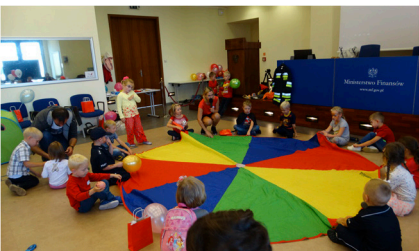
Dzieci w ministerstwie