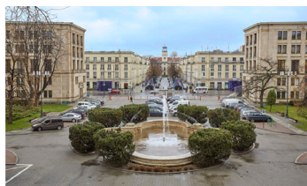
Dziedziniec, widok znad głównego wejścia

Z piaskowcem ozdabiającym modernistyczne linie gmachu doskonale harmonizują drzewa i krzewy rosnące w ogrodzie wewnętrznym, zabytkowa topola rosnąca przed wejściem głównym.