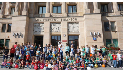
Grupa dzieci przed głównym wejściem ministerstwa

Rok 2017 – pracownicy w ramach wolontariatu zmieniają ministerstwo w rodzinny plac zabaw