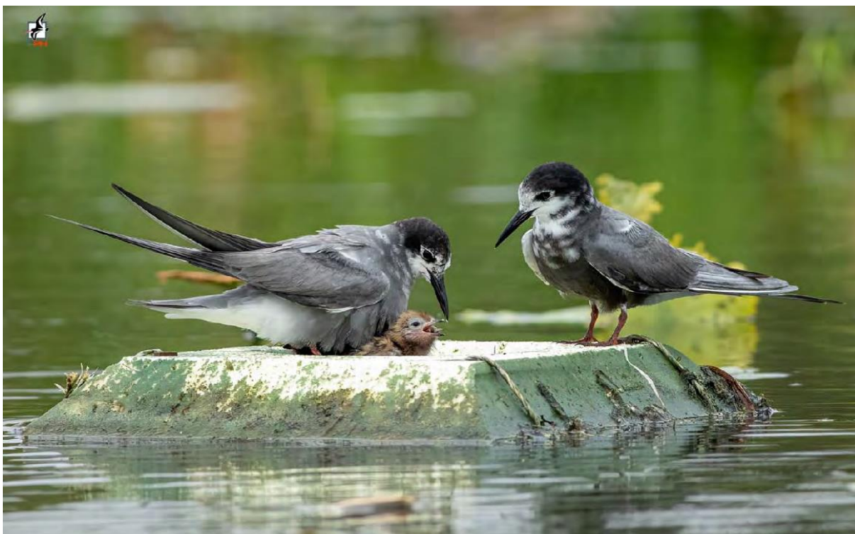
Fot. 3. Rybitwy czarne na platformach. Dolina Tyśmienicy, lipiec 2024.