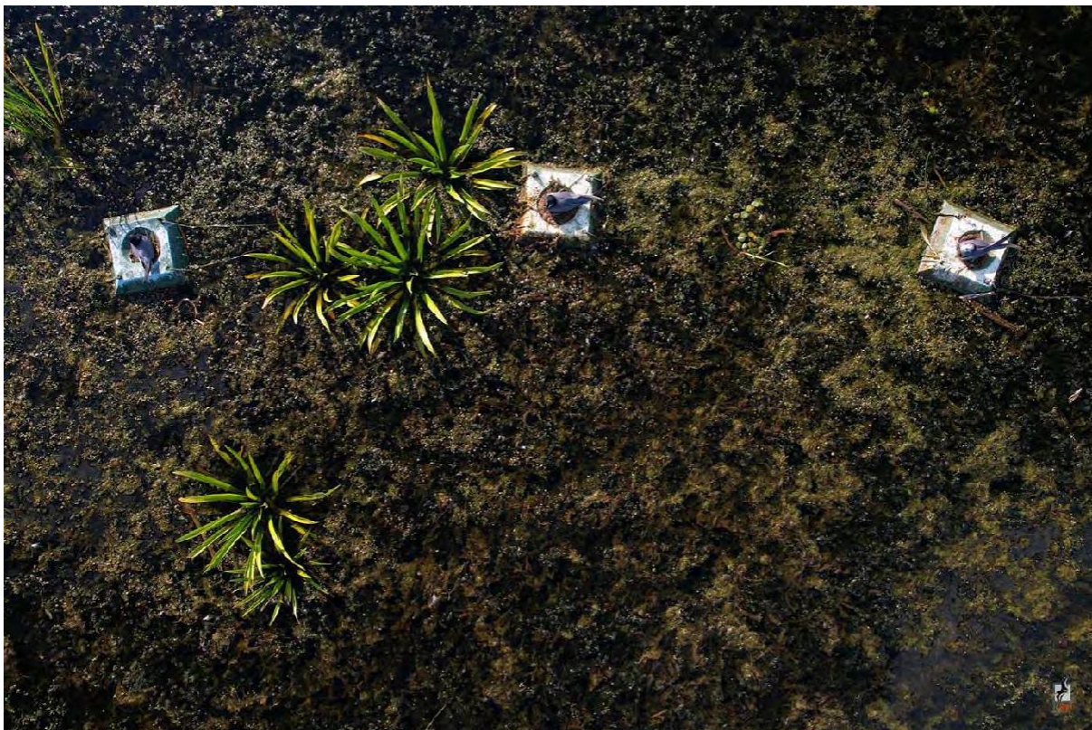
Fot. 2. Zajęte platformy w Dolinie Tyśmienicy.