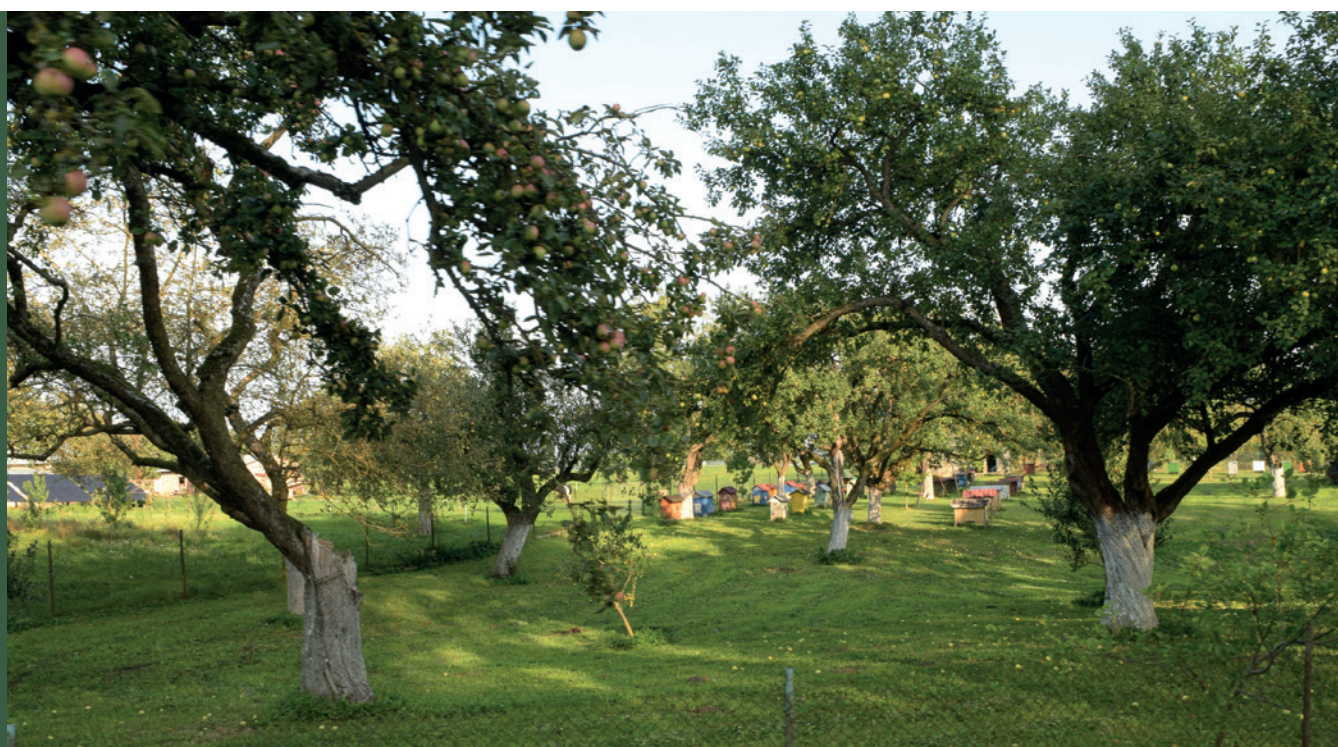
■ Sad tradycyjny z ulami

W sadach tradycyjnych odmian drzew owocowych objętych zobowiązaniem rolno-środowiskowo-klimatycznym zakazane jest stosowanie środków ochrony roślin, z wyłączeniem tych dopuszczonych do stosowania w rolnictwie ekologicznym.