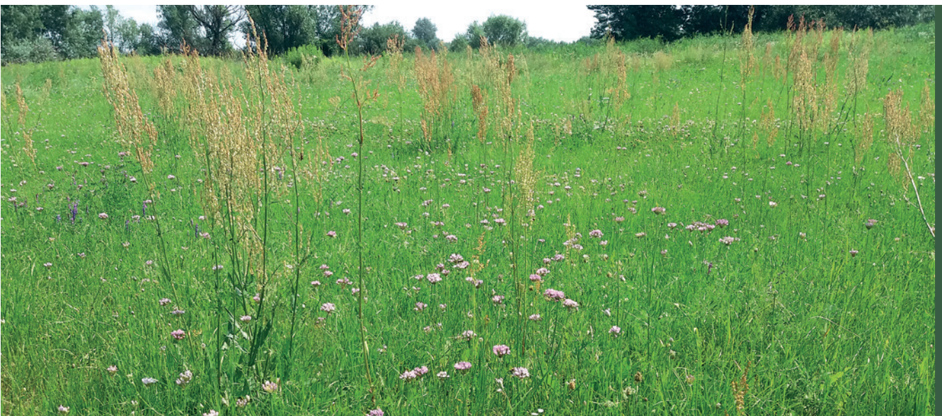
■ Łąka selernicowa

Łąki selernicowe należą do najcenniejszych półnaturalnych zbiorowisk roślinnych w Polsce. Najczęściej występują w dolinach dużych rzek, miejscach okresowo lub regularnie zalewanych. Słonorośla z kolei występują w zasięgu działania wód słonych i słonawych wód powierzchniowych lub podziemnych. Tradycyjna gospodarka na łąkach selernicowych i słonoroślach to ekstensywne użytkowanie kośne lub pastwiskowe lub kośno-pastwiskowe.