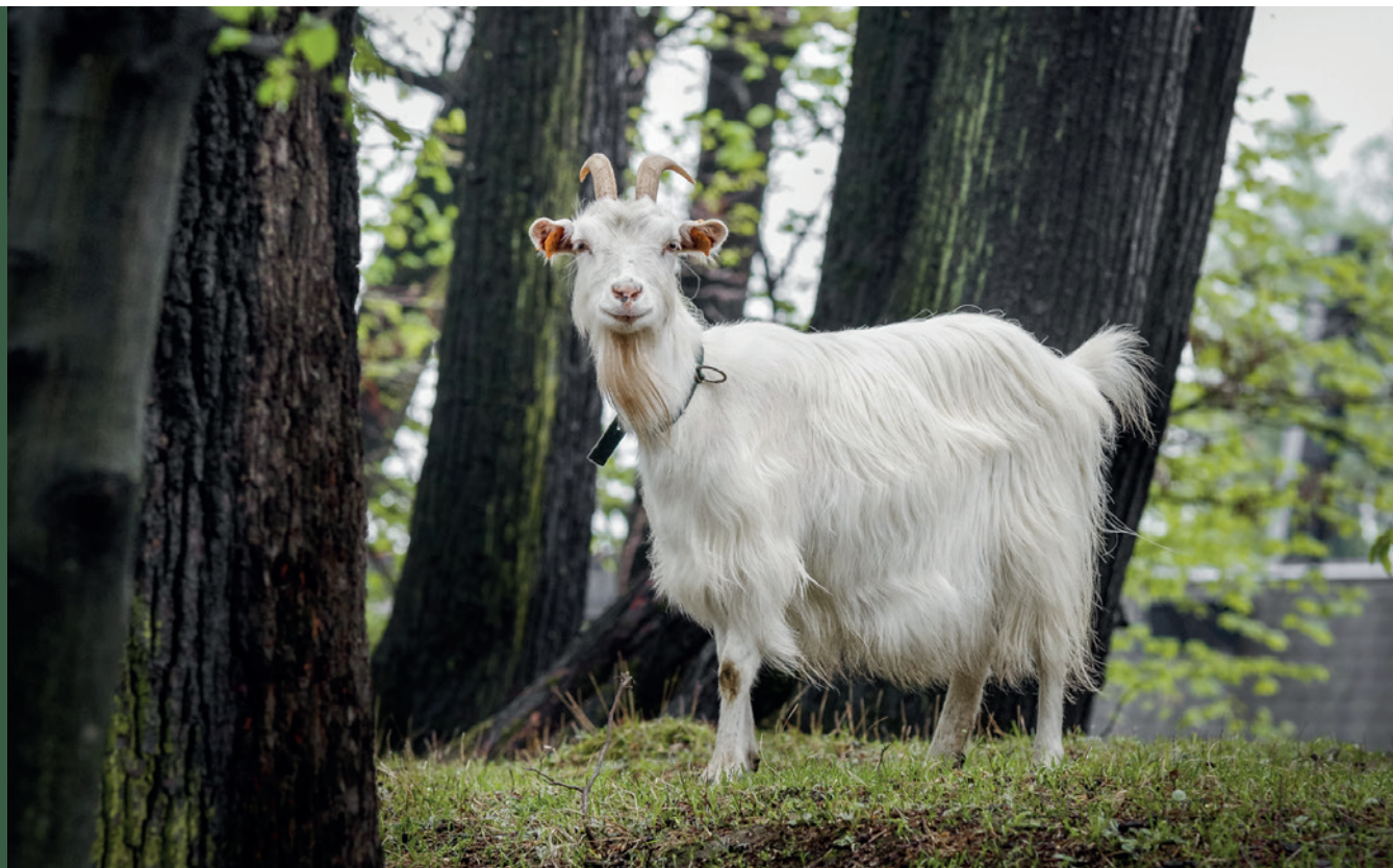
■ Koza karpacka

Kozy (wsparcie do samic; stawka płatności uwzględnia utrzymanie samców): kozy karpackie, kozy sandomierskie i kozy kazimierzowskie.