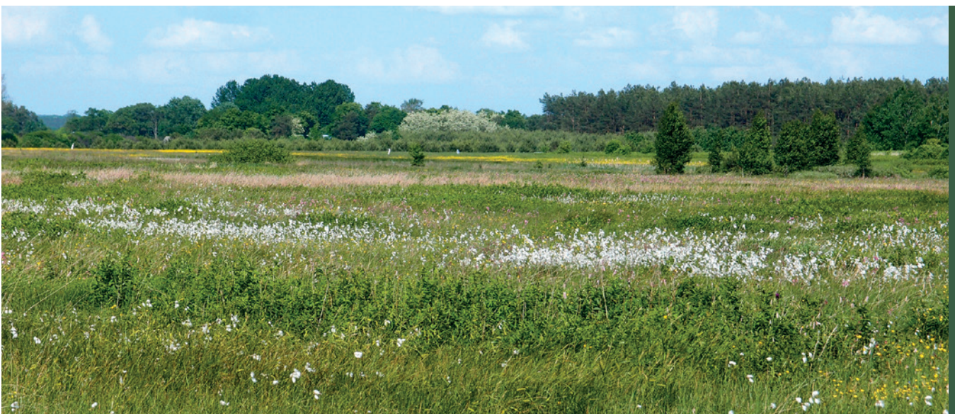
■ Mozaika torfowisk / fot. P. Kalinowski

Zbiorowiska roślinne torfowisk wysokich budowane są przez bardzo nieliczną, ekologicznie bardzo wyspecjalizowaną grupę roślin, głównie mchy (w tym torfowce), krzewinki, zielne byliny o trawiastym pokroju, sporadycznie gatunki krzewiaste i drzewiaste. Cechuje je stałe wysokie uwilgotnienie, często kwaśny odczyn. Obecnie głównym problemem, powodującym redukcję powierzchni torfowisk, jest zaniechanie ich użytkowania oraz odwadnianie. Tradycyjne użytkowanie polega na prowadzeniu ekstensywnej gospodarki łąkarskiej.