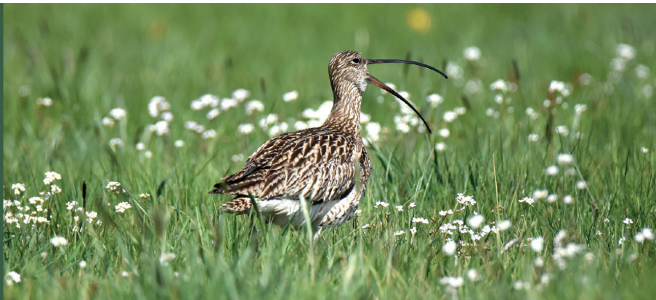
■ Kulik wielki