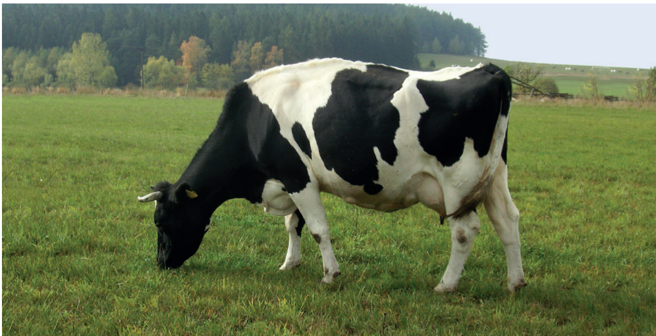
■ Krowa rasy polskiej czarno-białej

Bydło (wsparcie do samic i samców w użytkowaniu mlecznym i mięsnym): polskie czerwone, biało-żółte, polskie czerwono-białe, polskie czarno-białe.