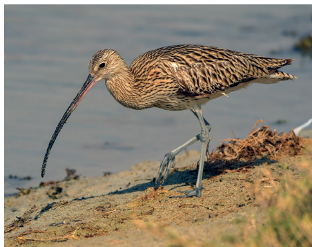
■ Kulik wielki