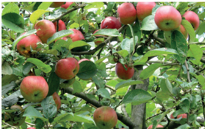
■ Kantówka Gdańska

W ramach zobowiązania beneficjent musi utrzymywać sad, w którym jest co najmniej 12 starych, tj. co najmniej 15-letnich drzew, z czterech różnych odmian lub gatunków, rozmnażanych