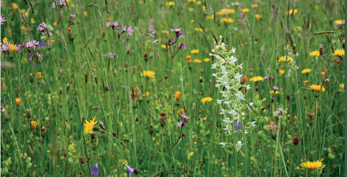
■ Łąka świeża

Łąki świeże to antropogeniczne zbiorowiska użytków zielonych wykształcone na żyznych, niezabagnionych siedliskach mineralnych. Należą one do najlepszych użytków zielonych pod względem gospodarczym. Zarówno ograniczenie użytkowania, jak i jego intensyfikacja prowadzi do przekształcania się łąk świeżych w inne typy użytków zielonych. Brak koszenia sprzyja odkładaniu się obumarłych szczątków roślin, co prowadzi do ubożenia składu gatunkowego. Pozostawianie skoszonego siana natomiast powoduje ekspansję wysokich bylin i eutrofizację siedliska. Tradycyjne użytkowanie polega przede wszystkim na dwukrotnym koszeniu.