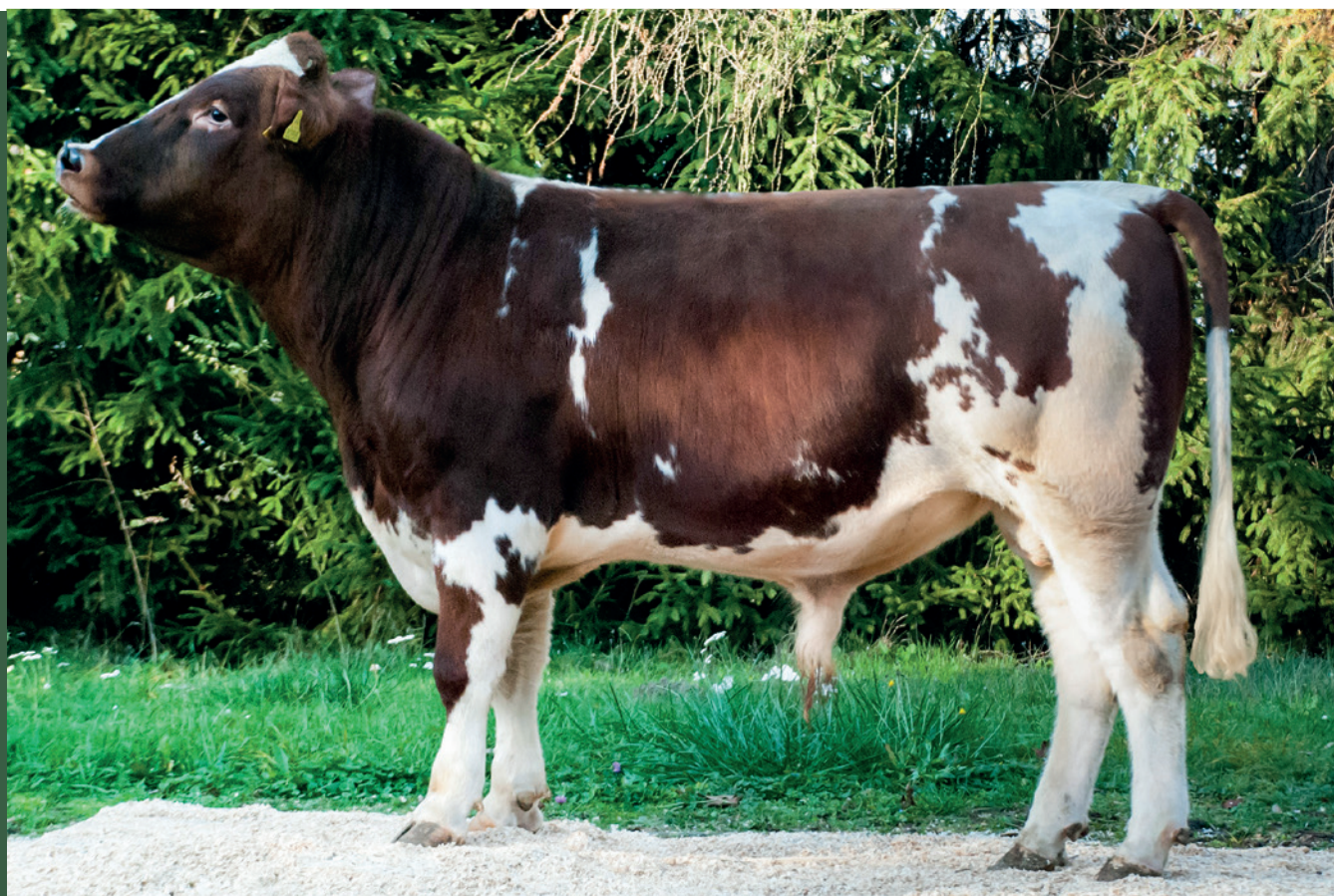
■ Buhaj rasy polskiej czerwono białej

Z dodatkowej „płatności do buhajów” ras zachowawczych skorzystać będą mogli hodowcy buhajów hodowlanych zakwalifikowanych do pobrania materiału biologicznego na potrzeby realizacji Programu ochrony zasobów genetycznych dla poszczególnych ras bydła (pochodzących z planowanych kjojarzeń z matkami buhajów). W tym celu niezbędne będzie okresowe przemieszczenie zwierzęcia z gospodarstwa hodowcy do centrum pozyskiwania nasienia na okres kwarantanny, przygotowania buhaja do oddania nasienia, wykonania niezbędnych badań weterynaryjnych, pobrania nasienia od buhaja i przekazania go na rzecz Krajowego Banku Materiałów Biologicznych w Balicach.