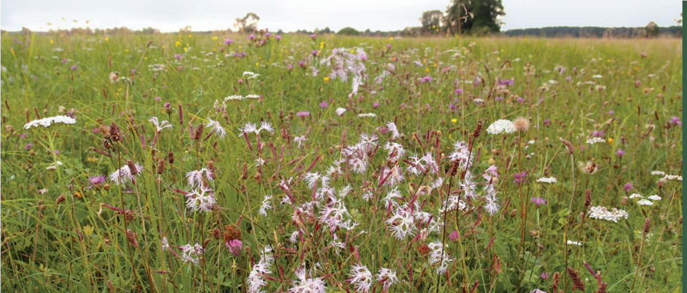
■ Łąka trzęślicowa

Zmiennowilgotne łąki trzęślicowe należą do najcenniejszych i obecnie najsilniej zagrożonych siedlisk łąkowych. Występują najczęściej na niewielkich wyniesieniach pośród bagien lub na ich obrzeżach, na siedliskach charakteryzujących się wysokim poziomem wód gruntowych wiosną. Najważniejszą cechą tych zbiorowisk jest zmiennej poziom wody gruntowej – na początku okresu wegetacyjnego jest on bardzo wysoki i łąki mogą być zalane, a w lecie opada nisko, często poza zasięg systemu korzeniowego wielu roślin. Zagrożeniem dla omawianego typu łąk jest intensyfikacja użytkowania, pozostawianie skoszonej biomasy na łące oraz zmiany stosunków wodnych.