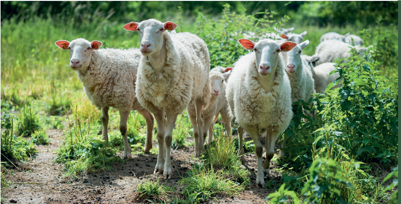
■ Owce olkuskie

Owce (wsparcie do samic; stawka płatności uwzględnia utrzymanie samców): wrzosówki, świniarki, olkuskie, polskie owce górskie odmiany barwnej, merynosy odmiany barwnej, uhruskie, wielkopolskie, żelaźnieńskie, korideil, kamienieckie, pomorskie, cakle podhalańskie, merynosy polskie w starym typie, czarnogłówki, polskie owce pogórza, polskie owce górskie i białołowe owce mięsne.