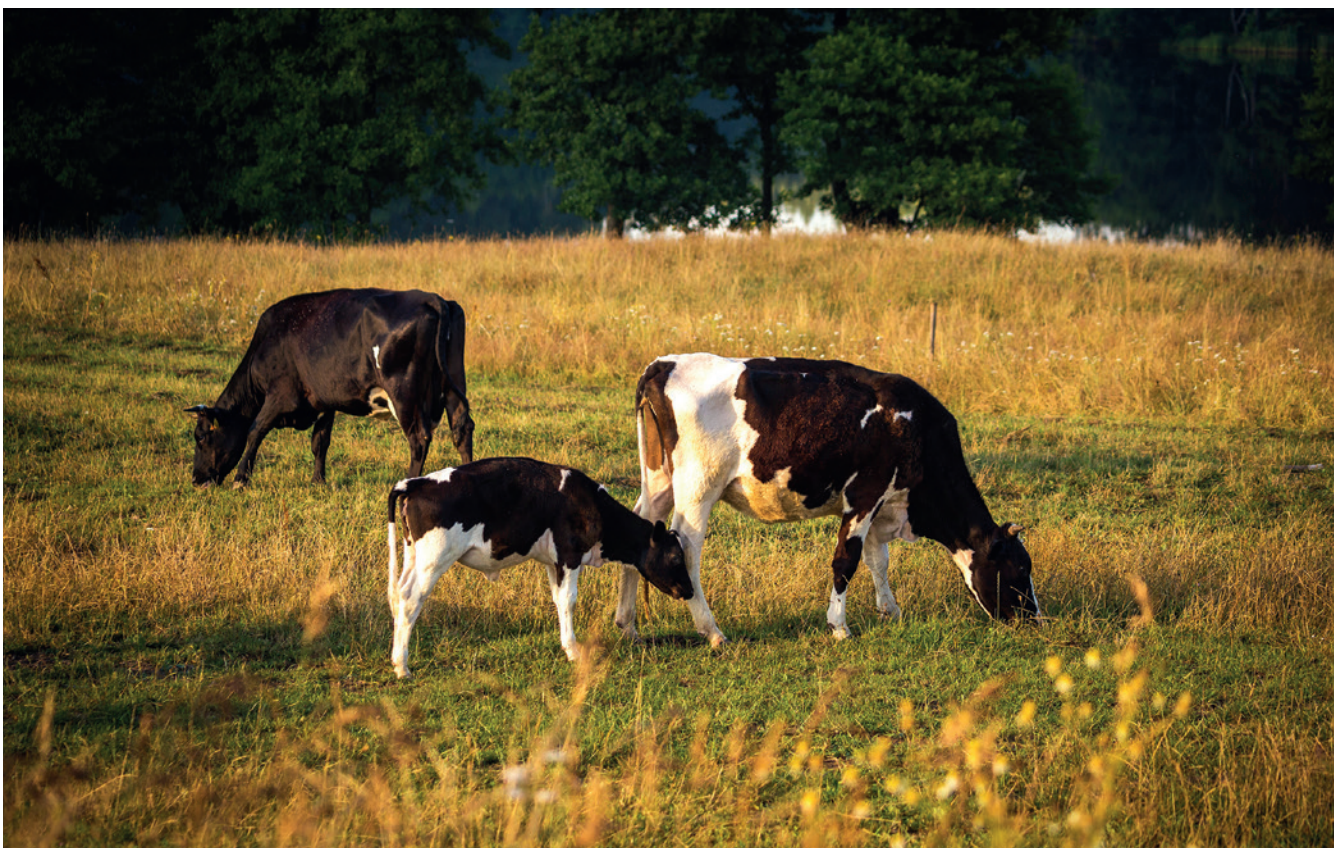
■ Łąka użytkowana ekstensywnie

Interwencję można wdrażać na trwałych użytkach zielonych położonych na obszarach Natura 2000, na których nie występują przedmioty ochrony wspierane w ramach Interwencji 1. Ochrona cennych siedlisk i zagrożonych gatunków na obszarach Natura 2000 (konkretne siedliska i gatunki ptaków). W interwencji tej beneficjenci zobowiązani są do realizacji wymogów związanych z ekstensywnym rolniczym użytkowaniem obejmującym w szczególności stosowanie odpowiedniej liczby pokosów, ekstensywny wypas zwierząt, dostosowanie terminu koszenia/wypasu do potrzeb ochrony przyrody.