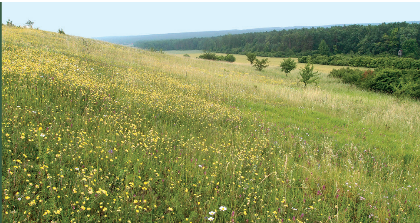
■ Murawy kserotermiczne

Murawy to ciepłolubne zbiorowiska trawiaste o wyraźnie kępowej budowie oraz bogatym i zróżnicowanym składzie gatunkowym. Są to jedne z najrzadszych zbiorowisk roślinnych Polski o szczególnym znaczeniu dla zachowania różnorodności biologicznej. Zachowanie ciepłolubnych muraw napiaskowych zależy w dużej mierze od ekstensywnej gospodarki pasterskiej.