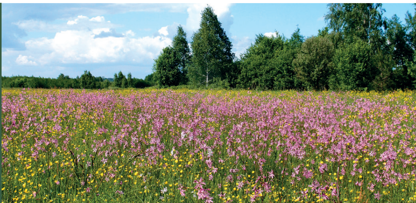
■ Łąka wilgotna

Cechą swoistą łąk wilgotnych jest duży udział okazałych bylin i ziołorośli. Pod względem gospodarczym należą one do ekstensywnych, dość wydajnych użytków zielonych. Zbiorowiska te powinny być koszone najwyżej dwa razy w roku. W miarę zwielokrotnienia koszenia wzrasta w składzie ich runi udział traw, ale zmniejsza się liczba gatunków. Tradycyjne użytkowanie polega na maksymalnie dwukrotnym koszeniu, ograniczonym nawożeniu oraz użytkowaniu kośnym, w uzasadnionych przypadkach kośno-pastwiskowym.