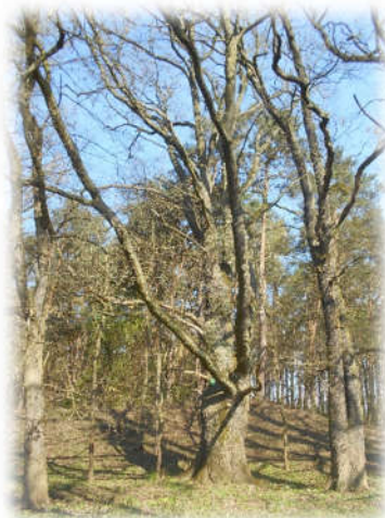
Pomnik przyrody Dąb szypułkowy w Leśnictwie Cigacice, oddział 294b