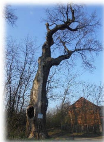
Pomnik przyrody „Jagiełło” w Leśnictwie Cigacice, oddział 190s

Wykaz istniejących pomników przyrody w zarządzie Nadleśnictwa Sulechów (Weryfikacja i aktualizacja informacji przestrzennej i opisowej o pomnikach przyrody i użytkach ekologicznych na terenie Polski, GDOŚ, 2015)