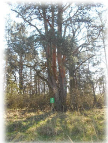
Pomnik przyrody „Sosna Rzepicha” w Leśnictwie Cigacice, oddział 284p

Na gruntach w zarządzie Nadleśnictwa Sulechów zlokalizowanych jest 39 pomników przyrody: 29 pojedynczych drzew, 6 grup drzew, 3 powierzchniowe oraz 1 głąz narzutowy.