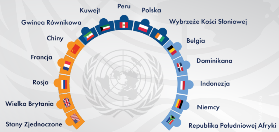
● STALI CZŁONKOWIE ● NIESTALI CZŁONKOWIE DO 2019 R. ● NIESTALI CZŁONKOWIE DO 2020 R.