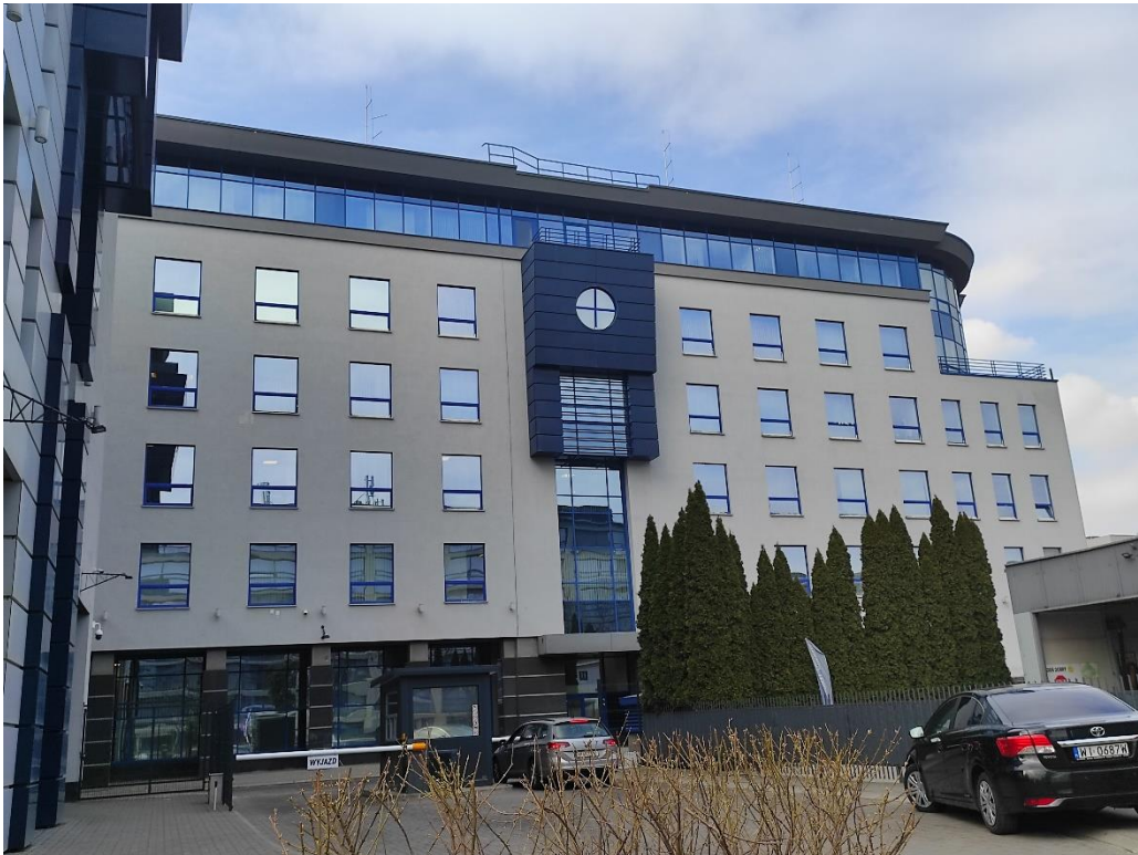
Budynek B (skrzydło północno-wschodnie)

Poniżej zdjęcia okien i aktualnego stanu okleiny okiennej: