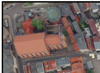
KOŚCIÓŁ WNIĘBOWZIĘCIA NMP