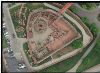
RUINY ZAMKU KRZYŻACKIEGO

W serwisie geoportal.gov.pl prezentowanych jest wiele danych i usług, które umożliwiają analizę tego terenu.