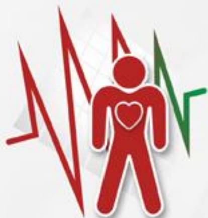
PRZYSPIESZONA CZYNNOŚĆ SERCA