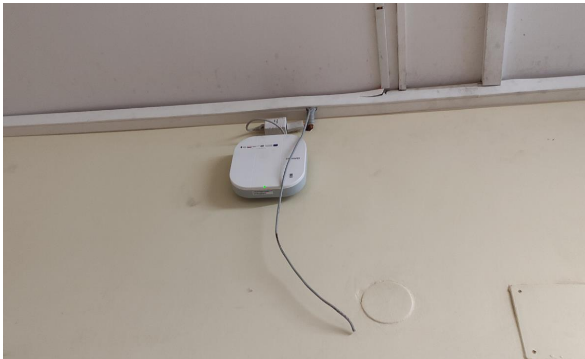
Fot. 1: Widok punktu dostępowego model AP4050DN