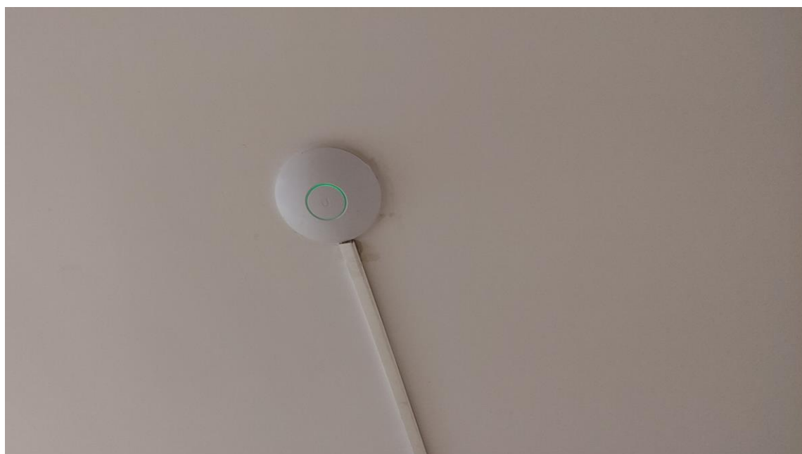
Fot. 2: Widok punktu dostępowego model UniFi AP LR