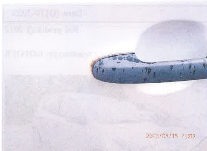
Fot. 5 P5150017