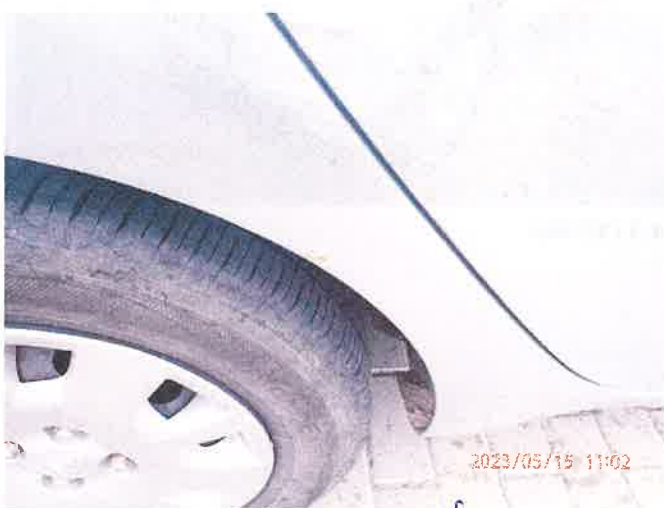
Fot. 10 P5150022

Biuro Rzeczoznawstwa Samochodowego, Ruchu Drogowego, Wymowy Maszyn i Urządzeń inż. Mirosław Kołomański 83-200 Starogard Gdański NIP 1921333663