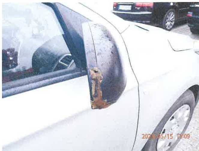
Fot. 28 P5150044