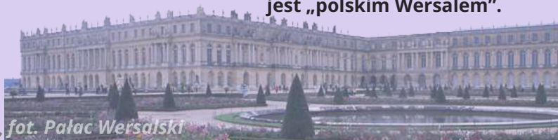
fot. Pałac Wersalski

Pałac w Wilanowie nazywany jest „polskim Wersalem”.