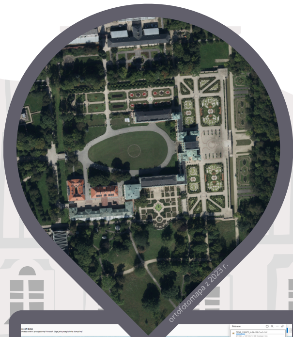
ortofotomapa z 2023 r.