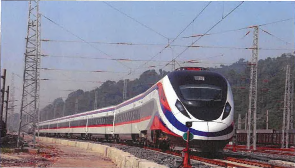
Pociąg ekspresowy w Laosie (fot. Laos China Railway Company) any)

Fanpage Laos China Railway Company na Facebooku