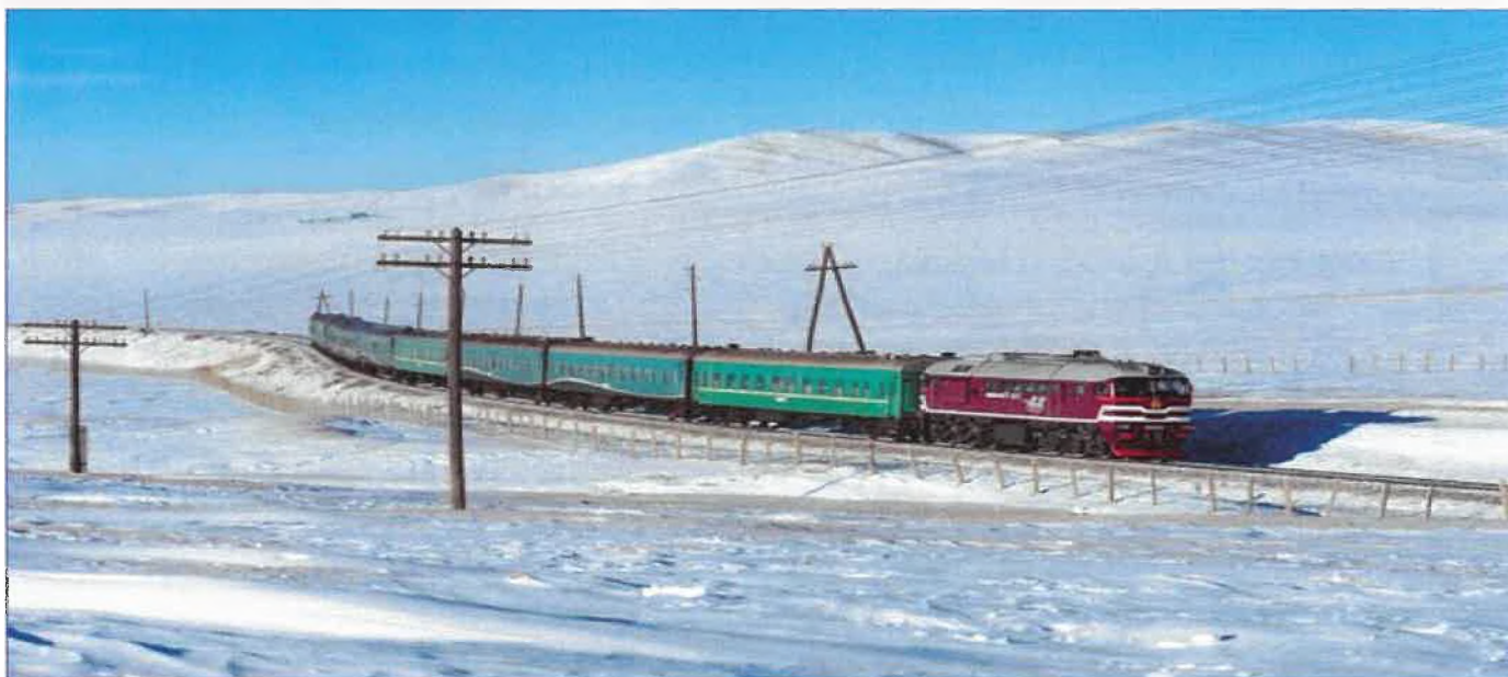
Mongolski pociąg

(...) W 2022 roku została otwarta linia kolejowa z Tavan Tolgoi do Gashuun Sukhait (233,6 km), gdzie łączy się z chińską siecią kolejową. Linia została w całości wybudowana przez Mongołów i jest pierwszą linią kolejową, która jest w stu procentach własnością Mongolii. Została także w całości zbudowana w rozstawie 1435 mm, przez co nie ma konieczności wymiany wózków w wagonach na granicy.