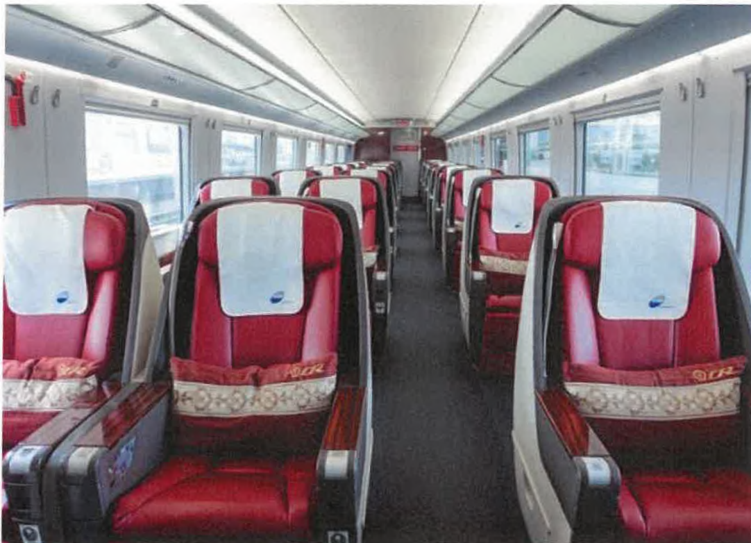
Kuszetki - Klasa biznes pociągu ekspresowego z Wientian