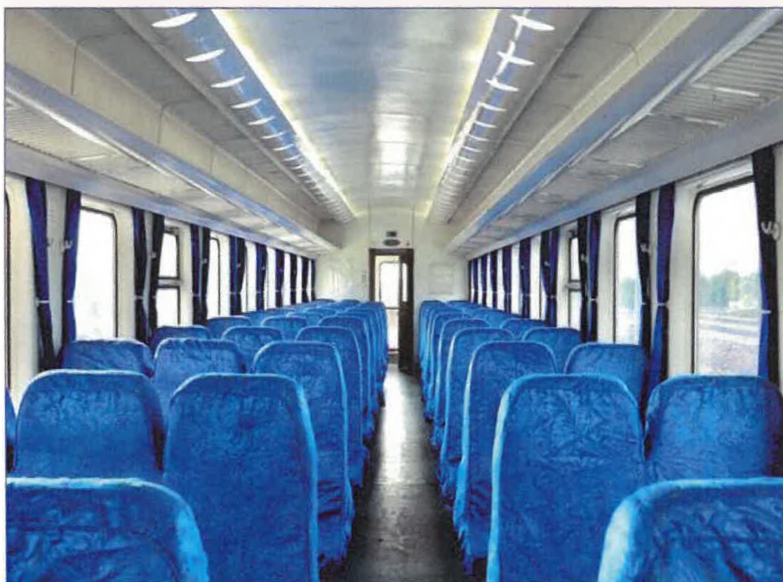
Wnętrze wagonu w zwykłym pociągu

28.) www. Polacy w Laosie. Youtube.pl Tv