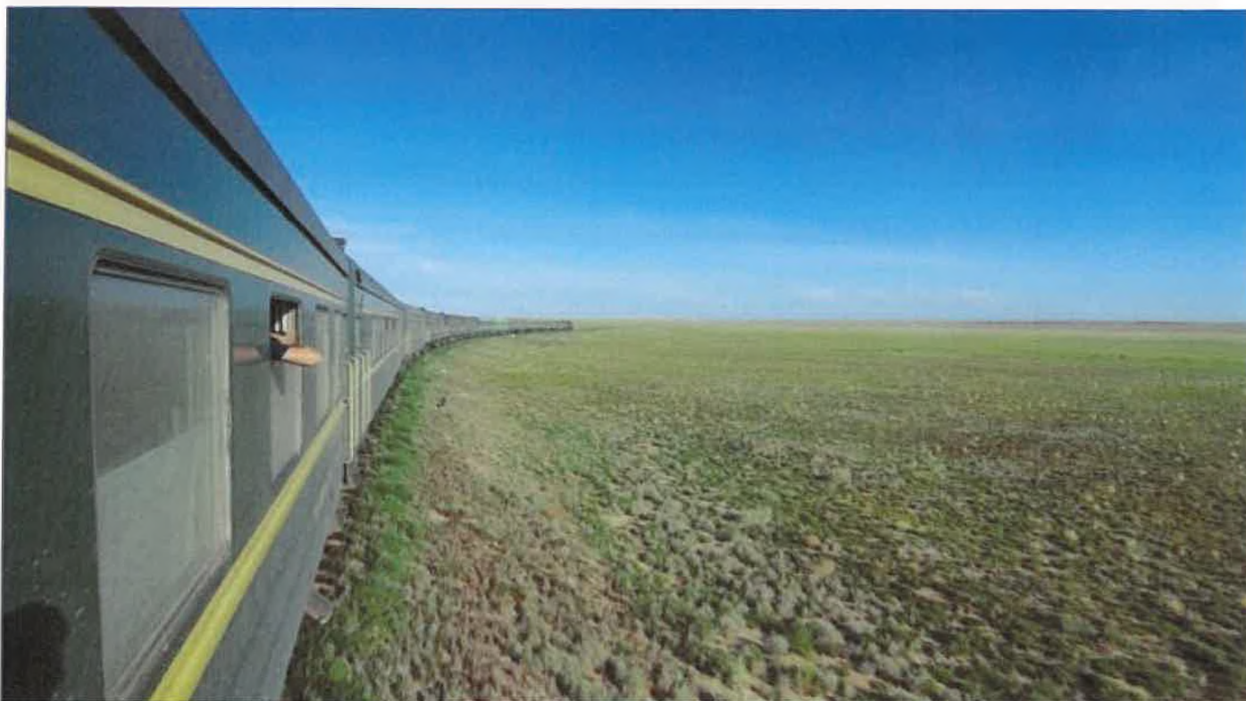
Pociąg Moskwa – Pekin przejeżdża przez Mongolię

Przy dworcu kolejowym Ulan Bator utworzono niewielkie muzeum kolejnictwa z plenerową wystawą taboru kolejowego.