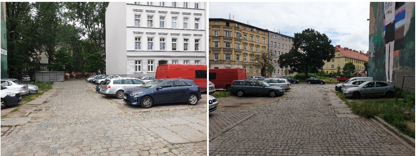
Zdjęcia przedmiotowej nieruchomości, położonej w obszarze osiedla Nadodrze przy ulicy Ołbińskiej 14A we Wrocławiu