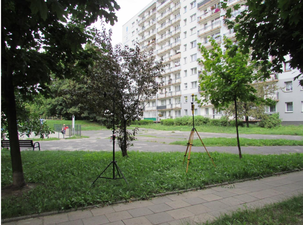
Fot. 1 Rejon badań, widok w kierunku północno – zachodnim (NW)