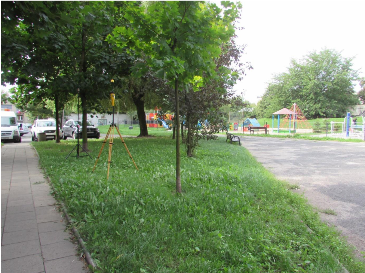
Fot. 2 Rejon badań, widok w kierunku południowo – zachodnim (SW)