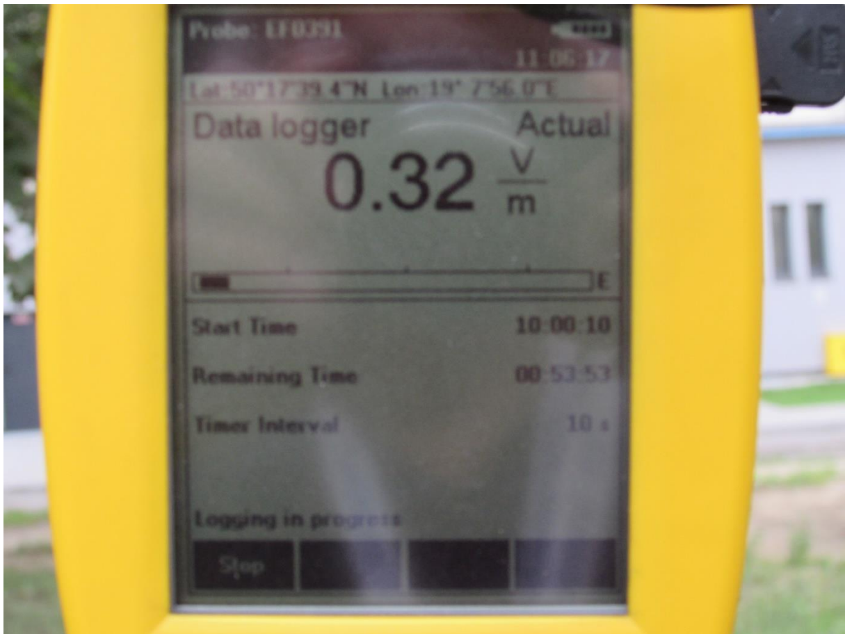
Fot. 3 Przyrząd pomiarowy w trakcie wykonywanego badania