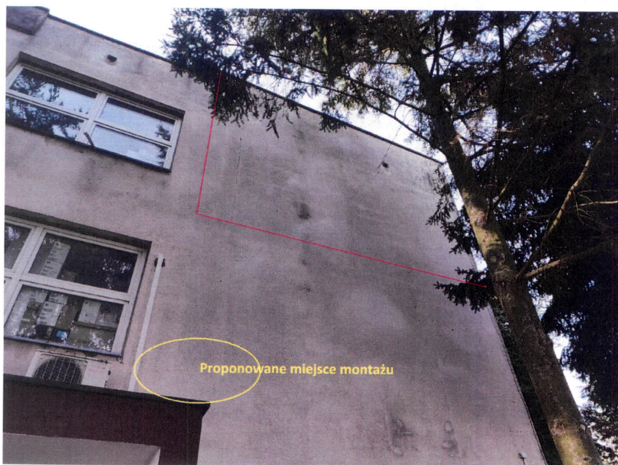
Proponowane miejsce montażu jednostki zewnętrznej