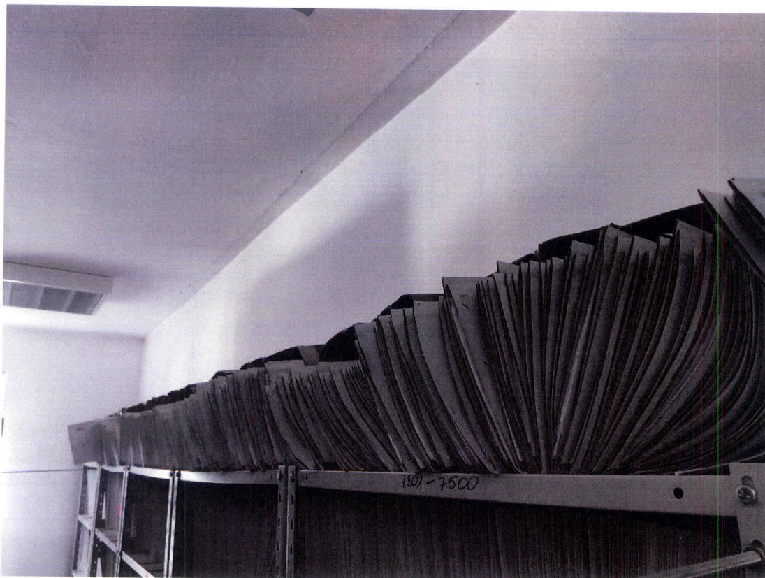
Pomieszczenie, w którym zamontowany ma zostać klimatyzator