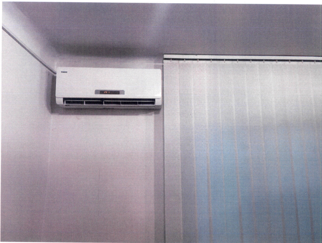
Miejsce montażu jednostki wewnętrznej przeznaczonej do wymiany w pomieszczeniu serwerowni.