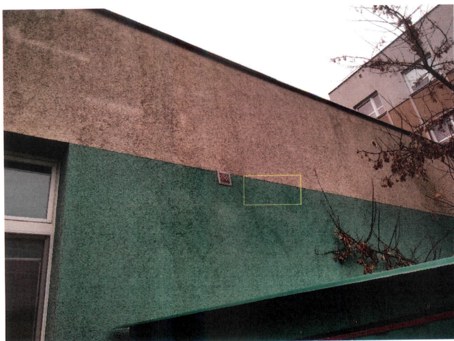
Proponowane miejsce montażu jednostki zewnętrznej