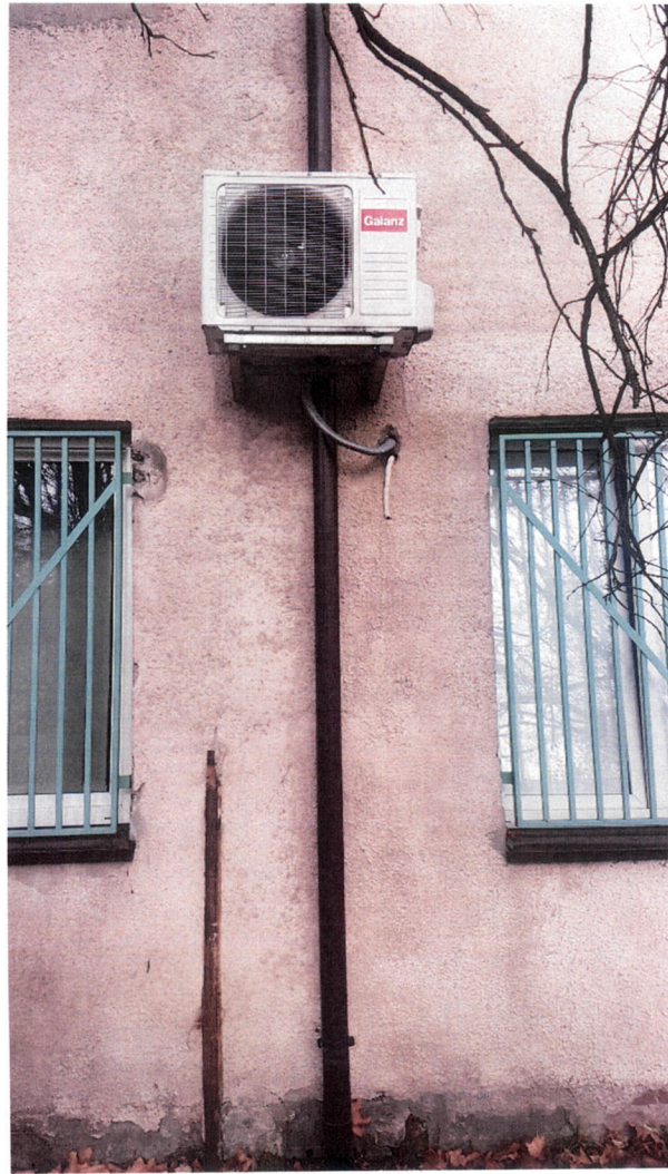
Miejsce montażu jednostki zewnętrznej przeznaczonej do wymiany.