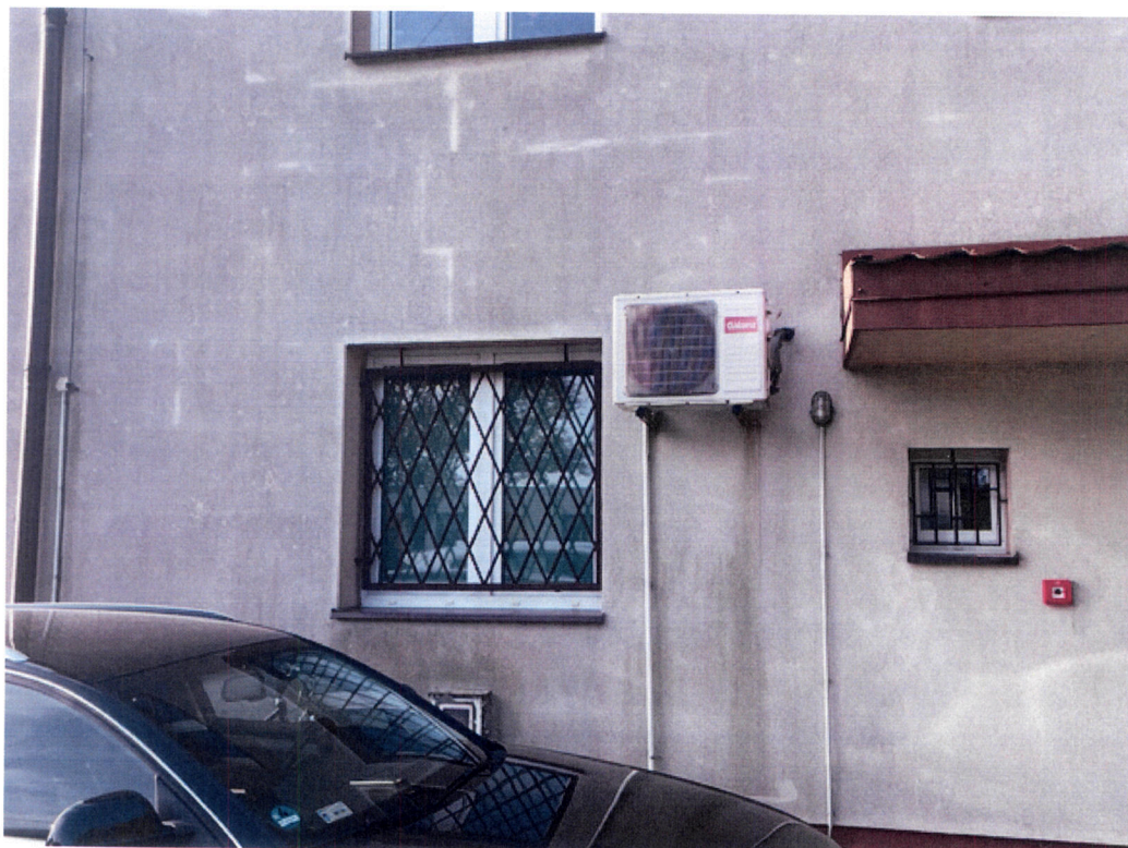
Miejsce montażu jednostki zewnętrznej przeznaczonej do wymiany.