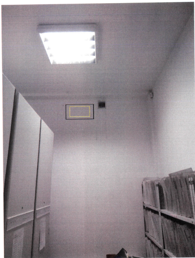
Pomieszczenie, w którym zamontowany ma zostać klimatyzator oraz proponowane miejsce montażu jednostki wewnętrznej