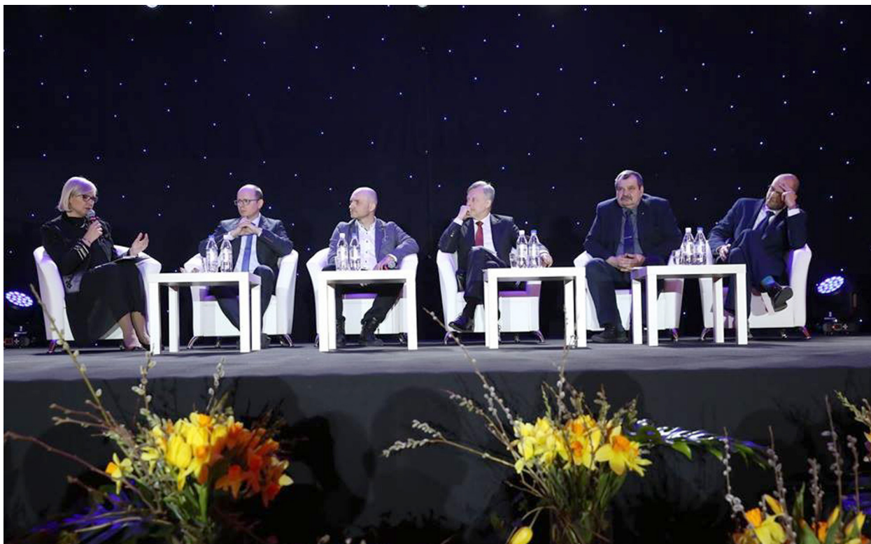
Konferencja Rzecznik Praw Pacjenta - rzecznikiem polskiej psychiatrii