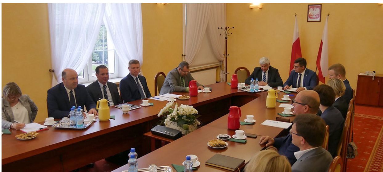
Debata na temat utworzenia oddziału psychiatrii dla dzieci i młodzieży na Podlasiu