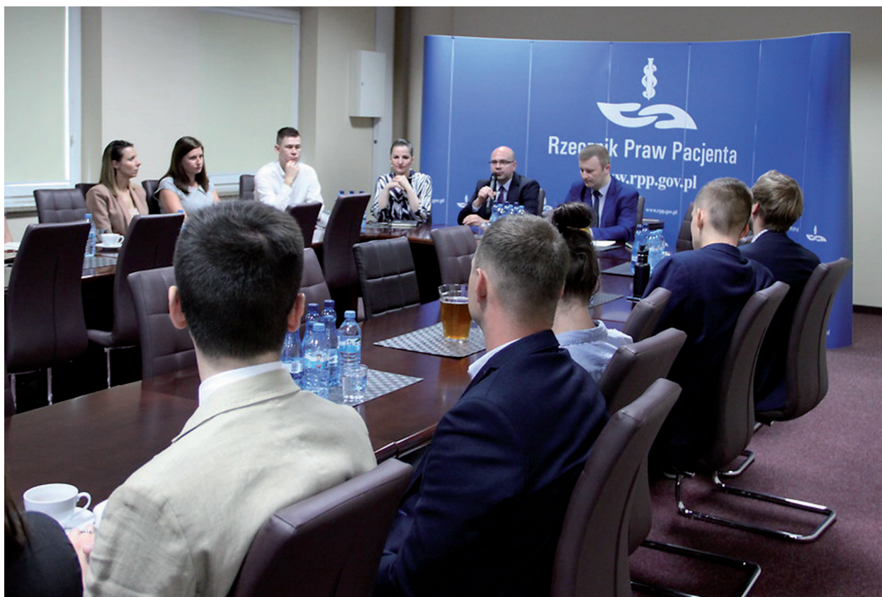
Pierwsze inauguracyjne posiedzenie Rady Młodych Ekspertów