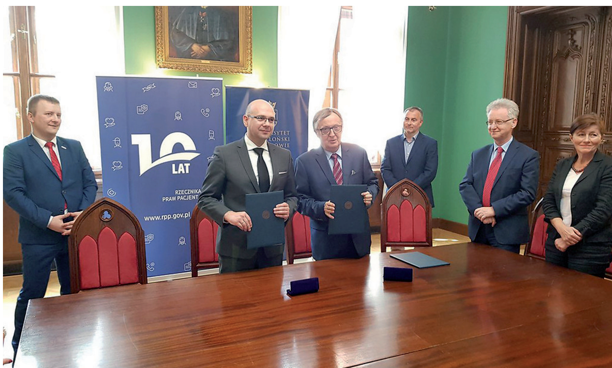
Porozumienie Rzecznika Praw Pacjenta i Rektora Uniwersytetu Jagiellońskiego

Wskazane jest również przygotowanie i wydanie publikacji edukacyjnej dotyczącej problematyki psychiatrii dzieci i młodzieży, opracowanie rozwiązań z zakresu praw pacjenta dotyczących subpopulacji małych dzieci oraz poradnika dla najmłodszych pacjentów, rodziców i opiekunów. W tym celu w maju 2019 roku zostało podpisane porozumienie o współpracy pomiędzy Rzecznikiem Praw Pacjenta a Uniwersytetem Jagiellońskim w Krakowie.