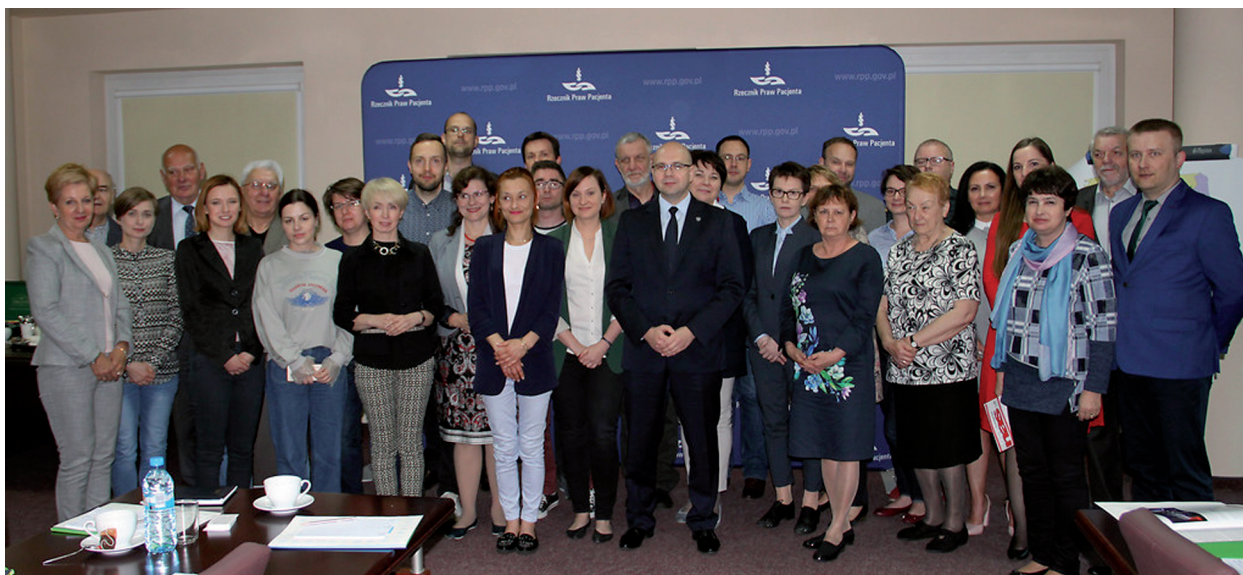
Spotkanie z organizacjami pozarządowymi „U Rzecznika na Młynarskiej”

Kolejne spotkanie odbyło się 6 listopada 2019 r. jako Rady Organizacji Pacjentów (ROP). Rzecznik otrzymał pierwsze propozycje, uwagi i sugestie dotyczące jej funkcjonowania. Wśród nich znalazły się: