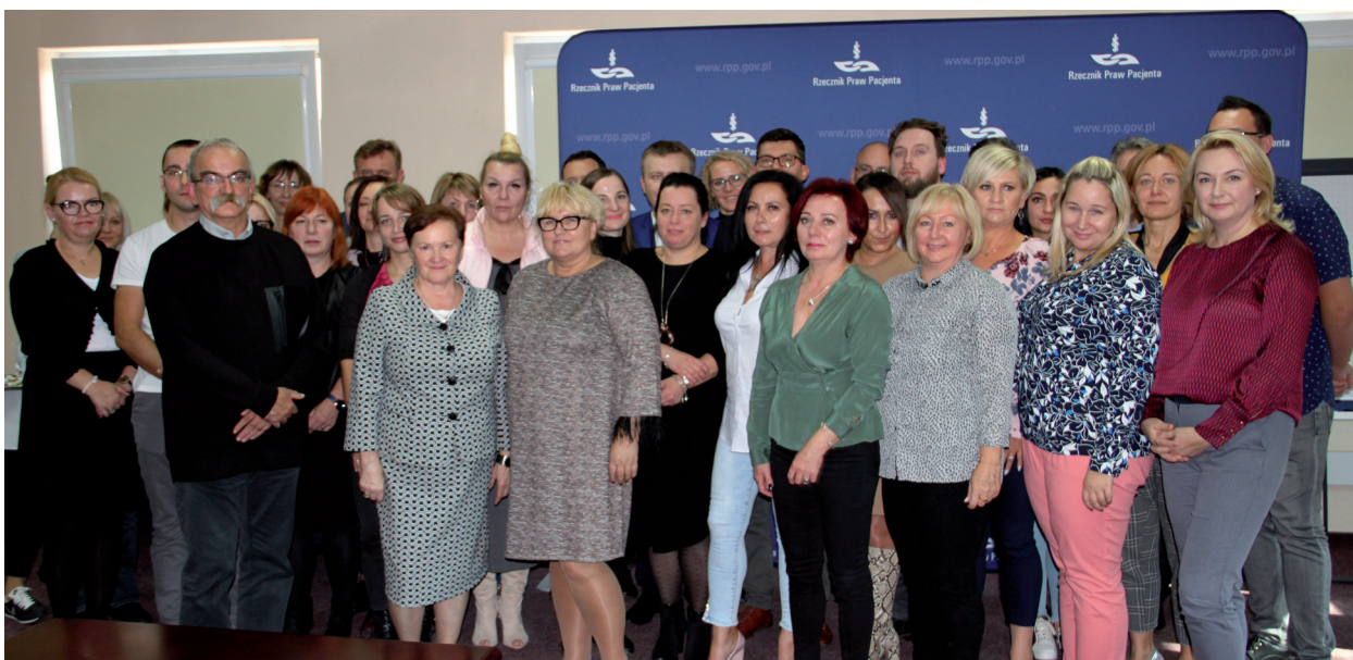
Zjazd Rzeczników Praw Pacjenta Szpitala Psychiatrycznego

Ochrona praw osób z zaburzeniami psychicznymi jest realizowana głównie przez Rzeczników Praw Pacjenta Szpitala Psychiatrycznego. W 2019 roku pracowali oni na terenie 216 szpitali psychiatrycznych i placówek leczenia uzależnień. W porównaniu z rokiem 2017 liczba podmiotów leczniczych objętych działalnością Rzeczników wzrosła o 107, w porównaniu z rokiem 2018 o 19 – bez wzrostu zatrudnienia wśród Rzeczników. Rzecznicy podjęli łącznie 11 888 spraw, co stanowi wzrost o 3309 w zestawieniu z 2017 rokiem i o 1573 w porównaniu z 2018 rokiem.