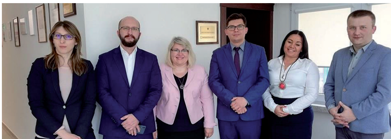
Przedstawiciele Rzecznika Praw Pacjenta i Ogólnopolskiego Związku Zawodowego Psychologów

W 2019 roku podjęliśmy także współpracę ze Stowarzyszeniem MONAR. Podczas kilku spotkań roboczych analizowaliśmy poszczególne prawa pacjenta w placówkach prowadzonych przez Stowarzyszenie. Chcemy tę współpracę sfinalizować w 2020 roku, wydając zestaw dobrych praktyk i rekomendacji dotyczących przestrzegania praw pacjenta w czasie leczenia uzależnień.