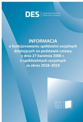
Informacja o funkcjonowaniu spółdzielni socjalnych za okres 2018-2019.

Istnieją również prowadzone przez MRiPS serwisy internetowe, tj. senior.gov.pl , niepełnosprawni.gov.pl , dedykowane różnym grupom społecznym: seniorom, osobom niepełnosprawnym, rodzinom, w których przyjdzie albo przyszło na świat ciężko chore dziecko, czy poświęcony funduszom europejskim portal efs.mrips.gov.pl .