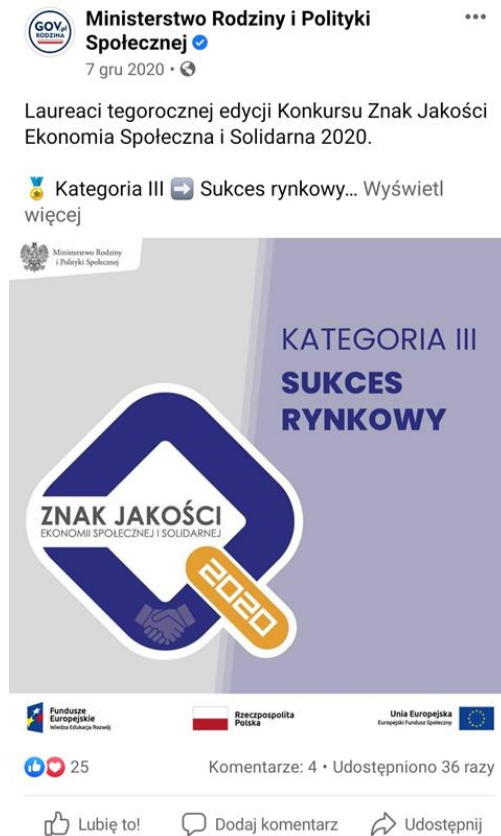
Przykładowa informacja z serwisu społecznościowego "Facebook"

Departament Ekonomii Społecznej i Solidarnej prowadzi stronę internetową ekonomiaspoleczna.gov.pl , która zawiera szczegółowe informacje dotyczące obszaru ekonomii społecznej i solidarnej. Na stronie znajduje się aktualizowana co miesiąc Baza Przedsiębiorstw Społecznych, czyli podmiotów, które nie dzielą zysku, ale przeznaczają go na cele społeczne (np. na rzecz społeczności lokalnej lub na rzecz osób zagrożonych wykluczeniem społecznym, które pracują w tym przedsiębiorstwie). Są to przede wszystkim spółdzielnie socjalne, ale także niektóre fundacje, stowarzyszenia i spółki non-profit. Baza przedsiębiorstw społecznych jest internetowym narzędziem, które umożliwia wyszukiwanie przedsiębiorstw społecznych z całego kraju przez potencjalnych zamawiających. Dzięki wyszukiwarce mogą oni łatwo znaleźć interesujące ich podmioty, filtrując je według elementów nazwy, branży, formy prawnej, numerów NIP lub REGON. Dodatkowo przedsiębiorstwa społeczne zostały uporządkowane według województw, powiatów i gmin. Baza umożliwia także pobranie listy przedsiębiorstw społecznych w kilku formatach, między innymi pdf i xls. Baza służy promowaniu przedsiębiorstw społecznych, zapewnia lepszą ich widoczność, możliwość uczestnictwa w wydarzeniach dla nich dedykowanych.