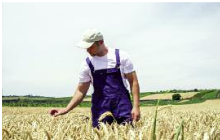
Nabywcami nieruchomości rolnych będą mogli być co do zasady tylko rolnicy indywidualni

Wszystkie nieruchomości rolne w pierwszej kolejności zbywane będą w drodze przetargów ograniczonych. Zasadnym jest także umożliwie-