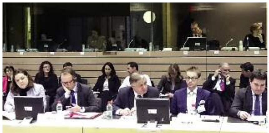
Minister Krzysztof Jurgiel podczas posiedzenia unijnej Rady Ministrów ds. Rolnictwa i Rybołówstwa

Podczas posiedzenia omówiono również kwestie dotyczące międzynarodowego handlu produktami rolnymi. Komisarz Hogan zaprezentował aktualną sytuację w tym zakre-