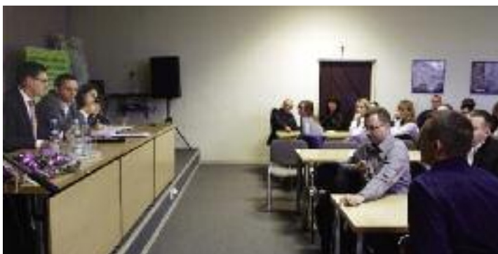
Płońsk: na spotkaniu z pracownikami biur powiatowych prezes Daniel Obajtek podkreślił, że doloży starań, aby zapewnić pracownikom wynagrodzenie adekwatne do wykonywanej pracy