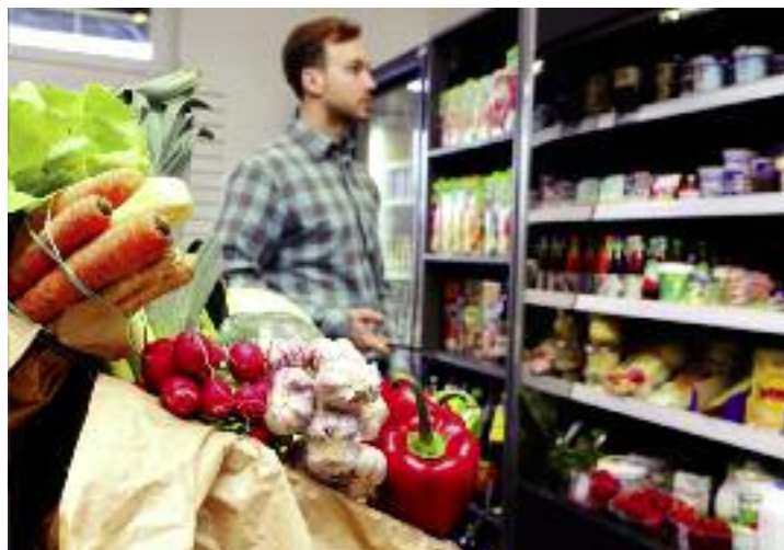
Dzięki powołaniu nowej Państwowej Inspekcji Bezpieczeństwa Żywności zapewniona zostanie pełniejsza ochrona zdrowia konsumentów

Bardzo ważne jest ustanowienie organów Państwowej Inspekcji Bezpieczeństwa Żywności na poziomie centralnym, wojewódzkim i powiatowym jako organów administracji niezespólonej. Za przyjęciem takiego zhierarchizowanego modelu organizacyjnego nowej inspekcji