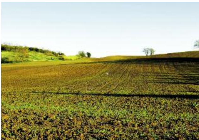
Podstawową formą zagospodarowania państwowych gruntów rolnych jest dzierżawa

Ewentualne zmiany kryteriów oceny ofert i ich wag dla danego województwa uzgadniane są z ww. radą społeczną działającą przy dy-