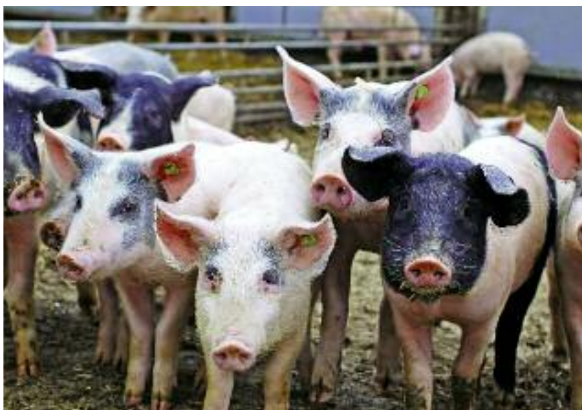
Kwota wsparcia dla producentów wieprzowiny wynosi łącznie prawie 123 mln zł

Wsparcie dla producentów mleka będzie przysługiwało tym, którzy w roku kwotowym 2014/2015 sprzedali nie mniej niż 15 tys. kg i w momencie składania wniosku posiadają co najmniej 3 krowy typu użytkowego (mleczny lub kombino-