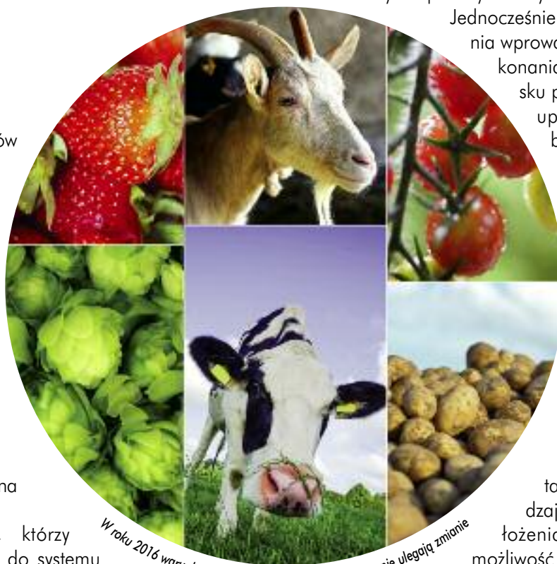
W roku 2016 warunki przyznawania płatności zasadniczo nie ulegają zmianie