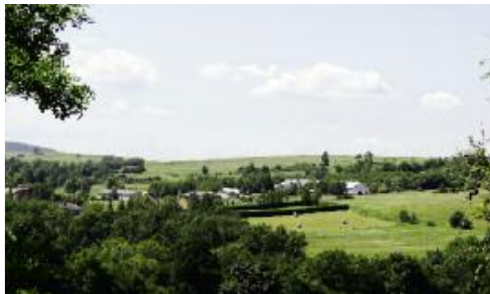
Nieruchomości rolne Zasobu Własności Rolnej Skarbu Państwa w pierwszej kolejności będą wydzierżawiane albo sprzedawane na powiększenie lub utworzenie gospodarstw rodzinnych

go współnika do handlowej spółki osobowej, która jest właścicielem nieruchomości rolnej, Agencja działająca na rzecz Skarbu Państwa, będzie mogła złożyć oświadczenie o nabyciu tej nieruchomości za zapłatą równowartości pieniężnej. Proponowane przepisy mają na celu zapobieżenie faktycznemu przejmowaniu nieruchomości rolnych przez osoby, które nie są rolnikami a stały się współnikami w spółkach osobowych, bądź stały się akcjonariuszami lub udziałowcami w spółkach prawa handlowego będących właścicielami nieruchomości rolnych i faktycznie władają tymi nieruchomościami poprzez „kontrolowanie” tych spółek.