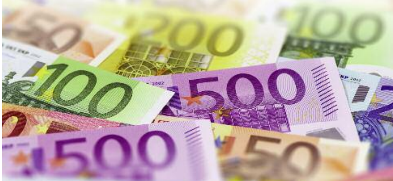
Całkowita kwota wsparcia dla producentów świń i mleka w państwach członkowskich wynosi 420 mln euro