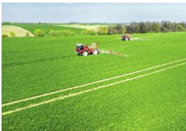
Nowa ustawa o wstrzymaniu sprzedaży nieruchomości Zasobu Własności Rolnej Skarbu państwa ma zapobiec spekulacyjnemu nabywaniu nieruchomości

Przeciwdziałaniu spekulacyjnemu nabywaniu nieruchomości rolnych i zagwarantowaniu ich wykorzystania na cele rolnicze służyć mają zawarte w projekcie ustawy propozycje zmian w ustawie z dnia 11 kwietnia 2003 r. o kształtowaniu ustroju rolnego (Dz.U. z 2012 r. poz. 803) oraz ustawie z dnia 19 października 1991 r. o gospodarowaniu nieruchomościami rolnymi Skarbu Państwa (Dz.U. z 2015 r. poz. 1014).