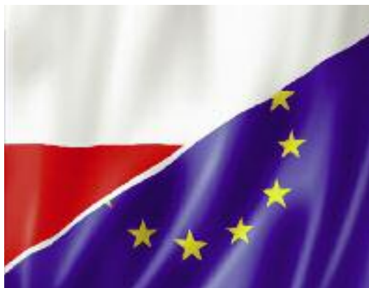
W skład Grupy Wyszehradzkiej od 1991 r. wchodzi: Polska...

Polska prezydencja w Grupie Wyszehradzkiej zamierza również zacieśnić współpracę w obszarze jakości i bezpieczeństwa żywności. Mając na uwadze rozwój krótkich łańcuchów dostaw, który jest jednym z priorytetów rozwoju obszarów wiejskich, zamierzamy inicjować dyskusję na temat zmian obecnie obowiązujących przepisów tzw. pakietu higienicznego, w zakresie możliwości przeprowadzenia uboju zwierząt w gospodarstwie w celu pozyskania mięsa, które mo-