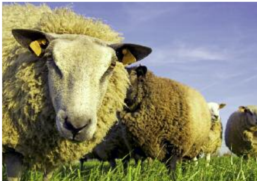
W 2015 roku ubezpieczonych było ponad 13 milionów sztuk zwierząt gospodarskich

Projekt ustawy został zamieszczony na stronie internetowej Biuletynu Informacji Publicznej Rządowego Centrum Legislacji w zakładce Rządowy proces legislacyjny. Projekt ustawy został umieszczony w Wykazie Prac Legislacyjnych Rady Ministrów pod numerem UA2.