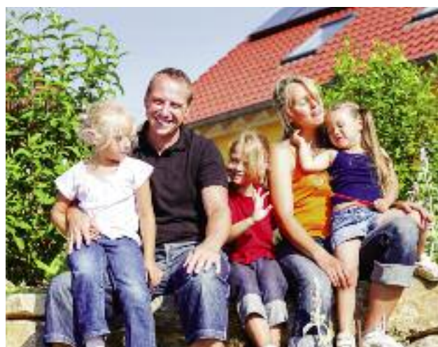
11 mld zł w ramach z Programu „Rodzina 500 plus” trafi do rodzin z obszarów wiejskich

Program „Rodzina 500 plus” ruszy w całej Polsce 1 kwietnia tego roku, a od przyszłego roku ogólna kwota wsparcia z tego programu wyniesie 23 mld zł, z czego 11 mld zł jest adresowane do rodzin zamieszkujących obszary wiejskie.