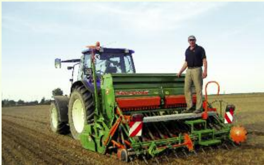
W przypadku operacji realizowanych przez osoby wspólnie wnioskujące możliwe jest uzyskanie wsparcia do wysokości określonych limitów przez każdą z osób wspólnie wnioskujących

wała mu pomoc w wysokości maksymalnie 500 tys. zł, z czego na maszyny będzie przypadała kwota 200 tys., a na inwestycję dotyczącą budowy budynku inwentarskiego kwota 300 tys. zł.