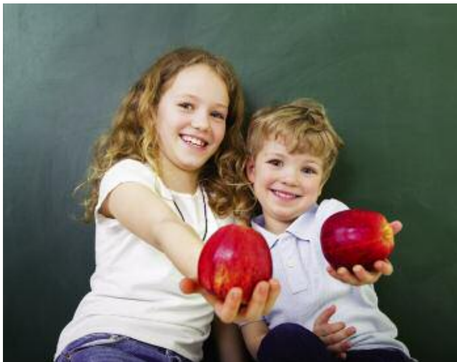
Wyrobienie u dzieci dobrych nawyków żywieniowych to sprawdzona inwestycja w zdrowie

W efekcie uzyskanego porozumienia uzyskana zostanie większa zbieżność dwóch dotychczasowych programów szkolnych. Tym samym usunięte zostaną wątpliwości wyrażane przez Europejski Trybunał Obrachunkowy, a programy szkolne uzyskają niezbędną legitymizację dla ich dalszego rozwoju. Planuje się, że znowelizowane przepisy po zamknięciu procedury legislacyjnej i ich opublikowaniu w Dzienniku Urzędowym UE weśląby w życie od 1 sierpnia 2017 r., tj. od roku szkolnego 2017/2018.