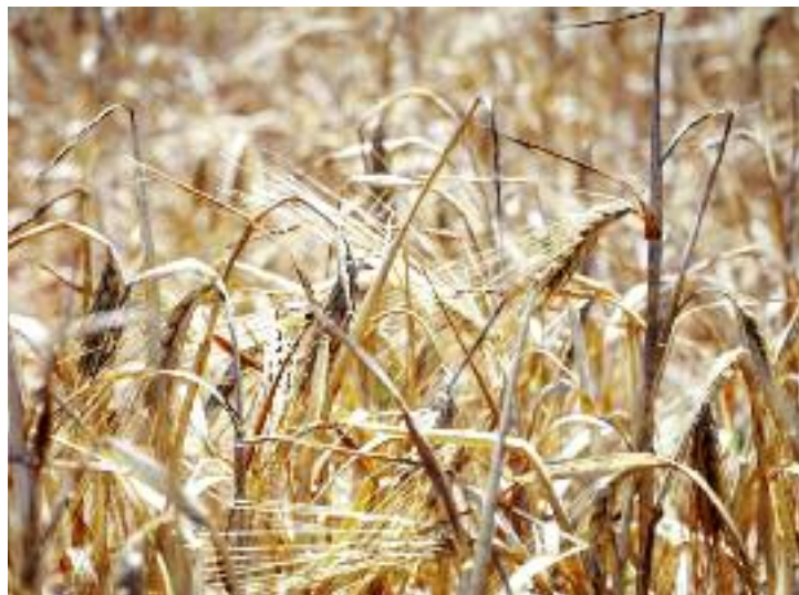
W projekcie ustawy o ubezpieczeniach upraw rolnych i zwierząt gospodarskich zachowana została możliwość wyboru przez producenta rolnego wybranych ryzyk do ubezpieczenia

Zespół zobowiązany jest do przygotowania założeń systemu ubezpieczeń gospodarczych w rolnictwie z uwzględnieniem obecnych rozwiązań obowiązujących w Polsce i Unii Europejskiej wraz z koncepcją ich wdrożenia i funkcjonowania. Zakłada się, że wprowadzone w Polsce nowe rozwiązania uzupełnią dotychczasowy system o następujące elementy: możliwość tworzenia branżowych, samorządowych bądź terytorialnych funduszy wsparcia wzajemnego, w których rolnicy są udziałowcami i współdecydują o prowadzonej polityce ubezpieczeniowej przez te podmioty. Ma to na celu maksymalne zabezpieczenie gospodarstw rolnych przed ryzykami wynikającymi z klęsk i zdarzeń losowych oraz ochronę budżetu przed wydatkami odszkodowań. W dalszej kolejności