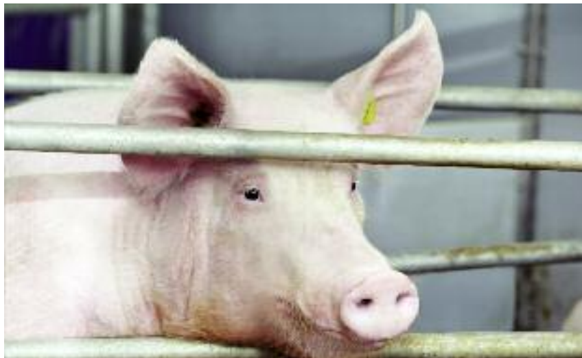
Nawet 900 tys. zł będzie można otrzymać na inwestycje związane z rozwojem produkcji prosiąt

kość ekonomiczną przynajmniej 10 tys. euro.