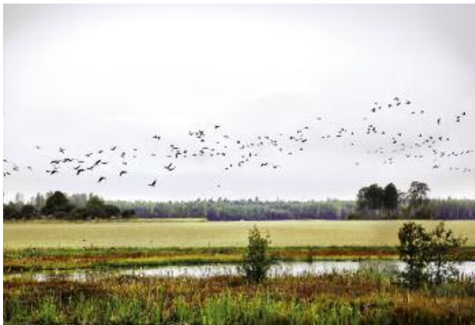
Od 15 marca br. można składać w biurach powiatowych ARiMR wnioski o przyznanie płatności rolno-środowiskowo-klimatycznej i ekologicznej

Zmiany w ramach Programu rolnośrodowiskowego PROW 2007-2013 dotyczą m. in.: