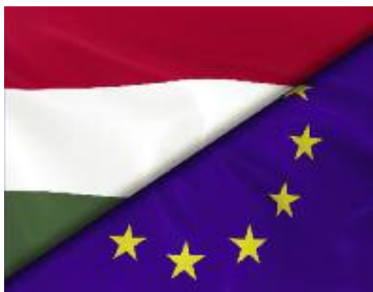
i Węgry. Od 2004 r. wszystkie cztery kraje Grupy są członkami UE

głoby być następnie oferowane do sprzedaży na rynku lokalnym.