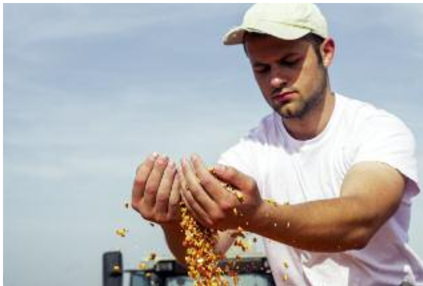
Zmiany w dopłatach do ubezpieczeń upraw rolnych mają zapewnić upowszechnienie sprzedaży pakietowych umów ubezpieczenia

W związku ze zmianą poziomu wydatków w stosunku do wielkości wynikających z obowiązujących przepisów ustawy o ubezpieczeniach upraw rolnych i zwierząt gospodarskich, zgodnie z art. 50 ust. 1a, 4 i 5 ustawy z dnia 27 sierpnia 2009 r. o finansach publicznych (Dz.U. z 2013 r. poz. 885, z późn. zm.), określono w art. 4 projektu ustawy maksymalny limit tych wydatków wyrażony