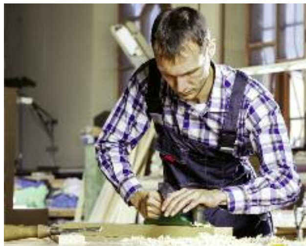
Niezwykle ważną kwestią, poruszaną w ramach szerokich konsultacji „Paktu...” jest rozwój przedsiębiorczości i tworzenie nowych miejsc pracy na obszarach wiejskich

Plan na rzecz odpowiedzialnego rozwoju zakłada model gospodarczy oparty na 5 filarach, określonych jako: reindustrializacja, rozwój innowacyjnych firm, kapitał dla rozwoju, ekspansja zagraniczna, rozwój społeczny i terytorialny. Szczególne znaczenie dla szerokokorozumianego rozwoju obszarów wiejskich ma