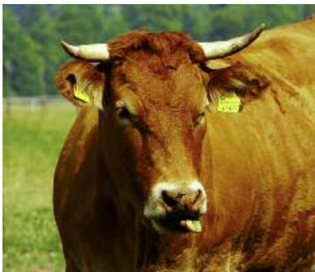
Maksymalne dofinansowanie inwestycji związanych z rozwojem produkcji bydła mięsnego wynosi 500 tys. zł

O pomoc mogą ubiegać się rolnicy posiadający gospodarstwa, których wielkość ekonomiczna mieści się w przedziale od 10 tys. euro do 200 tys. euro. Wyjątek od tej reguły stanowią rolnicy, którzy będą wspólnie składać wniosek o przyznanie dofinansowania na inwestycje w Modernizację gospodarstw rolnych . Wówczas łączna wielkość ekonomiczna należących do nich gospodarstw musi wynieść co najmniej 15 tys. euro, a w roku w którym zostanie złożony przez nich wniosek o wypłatę ostatecznej płatności, gospodarstwo każdego z nich osiągnie wiel-