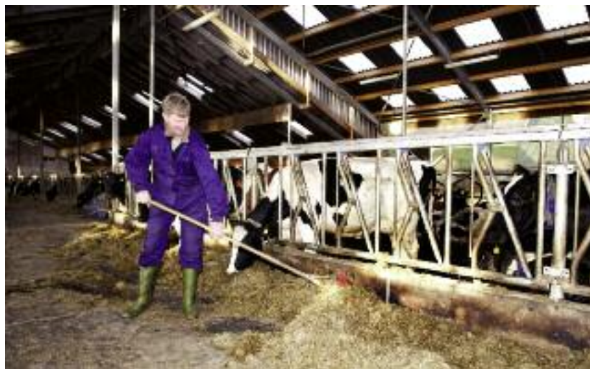
Na pomoc producentom mleka przeznaczono również blisko 123 ml zł. Środki te w równych częściach pochodzą z budżetu unijnego i krajowego

wany) w wieku przekraczającym 24 miesiące. Zwierzęta muszą być zarejestrowane w IRZ ARiMR.