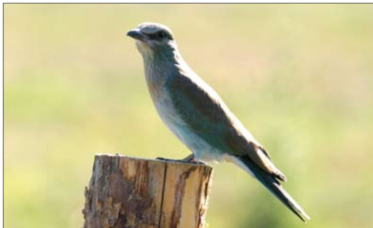
Kraszka – ginący gatunek krajobrazu rolniczego Polski