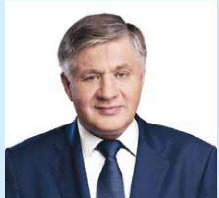
KRZYSZTOF JURGIEL MINISTER FÜR LANDWIRTSCHAFT UND LÄNDLICHE ENTWICKLUNG