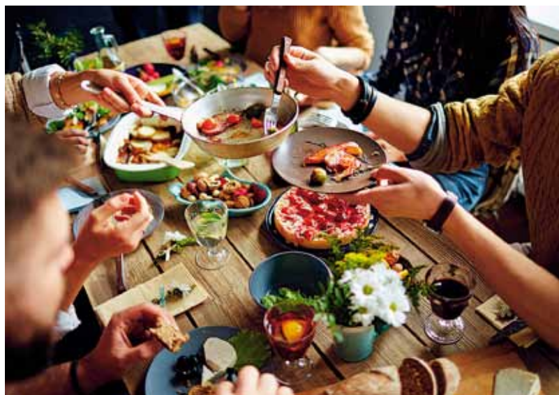
JEDZENIE DAJE OKAZJĘ DO DZIELENIA SIĘ RADOŚCIĄ POSIŁKU Z BLISKIMI ■ FOOD MAKES A PERFECT OPPORTUNITY TO SHARE THE JOY OF MEAL WITH YOUR FAMILY AND FRIENDS ■ DAS ESSEN LÄSST EINE GELEGENHEIT BENUTZEN, UM DIE MAHLZEITFREUDE MIT DEN NÄCHSTEN ZU TEILEN

Among many fair products, the Poland Chamber of Regional and Local Products in cooperation with self-governments, selected the winners of the „Our Culinary Heritage – Tastes of the Regions” competition. As the representatives of the Chamber think, this competition, organised since 2000, proved how wonderful and original food may be offered by the Polish producers to consumers, not only in our country but also in and beyond the European Union.