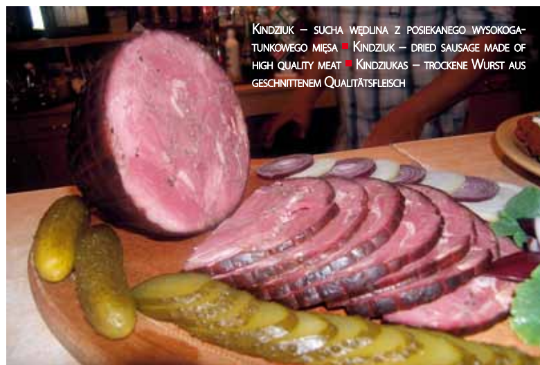
KINDZIUK – SUCHA WĘDLINA Z POSEKANEJ WYSOKOGA-TUNKOWEGO MIĘSA ■ KINDZIUK – DRIED SAUSAGE MADE OF HIGH QUALITY MEAT ■ KINDZIUKAS – TROCKENE WURST AUS GESCHNITTENEM QUALITÄTSFLEISCH

The region is a treasury of unique, often forgotten, technologies and recipes. Still, in the vicinity of Narewka and Gródek, people prepare sausage immersed in lard – a practical recipe from the times when there were no refrigerators; pork fat, salted and marinated for a couple of weeks in spices, as well as ham “from the chimney”. In Kruszewo, even today, barrels with pickled cucumbers, just like many years ago, are immersed into the Narew