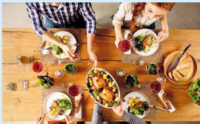
JEDZENIE JEST KLUCZEM DO TEGO, BY CIESZYĆ SIĘ TYM, CO MASZ NA TALERZU ■ FOOD IS THE KEY TO ENJOY WHAT YOU HAVE ON YOUR PLATE ■ DAS ESSEN IST DER SCHLÜSSEL DAZU, UM SICH DARÜBER ZU FREUEN, WAS DU AUF DEM TELLER HAST

te für andere regionale Produkte unterbreiteten. Der zusätzliche Vorzug dieser Produkte besteht darin, dass sie keine Massenwaren sind. Ihre Hersteller sind kleine Familienfirmen, die ihre Produkte oft nach den von Generation zu Generation weitergegebenen Rezepturen herstellen und dabei Komponente der höchsten Qualität, die häufig aus eigenem Bauernhof kommen, verwenden.