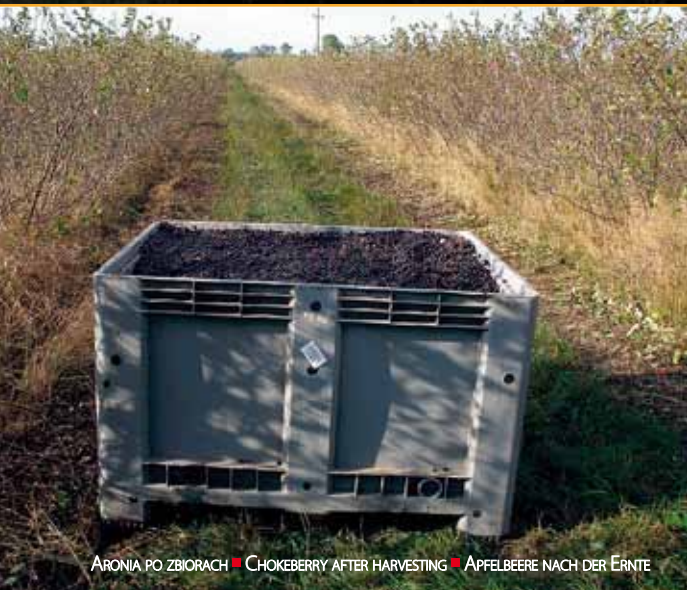
ARONIA PO ZBIORACH ■ CHOKEBERRY AFTER HARVESTING ■ APFELBEERE NACH DER ERNTE

czalnych, jak i na zdrowych ochotnikach. Preparaty aroniowe i przetwory z aronii warto polecić: