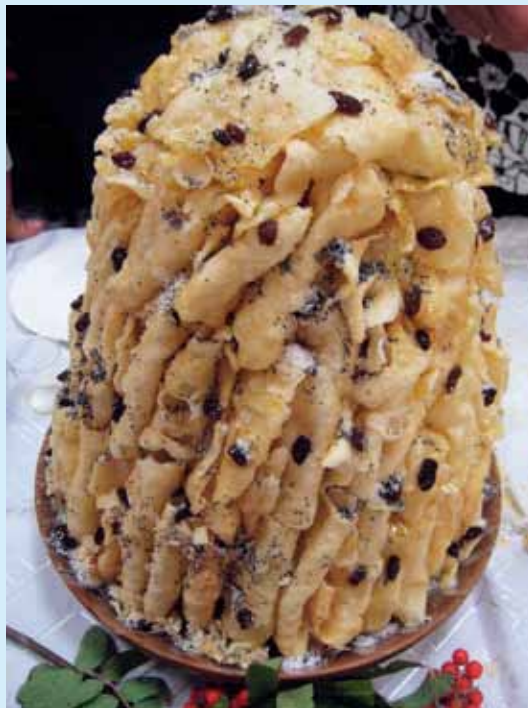
MROWISKO – W KSZTAŁCIE PIRAMIDY, SKŁADAJĄCEJ SIĘ Z CIENIUTKICH LISTKÓW KRUCHEGO, FAWORKOWEGO CIASTA, ZALANYCH MIODEM I POSYPANYCH RODZYNKAMI I MAKIEM ■ ANTHILL – PYRAMID-SHAPED CAKE MADE OF THIN LAYERS OF CRISPY PASTRY COVERED WITH HONEY, RAISINS AND POPPY-SEED ■ AMEISENHAUFEN – KUCHEN IN FORM VON EINER PYRAMIDE, DIE AUS HAUCHDÜNNEM BLÄTTERTEIG BESTEHT, DER TEIG IST MIT HONIG BEGOSSEN UND MIT ROSINEN SOWIE MOHN GESTREUT

Es gibt ein althergebrachtes Gebäck: dunkle Brote aus Puńsk, z. B. ein vollkommenes Schrotbrot motules mit Honig, das unter Anwendung vom Kalmus gebackene althergebrachte Brot aus Augustów. Es gibt die Leckereien litauischer Herkunft, wie obalio suris – „der Apfelkäse“ und weißrussische gryczaniki – Piroggen