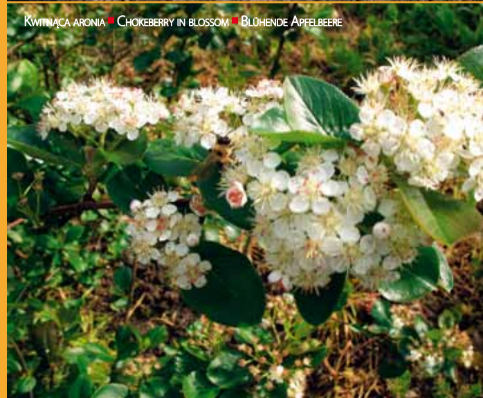
KWITNĄCA ARONIA ■ CHOKEBERRY IN BLOSSOM ■ BLÜHENDE APFELBEERE