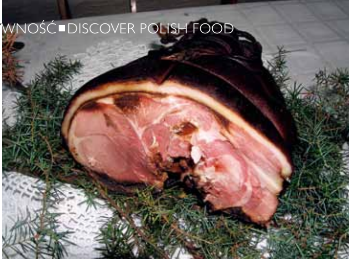
POLSKA KUMPIA, CZYLI WIEPRZOWA SZYNKA Z KOŚCIĄ ■ POLISH KUMPIA – PORK HAM ON THE BONE ■ POLNISCHE „KUMPIA”, ALSO SCHWEINESCHINKEN OHNE KNOCHEN

(na tataraku) tradycyjny chleb z Augustowa. Są przysmaki o rodowdziej litewskim, jak obalium suris – „ser” jableczny i białoruskie gryczaniki – pierogi z kaszą gryczaną i białym serem, pampuszki i oładzie (racuchy). Są specyficzne wędliny: litewski kindziuk i polska kumpia, czyli wieprzowa szynka z kości, pasztety z ryb i dziczyzny.