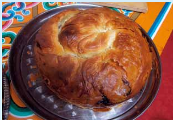
PIEREKACZEWNIK – ŚLIMAKOWATE, WIELOWARSTWOWE CIASTO, FASZEROWANE MIĘSEM (BARANINA, GĘSINA LUB WOŁOWINA) ALBO BIAŁYM SEREM CZY JABŁKAMI ■ PIEREKACZEWNIK – SNAIL-SHAPED, MULTILAYERED CAKE STUFFED WITH MEAT (LAMB, GOOSE OR BEEF), COTTAGE CHEESE OR APPLES ■ PIEREKACZEWNIK – EIN SCHNECKENFÖRMIGER VIELSCHICHTIGER KUCHEN, GEFÜLLT MIT FLEISCH (SCHAFS-, GÄNSE- ODER RINDFLEISCH), QUARK ODER ÄPFELN

im Land der Wälder, Seen und an Fischen reichen Flüsse nicht wundert. In den Wäldern und auf den Sumpfbereichen von Podlachien, insbesondere in der Gegend von Lipsk nad Biebrzą , wachsen prächtige Moosbeeren, aus denen verschiedene Produkte hergestellt werden: ein rohes Mus mit Zucker, Konfitüre für Fleisch, Liköre. Die Gebiete am Fluss Bug sind ein echter Schatz von Kräutern, aus dem lokale Einwohner immer in reichem Maße schöpfen. Wegen Kräuterdelikatessen, darunter