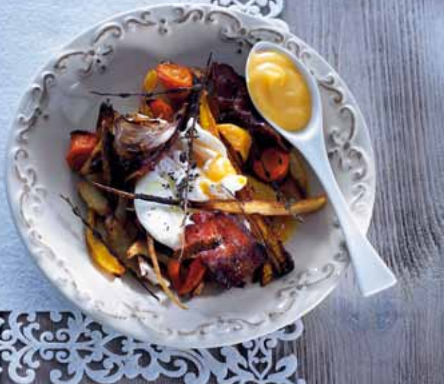
PIECZONE WARZYWA: KOLOROWE MARCHEWKI, PIETRUSZKA, PASTERNAK, SELER, SKORZONE- RA PIĘKNIE KOMPONUJĄ SIĘ NA TALERZU I MOGĄ BYĆ PODSTAWĄ ZDROWEJ, ZIMOWEJ DIETY ■ BAKED VEGETABLES: COLOURFUL CARROTS, PARSLEY, PARSNIP, CELERIAC, BLACK SALSIFY BEAUTI- FULLY MATCH EACH OTHER ON THE PLATE AND MAY BE A BASIS OF THE HEALTHY WINTER DIET ■ GEBACKENES GEMÜSE: BUNTE KAROTTEN, PETERSILIE, PASTINAKE, SELLERIE, SCHWARZWURZEL PASSEN SEHR GUT ANEINANDER AUF DEM TELLER AN UND KÖNNEN AUCH ALS GRUNDLAGE EINER GESUNDEN WINTERLICHEN DIÄT GELTEN

tradycyjne lubimy najbardziej i jadamy najczęściej, bo one są po prostu najsmaczniejsze. To co jest ważne obok smaku i tego, że są bogatym źródłem witamin, to też to, że kwaśny sok i chrupkość dają nam uczucie świeżości. A ta świeżość zimą, w zestawieniu z potrawami mięsnymi, jest bardzo ważna. Jest kontrpunktem dla ciężkich dań. Kwaśna, kiszona kapusta z odrobiną cukru dla przełamania tej kwasowości, może z posiekaną drobno cebulką dla dodania jeszcze większej chrupkości i ostrości oraz odrobina świeżo tłoczonego oleju rzepakowego, który doda trochę połyku – to kombinacja, którą bardzo lubię jako dodatek do różnego rodzaju mięs, na dziesiątki sposobów. Świetnym pomysłem na wykorzystanie kapusty kiszonej jest kapuśniak. No i w końcu zakwas na barszcz, który jest składnikiem jednej ze sztandarowych polskich zup. Ja cały rok za tym tęsknię i czekam na świąteczny stół, żeby spróbować najlepszego barszczu na zakwasie, czyli tego w wykonaniu mojej mamy.