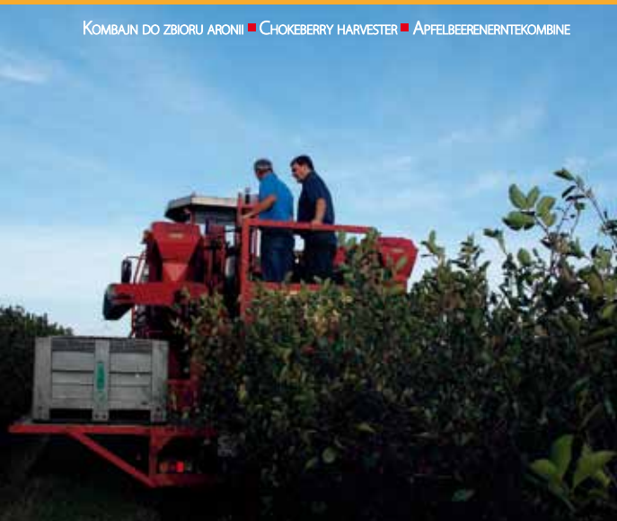
KOMBajn DO ZBIORU ARONII ■ CHOKEBERRY HARVESTER ■ APFELBEERENERNTEKOMBINE