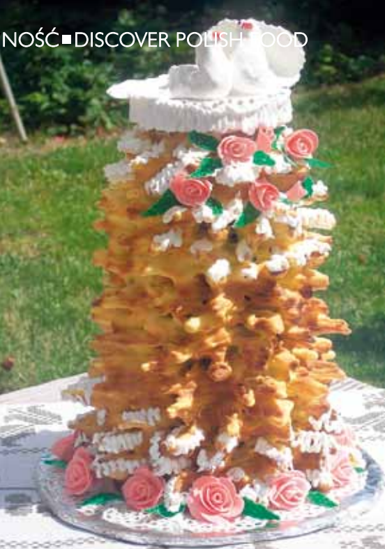
SEKACZ WESELNY – CIASTO-DRZEWO Z CHARAKTERYSTYCZNYMI SEKAMI ■ WEDDING BAUMKUCHEN – TREE-CAKE WITH CHARACTERISTIC KNOTS ■ HOCHZEIT-BAUMKUCHEN – EIN BAUMKUCHEN MIT CHARAKTERISTISCHEN KNASTEN

tem kulinarnego dziedzictwa pogranicza polsko-litewskiego. Nie mniej ciekawym wypiekiem jest mrowisko-kopiec. Zachwyca swoim wyglądem – ma kształt piramidy, składającej się z cieniutkich listków kruchego, faworkowego ciasta, zalanych miodem i posypanych rodzynkami i makiem (stąd nazwa mrowisko). Obecnie, ze względu na swoją dekoracyjność, mrowisko jest – obok sękacza – najbardziej popularnym ciastem weselnym w północno-wschodniej Polsce. Na Sejneńszczyźnie metoda układania mrowiska jest przekazywana w litewskich rodzinach z matki na córkę. W północnej części Podlasia piecze się też wysoki na pół metra