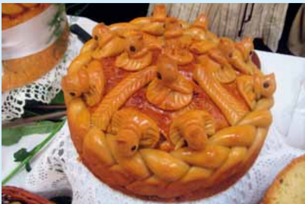
KOROWOJ – KOLACZ WESELY ■ KOROWOJ - WEDDING KOLACHE ■ KOROWOJ – EIN HOCHZEITS-FLADEN

Alte Architekturdenkmäler, kulinarische Rezepte und spezifische Namen haben sich erhalten. Es gibt thematische Touristenrouten: tatarische Touristenroute, Handwerk-Touristenroute, Storch-Touristenroute, Touristenroute von Offenen Fensterläden. Die letzte Initiative der Region ist Bildung der kulinarischen Touristenroute von Podlachien, auf der man künftig die besten hiesigen Delikatessen kosten kann.