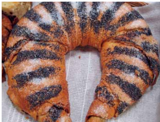
KARAIMSKI STULIŚCIEC, CZYLI WARSTWOWE CIASTO DROŻDŻOWE W KSZTAŁCIE PODKO-WY, Z MAKIEM I RODZYNKAMI ■ KARAIM STULIŚCIEC – HORSESHOE-SHAPED LAYERED YEAST CAKE WITH POPPY-SEED AND RAISINS ■ KARAIMISCHER KUCHEN STULIŚCIEC, ALSO SCHICHT-HEFEKUCHEN IN FORM VOM HUF-EISEN, MIT MOHN UND ROSINEN

wedding cake in north-eastern Poland. In the Sejny region, the method of preparing the anthill cake is passed down from mother to daughter in the Lithuanian families. In the northern part of Podlasie, people also bake the „chimney cake”, which is half a metre high and Karaitic stuliściec , popular from Trakai to Puńsk, i.e. layered horseshoe-shaped yeast cake, with poppy seeds and raisins. It is