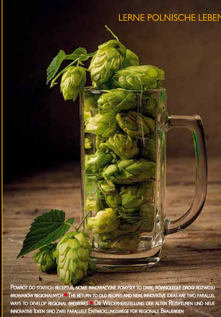
POWRÓT DO STARYCH RECEPTUR, NOWE INNOWACYJNE POMYSŁY TO DWIE, RÓWNOLEGŁE DROGI ROZWOJU BROWARÓW REGIONALNYCH ■ THE RETURN TO OLD RECIPES AND NEW, INNOVATIVE IDEAS ARE TWO PARALLEL WAYS TO DEVELOP REGIONAL BREWERIES ■ DIE WIEDERHERSTELLUNG DER ALTEN REZEPTUREN UND NEUE INNOVATIVE IDEEN SIND ZWEI PARALLELE ENTWICKLUNGSWEGE FÜR REGIONALE BRAUEREIEN

Moderne Trends, die mit einer dynamischen Entwicklung von kleinen lokalen Brauereien zu tun haben, sind uns nicht fremd. Dank den Liebhabern verfügen die Verbraucher über eine breite Palette von hellen, dunklen, pasteurisierten Bieren sowie von Bieren mit lebenden Bakterienkulturen. Die Wiederherstellung der alten Rezepturen und neue innovative Ideen sind zwei parallele Entwicklungswege für regionale Brauereien. Das Interesse der Verbraucher für lokale und verhältnismäßig seltene Biere hat zur Folge, dass alte Traditionen wiederhergestellt werden. Die Entwicklung wird auch von Anerkennung seitens der Spezialisten gefolgt. Erwähnenswert ist es, dass ein von polnischen Bieren die Bronzemedaille während eines von den weltgrößten Bierwettbewerben – World Beer Cup