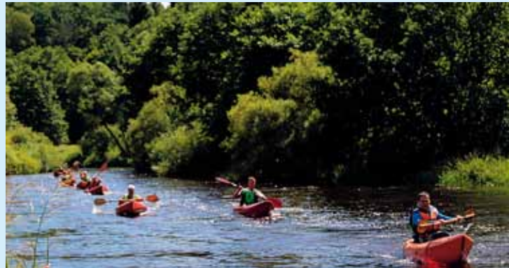
TYM RAZEM DO POKONANIA KAJAKOWY ETAP NA DYSTANSIE 4 KM ■ TIME FOR KAYAKING STAGE AT THE DISTANCE OF 4 KM AHEAD ■ DIESMAL MUSS EINE 4 KM LANGE PADDLBOOTSSTRECKE ZURÜCKGELEGT WERDEN

UCZESTNICY ROWEROWEGO ETAPU DYGOWSKIEGO TRIATHLONU NA DYSTANSIE 12 KM ■ PARTICIPANTS OF THE DYGOWO TRIATHLON CYCLING STAGE AT THE DISTANCE OF 12 KM ■ TEILNEHMER DER RAD-ETAPPE DES TRIATHLONS VON DYGÓW AUF ZWÖLFKILOMETERSTRECKE