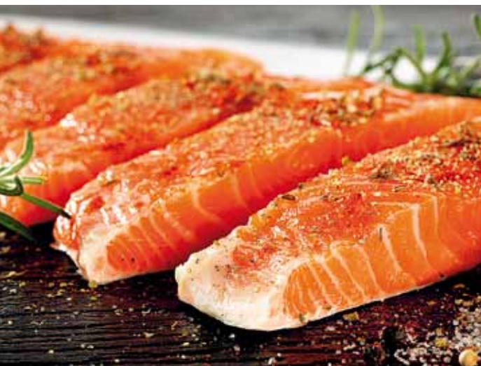
WĘDZONY ŁOSOŚ STANOWIŁ 60% OGÓLNEJ SPRZEDAŻY RYB I ICH PRZETWORÓW DO NIEMIEC ■ SMOKED SALMON REPRESENTED 60% OF TOTAL SALES OF FISH AND FISH PRESERVES TO GERMANY ■ DER GERÄUCHERTE LACHS BILDETE 60% DES ALLGEMEINEN VERKAUFS VON FISCHEN UND IHREN PRODUKTEN NACH DEUTSCHLAND

The second very important item was poultry meat, whose sales value amounted to EUR 394 million, which meant the share at the level of 7%. Half of this value was the sales of turkey meat, 30% – of chicken meat and 15% referred to goose meat.