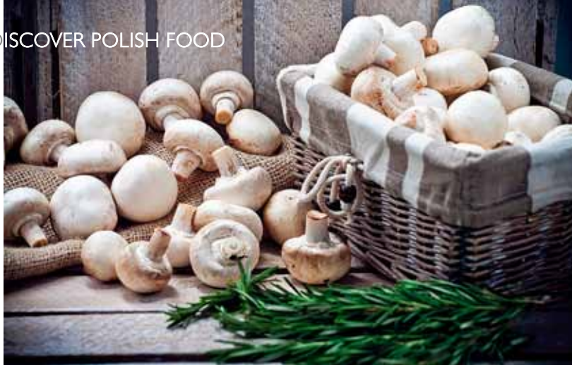
W OGÓLNYM WYWOZIE GRZYBÓW I WARZYW DO NIEMIEC, NA PIECZARKI PRZYPADŁO 38% ■ CHAMPIGNONS ACCOUNTED FOR 38% OF THE OVERALL EXPORT OF MUSHROOMS AND VEGETABLES ■ IN ALLGEMEINER PILZ- UND GEMÜSEAUSSFUHR NACH DEUTSCHLAND FIELEN 38% AUF CHAMPIGNONS

Drugą bardzo istotną pozycją było mięso drobiowe, którego wartość sprzedaży wyniosła 394 mln euro, co oznacza-