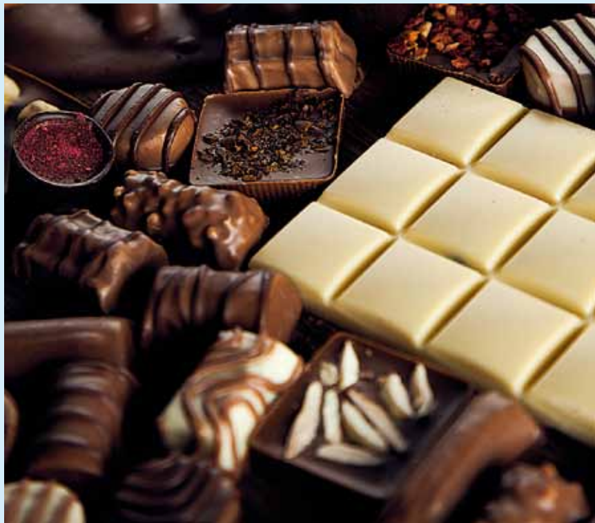
WSRÓD TOWARÓW CZEKOLADOWYCH AZ 70% SPRZEDAŻY STANOWIŁY NADZIEWANE WYROBY CZEKOLADOWE ORAZ RÓŻNEGO RODZAJU CZEKOLADY ■ STUFFED CHOCOLATE PRODUCTS AND CHOCOLATE OF VARIOUS KINDS REPRESENTED AS MUCH AS 70% OF THE SALES FROM AMONG CHOCOLATE PRODUCTS ■ UNTER SCHOKOLADENWAREN BILDETEN GEFÜLLTE SCHOKOLADENPRODUKTE UND VERSCHIEDENARTIGE SCHOKOLADEN NICHT WENIGER ALS 70% DES VERKAUFS

Die Ausfuhr der Pilze und der Gemüse nach Deutschland hat dagegen polnischen Exporteuren den Gewinn von etwa