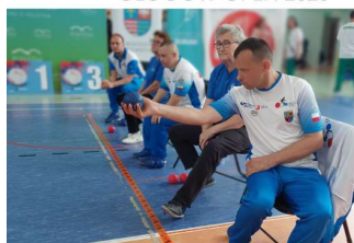
15. 09. 2023 r. (piątek) godz. 9.30 – 15.30 Hala Im. Ryszarda Matuzszaka