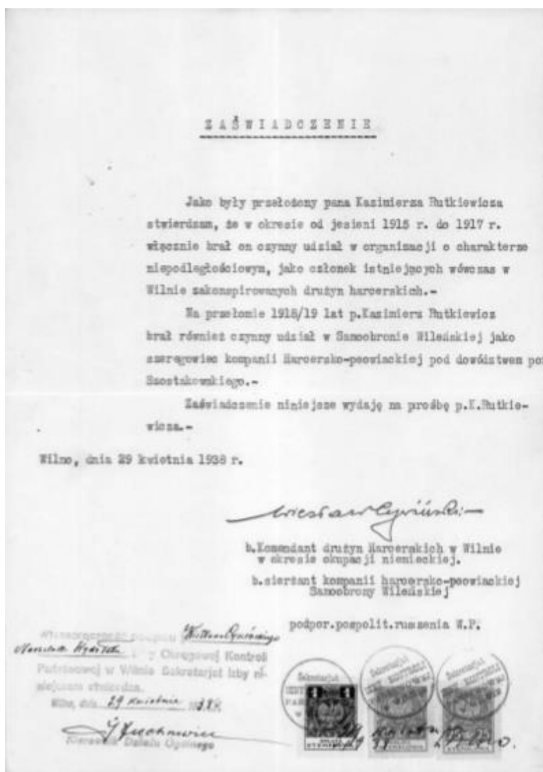
Zaświadczenie Izby Okręgowej Kontroli Państwowej w Wilnie z dnia 29 kwietnia 1938 r.