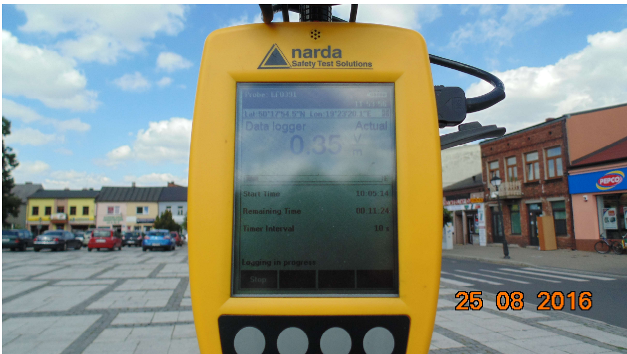
Fot. 4. Przyrząd pomiarowy w trakcie prowadzonego badania