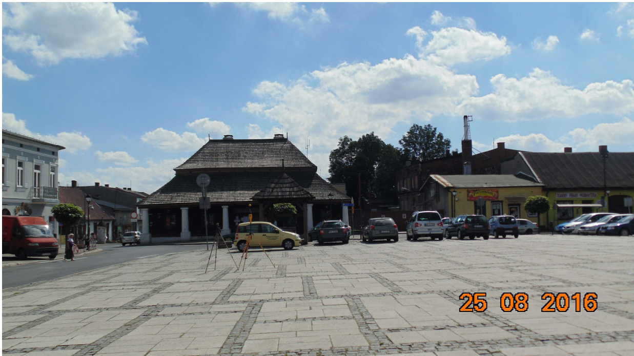
Fot. 3. Rejon badań, widok w kierunku wschodnim