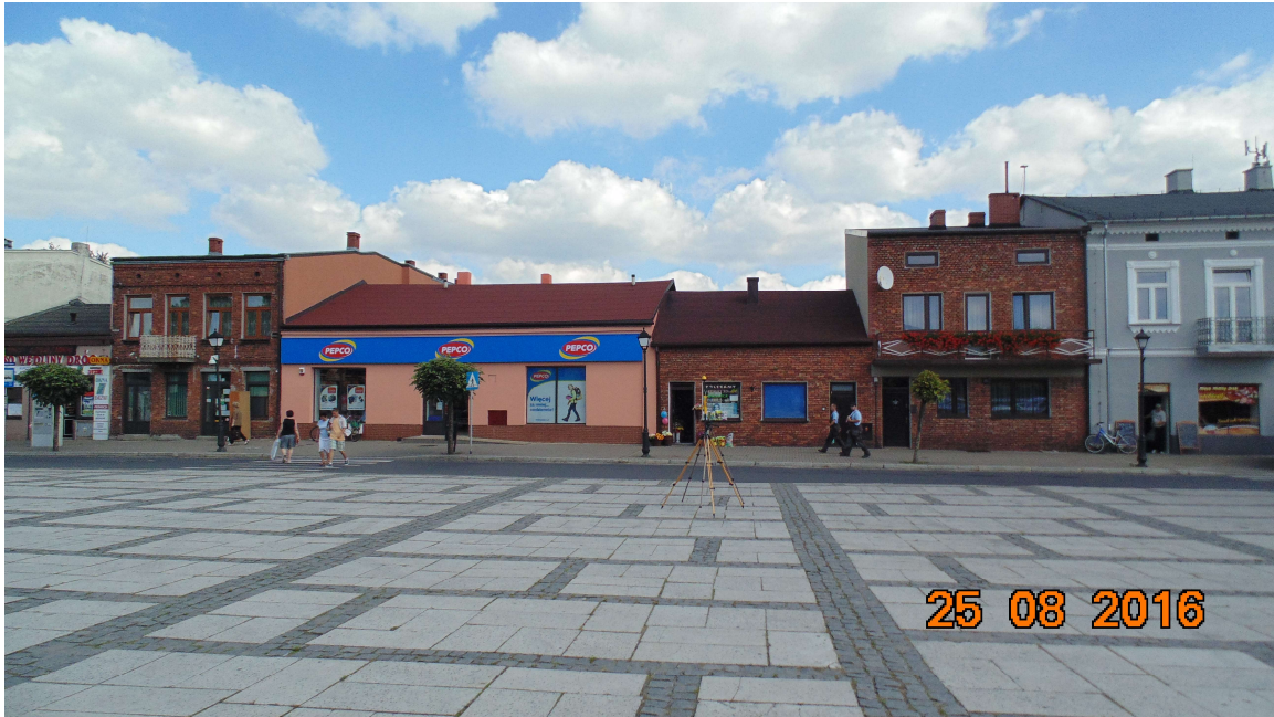
Fot. 1. Rejon badań, widok w kierunku północnym