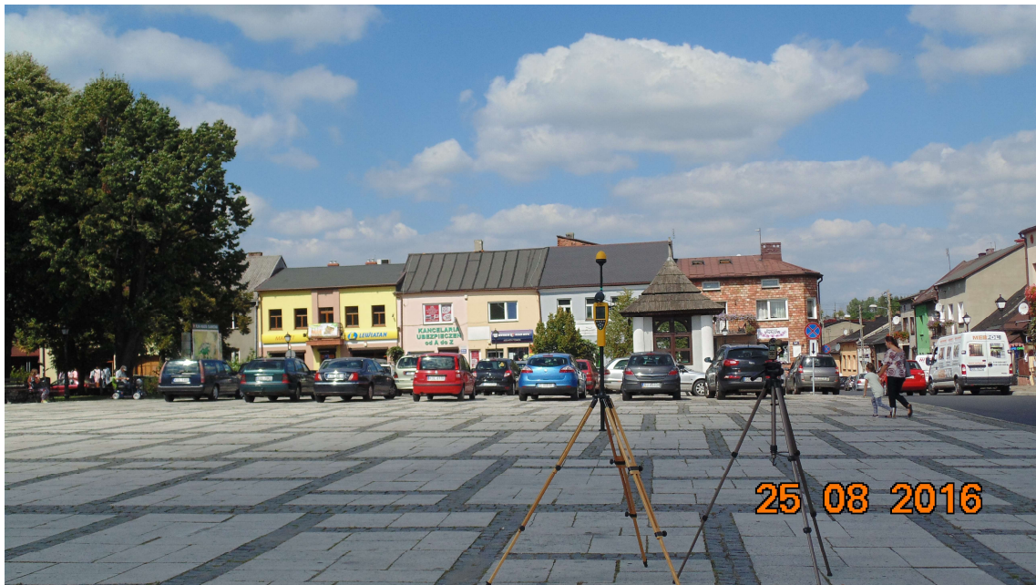
Fot. 2. Rejon badań, widok w kierunku zachodnim