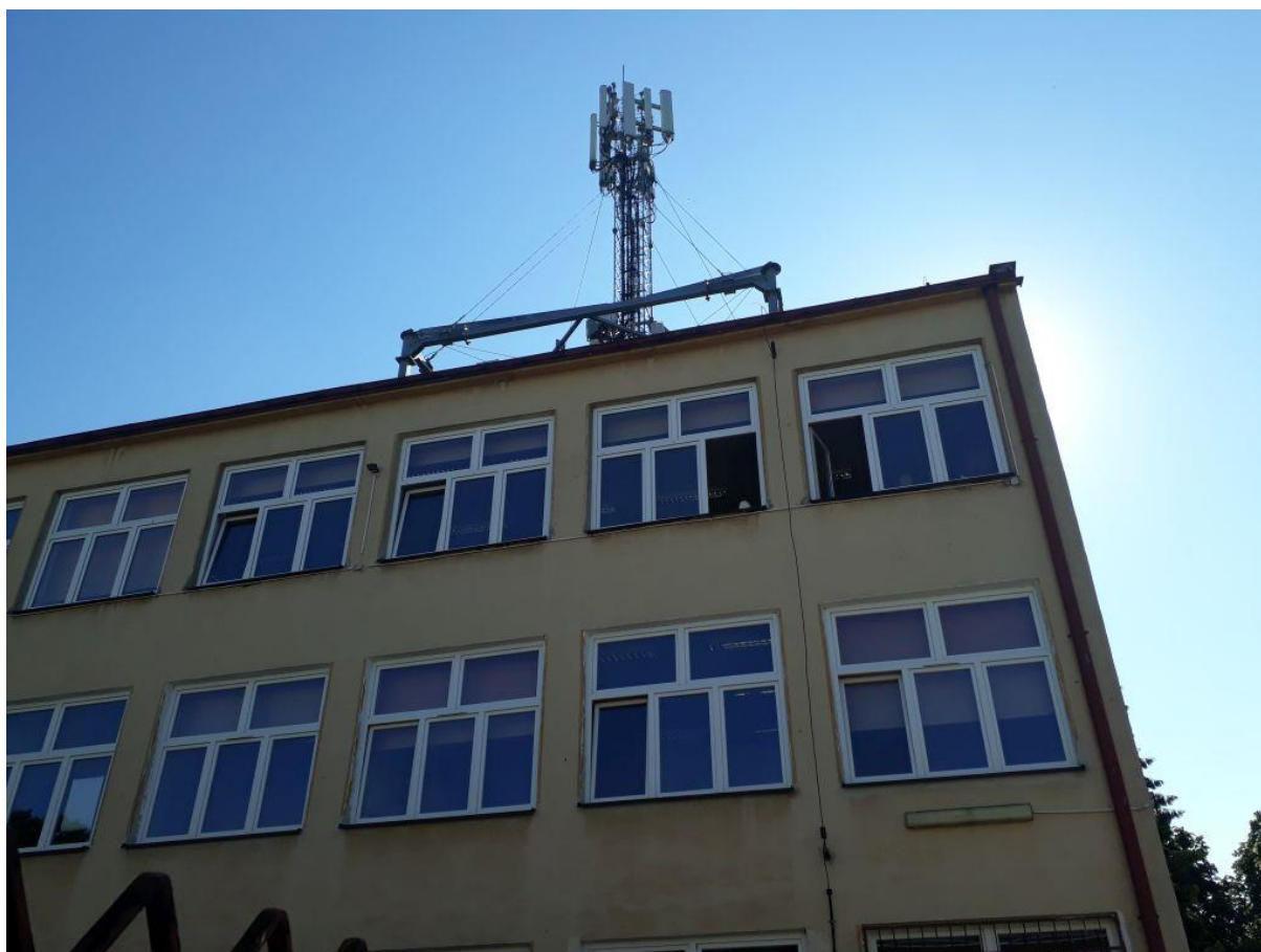
Fot. 1: Widok anten stacji bazowej ID: GDA0009E, zlokalizowanej pod adresem: ul. Prezydenta Lecha Kaczyńskiego 35, 80-364 Gdańsk