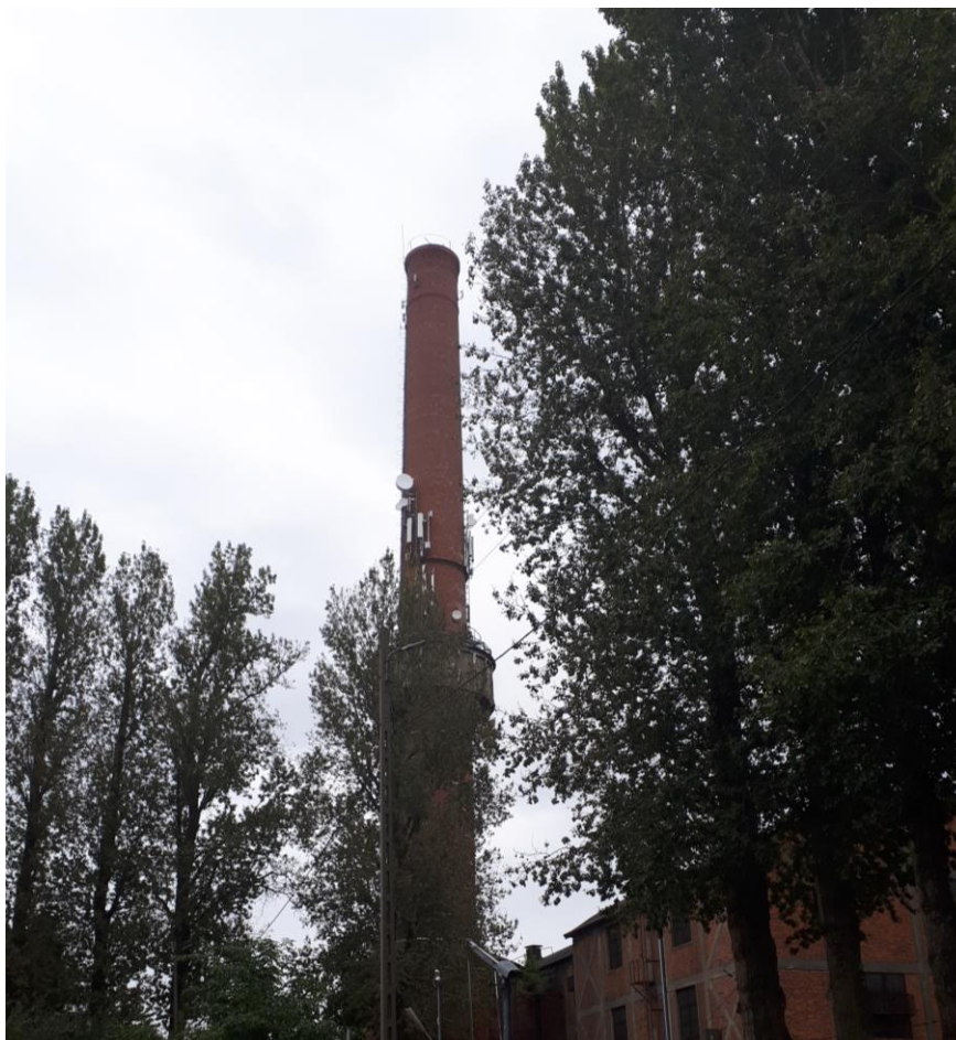
Fot. 1: Widok anten stacji bazowych: ID: BT_24269, ID: OPO2002_B, zlokalizowanych pod adresem: ul. Mikołaja 2, 45-127 Opole