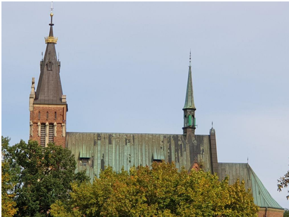
Fot. 1: Widok anten stacji bazowych: ID: RZE1015C, ID: 58174 (20174), ID: BT20666, zlokalizowanych pod adresem: ul. Partyzantów 30, 35-234 Rzeszów.