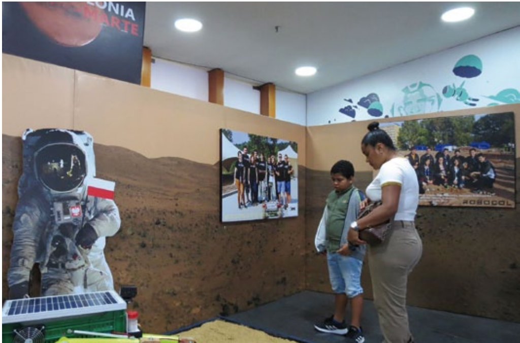
Sesión de divulgación científica «De Polonia a Marte», Planetario de Bogotá, noviembre de 2019.

desarrollo polaca, consiste en apoyar el desarrollo socioeconómico. Entre los países de América Latina y Caribe, se les ha dado la prioridad a Colombia, México y Perú.