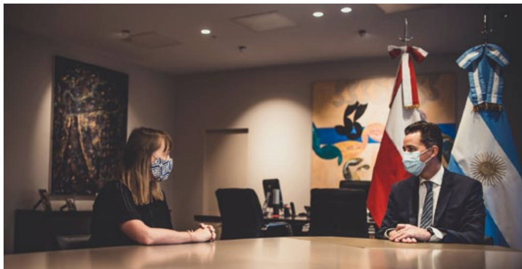
Reunión de la Embajadora de la República de Polonia A. Piątkowska con el Vicegobernador M. Calvo en la ciudad de Córdoba (Argentina), enero de 2021.

aumentó casi lo mismo que en los últimos cinco años. Al mismo tiempo se dispararon las desigualdades sociales. El proceso de la reducción de la pobreza y la eliminación de las desigualdades sociales en la región retrocedió años.