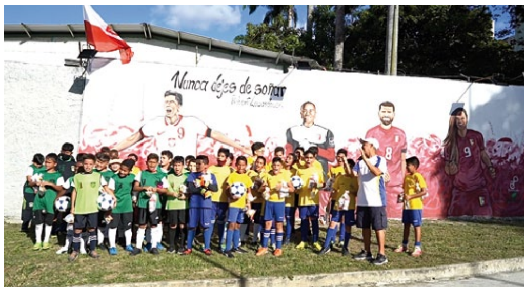
Mural dedicado a R. Lewandowski y a futbolistas venezolanos en el Polideportivo Rafael Vidal en Caracas, noviembre de 2021.