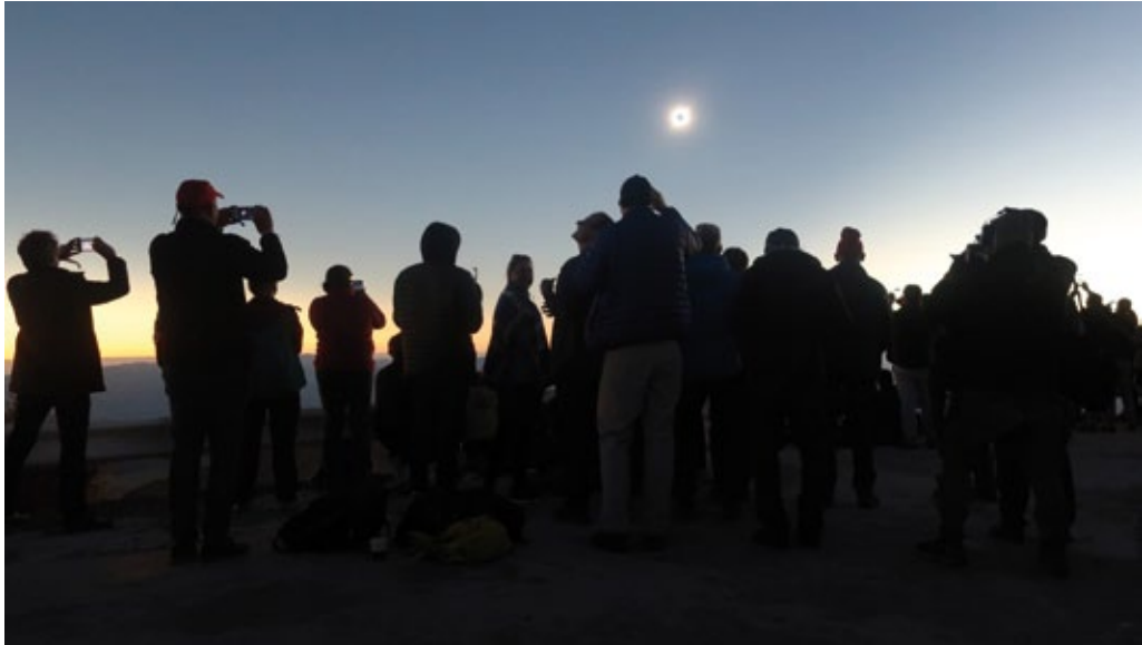
Eclipse solar en el desierto de Atacama en Chile observado por estudiantes polacos de Poznań y Toruń, julio de 2019.