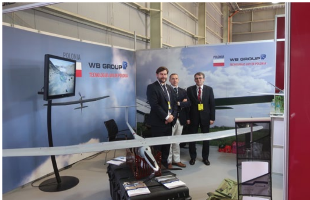
Expositores polacos en la Feria Internacional de Aviación FIDAE, Chile, abril de 2018.

Las previsiones según las cuales la pandemia provocaría una fuerte caída del comercio no se han materializado. El valor de exportación a México aumentó de 778,47 millones en 2019 hasta 828 millones de dólares en 2020, con un volumen total que alcanzó 1540 millones de dólares. En el caso de Chile, el volumen subió de