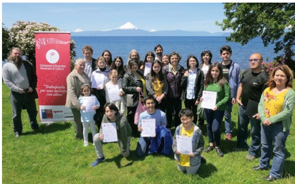
Conclusión de talleres de música impartidos por el músico polaco Krzysztof Lasoń, Frutillar (Chile), noviembre de 2019 (foto de archivo de la embajada de Polonia en Santiago).