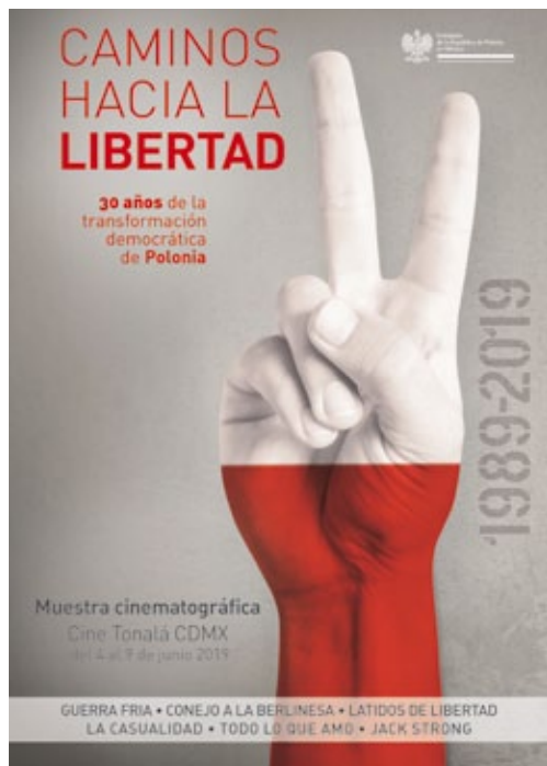
«Caminos hacia la libertad» – cartel de proyección de películas, México, junio de 2019.