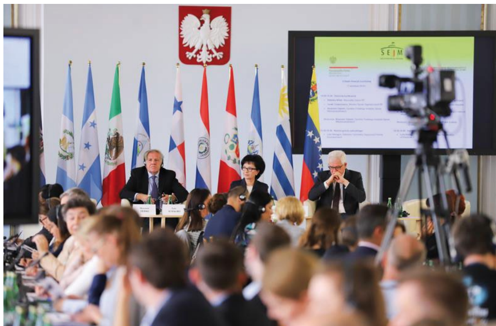
II Día de América Latina y el Caribe en el Sejm de la República de Polonia con la participación del Secretario General de la Organización de Estados Americanos L. Almagro, septiembre de 2019.

Los años 2019-2021 fueron un período de prueba para los partidos políticos gobernantes en los países de América Latina y del Caribe. Los votantes se mostraron cada vez más impacientes por la falta de soluciones rápidas para los problemas que se iban acumulando a lo largo de los años y exigieron la sustitución inmediata de los políticos, a quienes consideraban culpables de la crisis, fuesen de corte izquierdista o derechista. Esta situación abrió paso a la retórica populista, tanto de izquierdas como de derechas.