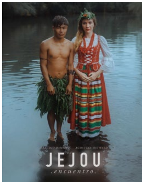
Cartel del cortometraje «Jejou»; el estreno tuvo lugar en diciembre de 2019.