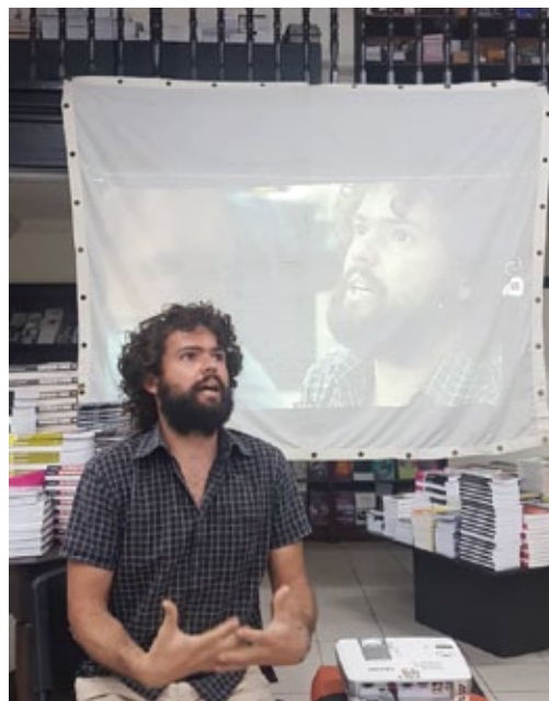
Leyendo un drama de teatro polaco. La Habana (Cuba), noviembre de 2021.