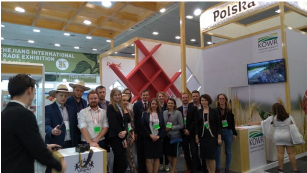
Feria Agroalimentaria, Guadalajara (México), marzo de 2019.