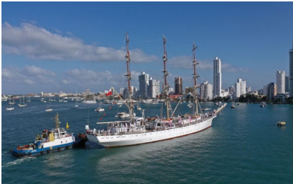
«Dar Młodzieży» llega al puerto de Cartagena de Indias (Colombia), enero de 2019.