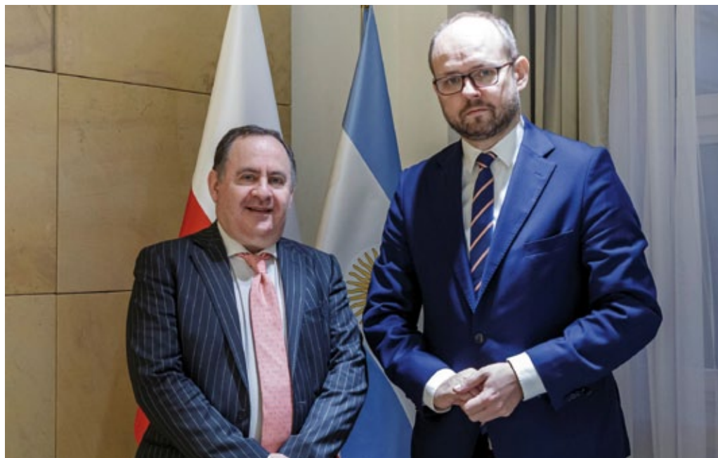
Visita del Viceministro de Relaciones Exteriores, Comercio Internacional y Culto de la República Argentina, C. J. Rozencwaig, Varsovia, noviembre de 2021 (foto de archivo del Ministerio de Asuntos Exteriores de Polonia).