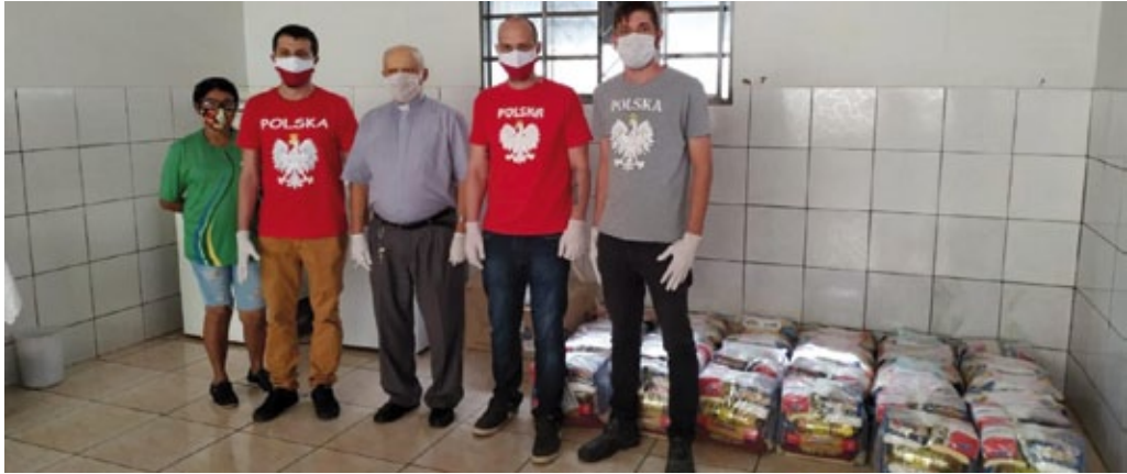
#Polonia4Neighbors, Igreja Sagrado Coração de Jesus, Nova Veneza en el estado de Goiás (Brasil), mayo 2020 (foto de archivo de la embajada de Polonia en Brasilia).

programa, las instituciones han prestado apoyo financiero a la comunidad polaca y promovido la solidaridad social polaca en las comunidades locales.