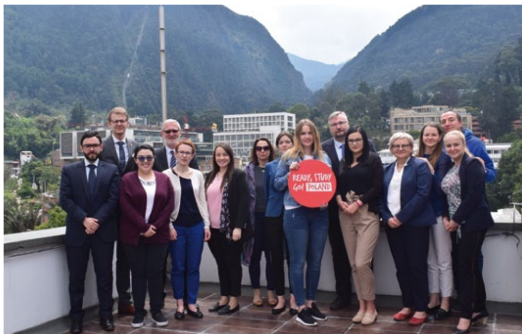
Visita de la Agencia Nacional de Intercambio Académico y representantes de universidades polacas a Colombia, marzo de 2020.