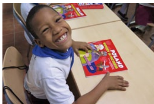
Taller en Palacio del Segundo Cabo, La Habana (Cuba), marzo de 2020 (foto de archivo de la embajada en La Habana).