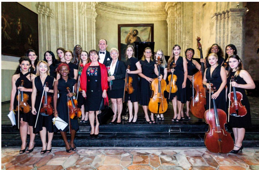
Concierto en la Basílica Menor de San Francisco en La Habana (Cuba), enero de 2019.