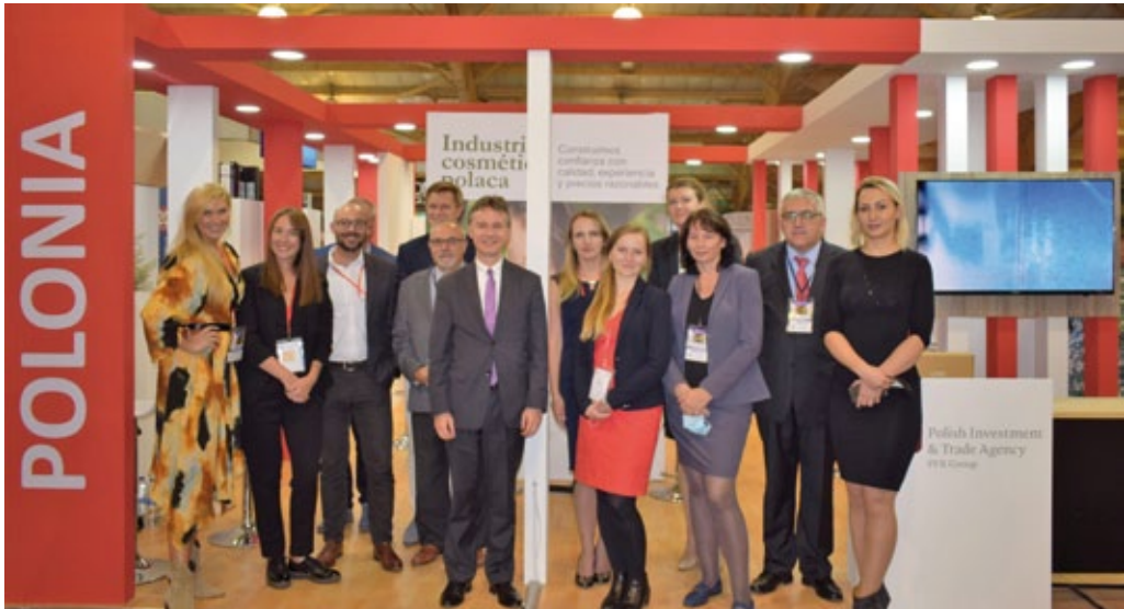
Feria de cosmética «Belleza y Salud», Bogotá, octubre 2021 (foto de archivo de la embajada de Polonia en Bogotá).

zas de Panamá, la Asociación Panameña de Exportadores, la Asociación Panameña de Ejecutivos de Empresa, así como empresarios locales y miembros de una misión económica organizada por la Agencia Polaca de Promoción de las Exportaciones. En octubre de 2021 en la capital de Colombia tuvo lugar la feria internacional «Belleza y Salud». Gracias a la colaboración de la embajada con la Oficina del Comercio Exterior de la PAIH, en Bogotá se estableció un puesto de exposición del sector cosmético polaco. Siete empresas de Polonia presentaron sus productos.