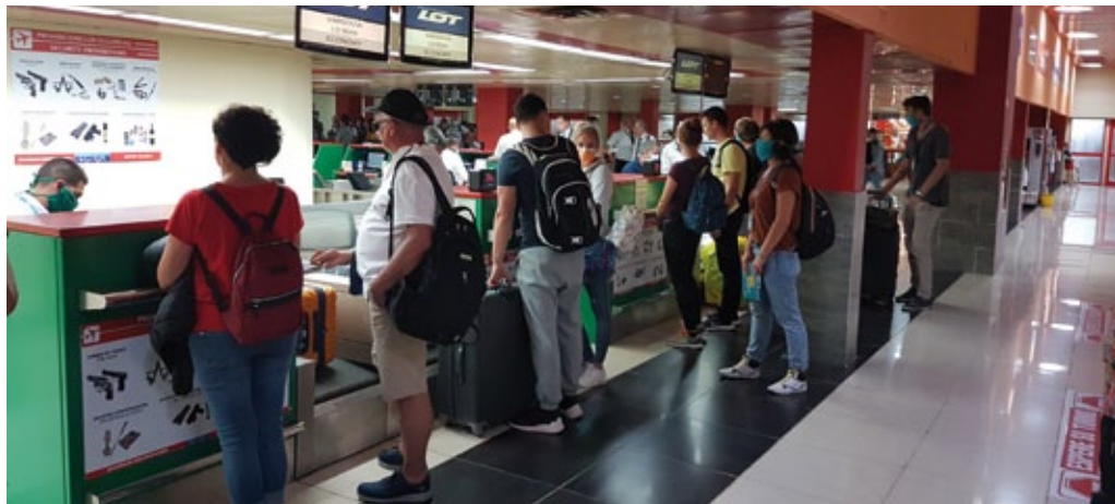
Acción #LOTdoDomu, La Habana (Cuba), marzo de 2020 (foto de archivo de la embajada en La Habana).

Otro ejemplo de la eficacia del servicio consular fue la liberación de un capitán polaco que se encontraba privado de libertad desde agosto de 2019, después de haber sido acusado de presunta participación en el tráfico de 225 kg de cocaína. En marzo de 2021, el tribunal de Ciudad Victoria, en México, absolvió al capitán polaco de los cargos por falta de pruebas que demostrasen que el acusado hubiera cometido el hecho prohibido a consciencia. Desde el principio la embajada de Polonia estuvo involucrada en los esfuerzos para liberar al capitán polaco. El presidente de Polonia Andrzej Duda felicitó al Ministerio de Asuntos Exteriores por su eficacia.