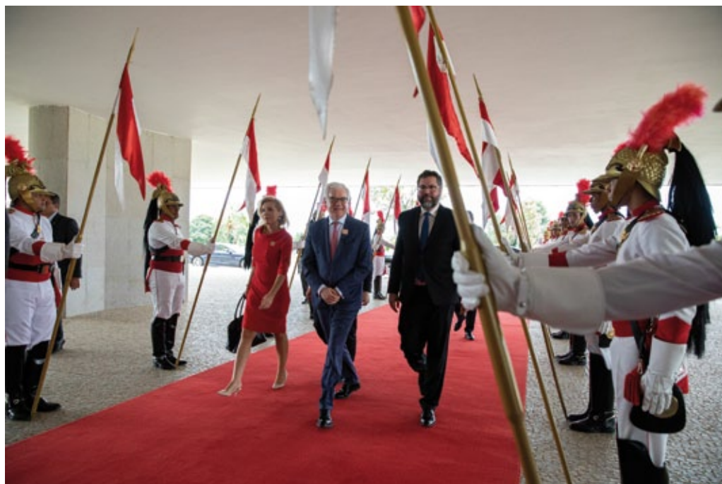
Visita oficial del Ministro de Asuntos Exteriores J. Czaputowicz a Brasil, febrero de 2020.