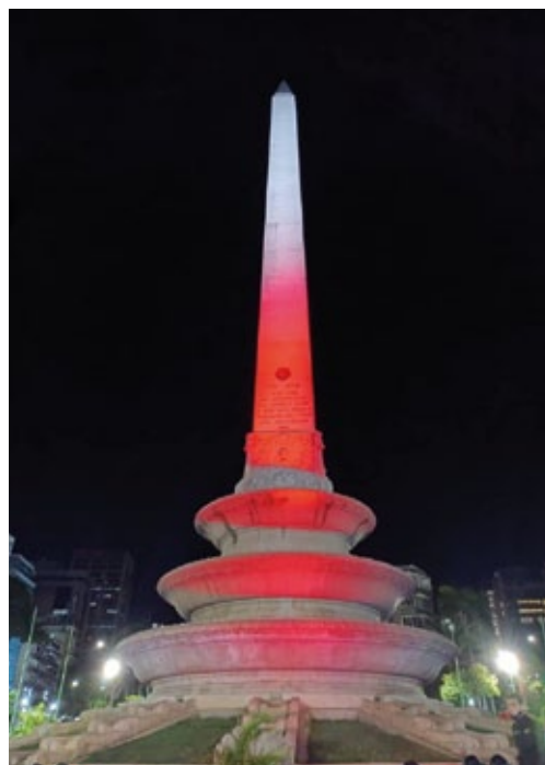
Iluminación del obelisco de la plaza Altamira con motivo del Día de la Independencia de Polonia, noviembre de 2021.