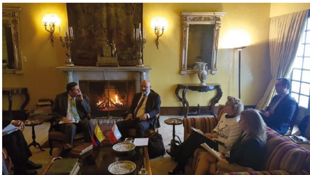
Consultas políticas polaco-colombianas a nivel de viceministros de relaciones exteriores, Bogotá, noviembre de 2019 (foto de archivo del Ministerio de Asuntos Exteriores de Polonia).