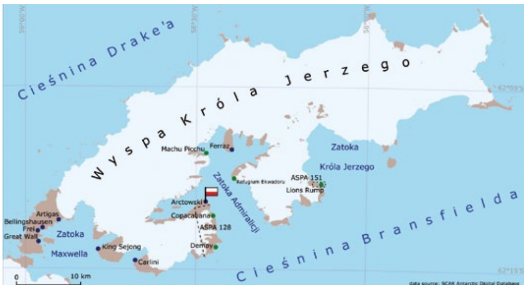
Estación Antártica Polaca Henryk Arctowski en la Isla Rey Jorge

La Conferencia de Rectores de Escuelas Académicas de Polonia (KRASP) ha establecido una estrecha colaboración con Asociación Nacional de Universidades e Instituciones de Educación Superior (ANUIES), su homóloga mexicana. El acuerdo entre KRASP y ANUIES facilita el intercambio de estudiantes y académicos, así como la realización de proyectos de investigación y didáctica conjuntos. En febrero de 2019, la Cátedra de Estudios Polacos inició su actividad en la Universidad Nacional Autónoma de México (UNAM). En la Universidad de Varsovia anteriormente había sido creada la Cátedra Mexicana. En la Universidad Jaguelónica se fundó el Centro Mexicano. Se establecieron conexiones de Internet directas entre las bibliotecas de la Universidad de Varsovia, la Universidad Jaguelónica y la UNAM. Los principales centros académicos de México especializados en ciencias sociales, tales como el Colegio de México o el Centro de Investigación y Docencia Económicas (CIDE), inician la colaboración con científicos polacos. La Escuela Politécnica de Łódź y el Tecnológico de Monterrey realizan proyectos de investigación conjuntos.