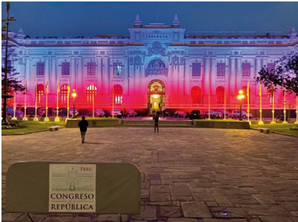
40o aniversario del sindicato polaco Solidaridad – Congreso del Perú, agosto de 2020.

Inversiones y Comercio ( Polska Agencja Inwestycji i Handlu, PAIH ). En la región funcionan 49 consulados dirigidos por los cónsules honorarios. El mayor número de consulados activos no profesionales está subordinado a las embajadas de Polonia en Caracas y en Ciudad de Panamá.