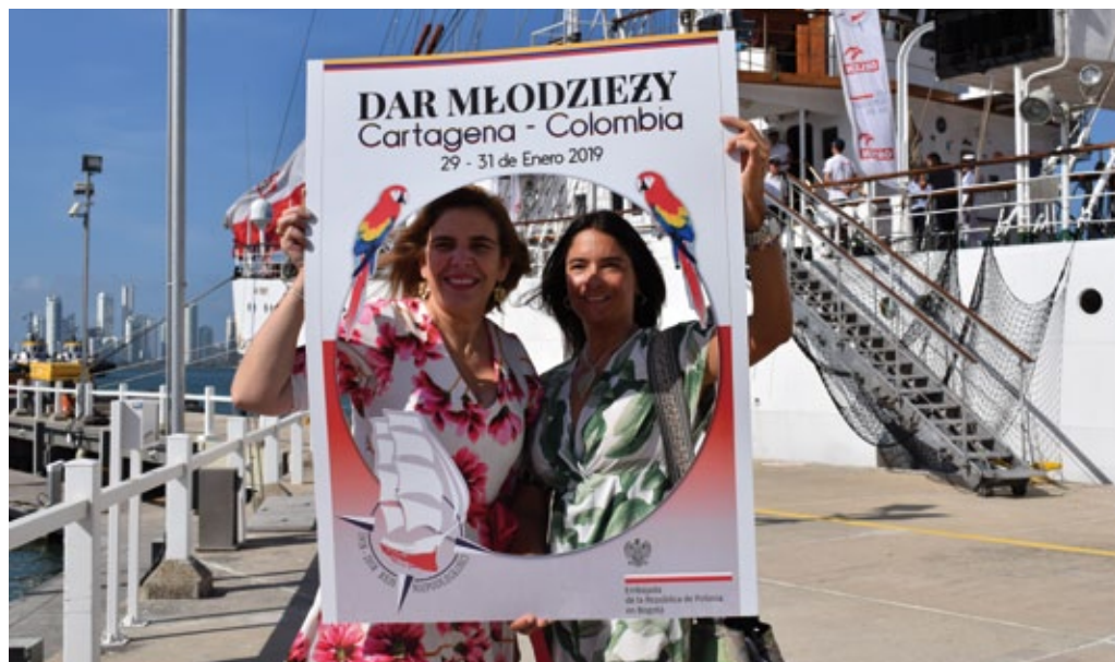
«Dar Młodzieży» en Cartagena de Indias (Colombia), enero de 2019.

En Panamá, la visita del velero coincidió con la Jornada Mundial de la Juventud (22-27 de enero de 2019), en la que participaron más de 4 mil peregrinos de Polonia (el grupo europeo más numeroso) y va-