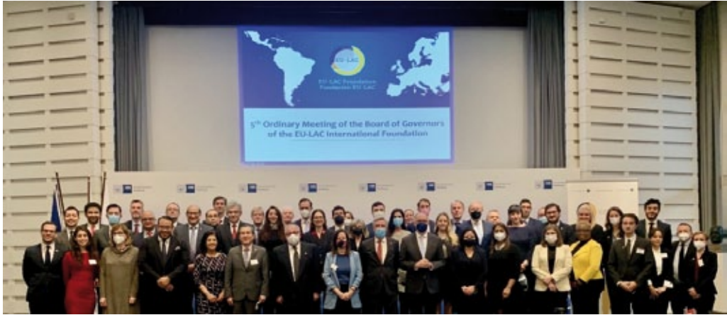
Reunión del Consejo de Gobierno de la Fundación Internacional EU-América Latina y el Caribe, Hamburgo, noviembre de 2021 (foto: Fundación EU-LAC).

La UE es el tercer socio comercial de América Latina y del Caribe y el primer inversor en la región. Además, la UE es el mayor donante de ayuda al desarrollo. La Unión Europea ha firmado acuerdos de libre comercio y acuerdos de asociación con la mayoría de los países de América Latina y del Caribe y con los bloques de integración. Ellos son importantes no solo para las relaciones comerciales, sino también para el diálogo político. Hay que mencionar los acuerdos de asociación con México, Chile y América Central (Guatemala, Honduras, Costa Rica, Nicaragua, Panamá y Salvador), así como los acuerdos de libre comercio con Colombia, Perú y Ecuador.