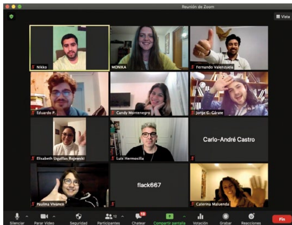
Curso de polaco en línea como parte del proyecto de la Embajada de la República de Polonia en Santiago de Chile, agosto de 2021.

A finales de junio de 2021 el número de contagios en la región disminuyó considerablemente, situándose en niveles más bajos que en otras partes del mundo. Según sostienen los especialistas, esta situación puede explicarse con el aceleramiento del ritmo de la vacunación. El aumento de la inmunidad de la mayoría de la población de la región también fue un efecto secundario del gran número de personas infectadas.