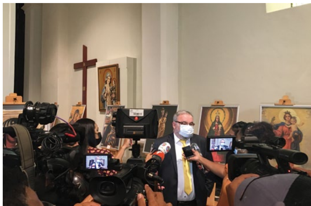
Inauguración de la exposición «Culto Mariano en Polonia», Panamá, junio de 2021.