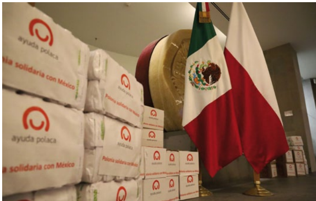
Ayuda polaca para las personas afectadas por las inundaciones en los estados de Tabasco y Chiapas, México, diciembre de 2020 (foto de archivo de la embajada de Polonia en la Ciudad de México).

En Brasil el apoyo al presidente Jair Bolsonaro tras casi tres años en el poder ha caído, situándose en el 20%. Según las encuestas el candidato que tendrá más posibilidades de ganar las elecciones convocadas para el 2022, es Luiz Inácio Lula da Silva ex-presidente de Brasil (2003-2010), del Partido de los Trabajadores. Sin embargo, casi un tercio de los votantes brasileños, decepcionados tanto de la izquierda como de la derecha, esperan la aparición de otro candidato que participe en la lucha electoral.