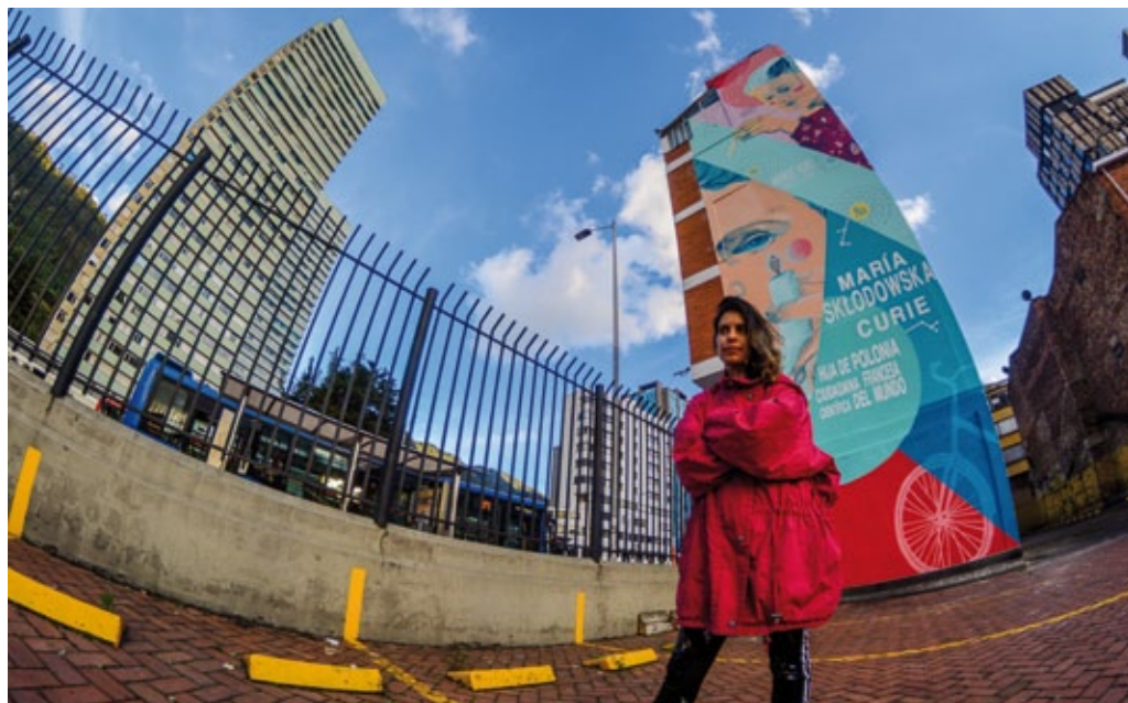
Mural dedicado a M. Skłodowska-Curie. Bogotá, Colombia, agosto de 2020 (foto de archivo de la embajada de Polonia en Bogotá).