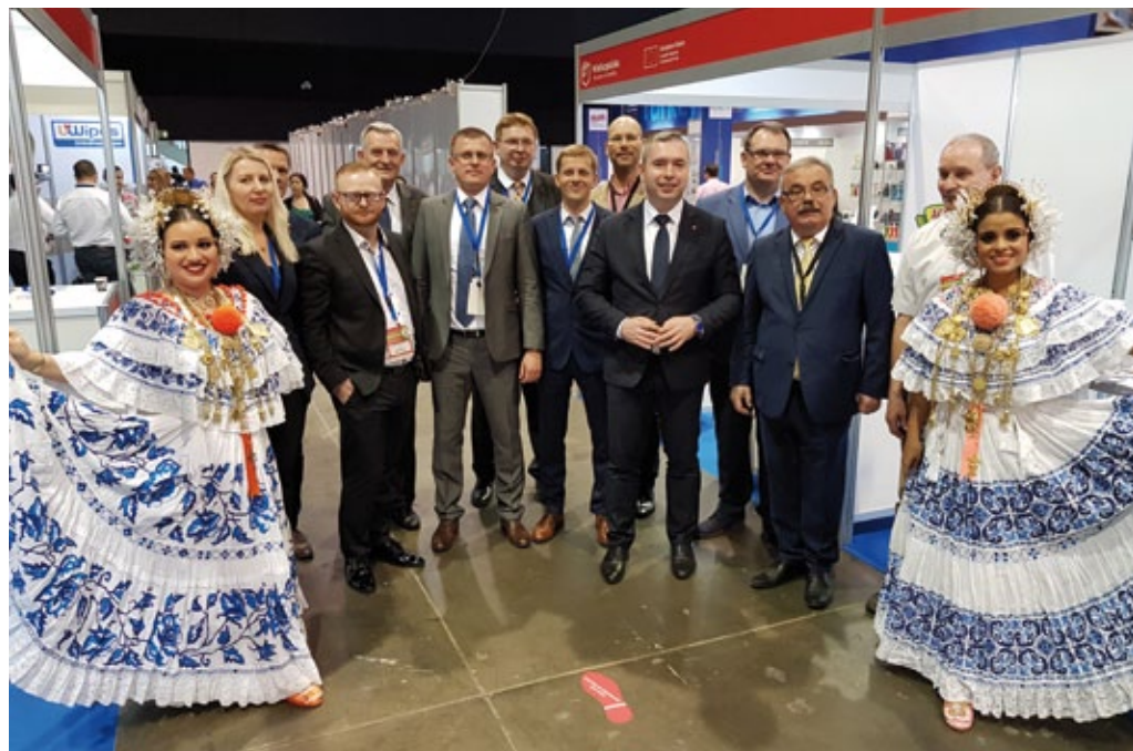
Los participantes polacos en la exposición comercial multisectorial Expocomer en Panamá, marzo de 2019 (foto de archivo de la embajada de Polonia en Panamá).

298 a 306 millones de dólares (la exportación disminuyó de 158,5 a 147,9 millones de dólares) y de Argentina, aumentó de 730 a 791,6 millones de dólares (la exportación disminuyó de 106,6 a 69,8 millones de dólares). En cuanto a Brasil, el valor de la exportación disminuyó de 448 a 443 millones de dólares, y el volumen total de 2080 a 1860 millones de dólares. En los primeros ocho meses del 2021, se ha registrado un aumento espectacular del valor de la exportación a México: a 1240 millones de dólares (alcanzando un valor casi 50% más alto en comparación con todo el 2020). En cuanto al volumen de negocios con Brasil, Chile y Argentina, el valor de la exportación fue un poco más alto que en todo el año anterior.