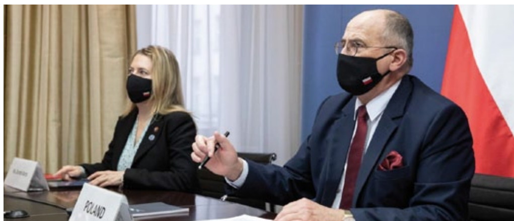
El ministro de Asuntos Exteriores de Polonia Z. Rau en la reunión ministerial UE-América Latina y el Caribe, diciembre de 2020 (foto de archivo del Ministerio de Asuntos Exteriores de Polonia).

Las relaciones interparlamentarias son satisfactorias, proporcionando un nivel adicional de cooperación política. En el Sejm y el Senado de la República de Polonia funcionan: Grupo de Amistad con México, Grupo Parlamentario Polaco-Brasileño, Grupo Parlamentario Polaco-Peruano y Grupo Parlamentario Polaco-Argentino. En 2019, el Ministerio de Asuntos Exteriores organizó por segunda vez, junto con el Sejm y el Instituto Polaco de Asuntos Internacionales ( Polski Instytut Spraw Międzynarodowych PISM ), el Día de América Latina y del Caribe, cuyo invitado especial fue el Secretario General de la Organización de los Estados Americanos Luis Almagro.