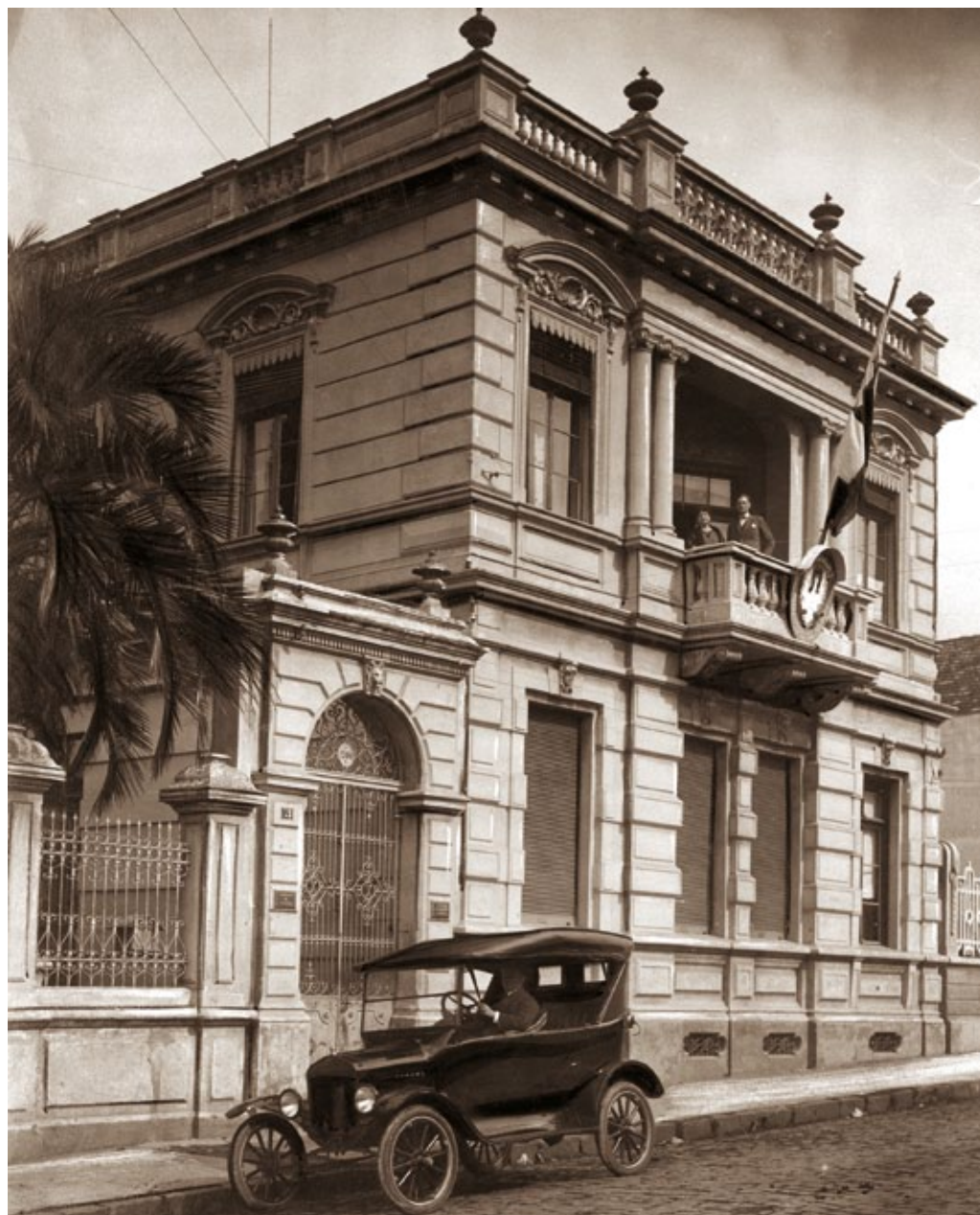
El edificio del Consulado de la República de Polonia en Curitiba, década de 1920.