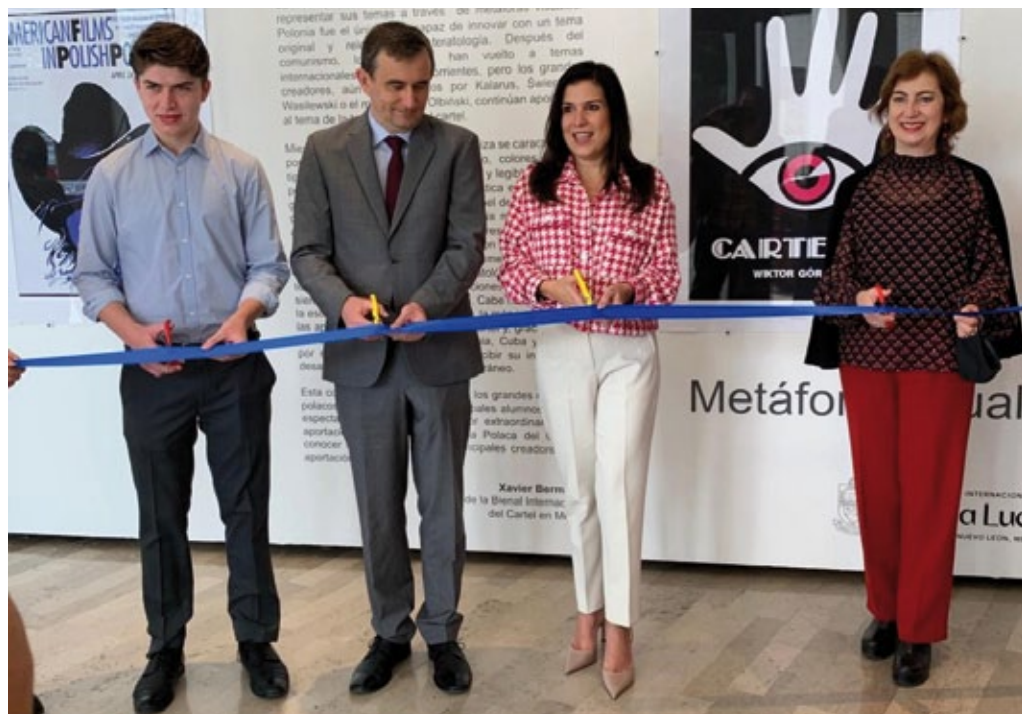
Inauguración de la exposición „Maestros del Cartel Polaco”, Festival Santa Lucía (México), octubre de 2021 (foto de archivo de la embajada de Polonia en Ciudad de México).