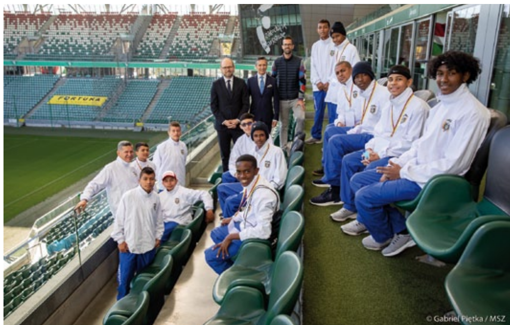
El viceministro de Asuntos Exteriores de Polonia M. Przydacz con los participantes de la 6a edición del proyecto de diplomacia deportiva polaco-colombiana, Varsovia, septiembre de 2021.

el 40º aniversario de la creación del sindicato Solidaridad, el 80º aniversario de la Masacre de Katyń y el centenario del nacimiento de San Juan Pablo II. En uno de los mayores diarios mexicanos, «El Universal», se publicó una reimpresión de la portada del periódico del 1 de septiembre de 1939, así como numerosos artículos y entrevistas dedicados al inicio de la Segunda Guerra Mundial.