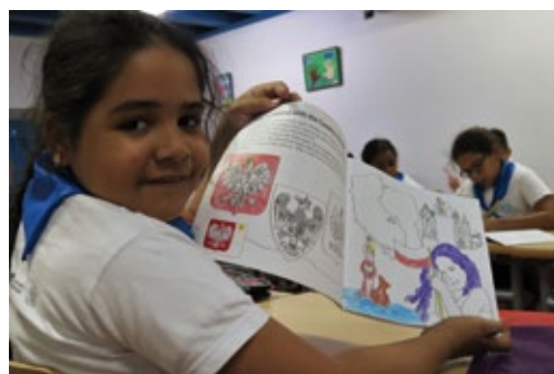
Taller en Palacio del Segundo Cabo, La Habana (Cuba), marzo de 2020 (foto de archivo de la embajada de Polonia en La Habana).