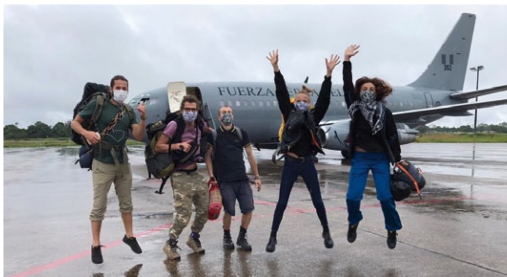
Evacuación de polacos como parte de la acción #LOTdoDomu, Lima (Perú), marzo de 2020.

En vuelos chárter, organizados en el marco de la acción #LOTdodomu (vuelo a casa), fueron evacuados los polacos y extranjeros autorizados a entrar en Polonia, en total más de 2,5 mil personas. El mayor número de compatriotas privados de la posibilidad de volver a casa se encontraba en la República Dominicana. Se utilizaron cuatro aviones para evacuar a 1128 personas a Polonia. Entre ellos, había tanto clientes de agencias de viajes TUI y Rainbow, como turistas individuales y personas que pudieron registrarse y llegar a tiempo a la República Dominicana desde Panamá, Guatemala y Costa Rica. Desde México, 419 personas volvieron al país. Hubo dos vuelos chárter desde la Habana a Varsovia que transportaron 274 personas. Desde Rio de Janeiro volvieron al país 260 polacos; desde Lima, 165 y desde Buenos Aires en el último avión en el marco de esta acción a casa regresaron 78 personas. Gracias a la cooperación en situación de crisis, pudieron volver a sus países los ciudadanos de Ucrania (60 personas), México (40 personas), Lituania (33 personas), Perú (44 personas), Gran Bretaña (20 personas), Dinamarca (14 personas), Irlanda (12 personas), así como ciudadanos de otros países: Chequia, Argentina, Portugal, Italia, Francia, España, Turquía y Eslovenia.