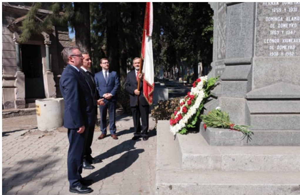
Visita del ministro K. Szczerski a Chile – depositando flores en la tumba de la familia Domeyko, marzo de 2018 (foto de archivo de la embajada de Polonia en Santiago).