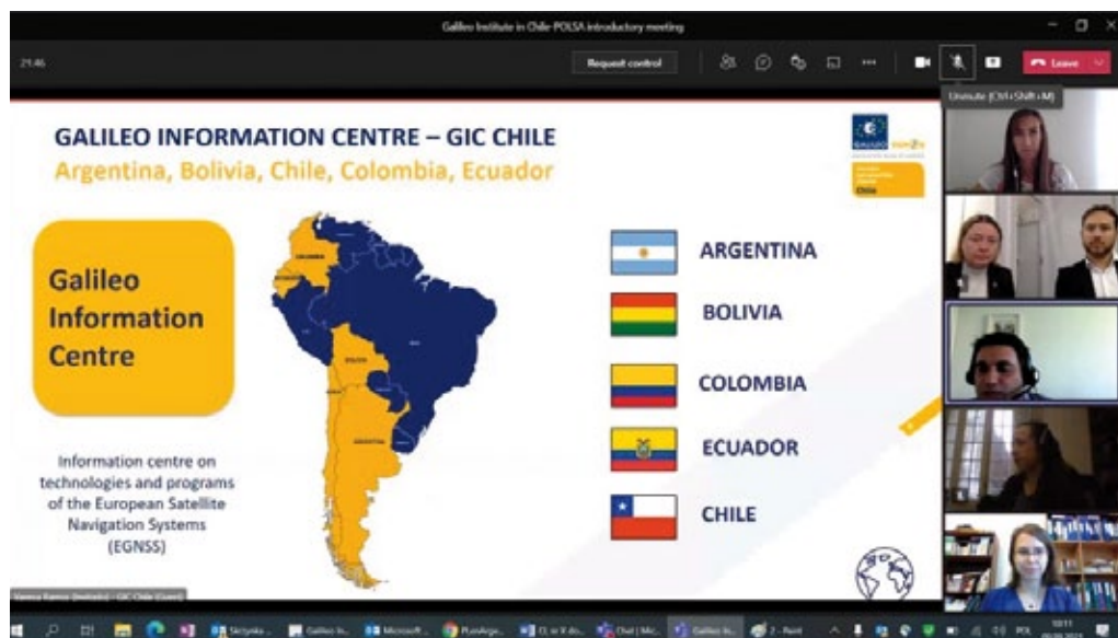
Reunión en línea POLSA – Centro de Información Galileo, septiembre de 2021 (foto de archivo de la embajada de Polonia en Buenos Aires).

POLSA participan en las actividades del grupo de trabajo GIC Chile sobre Argentina. Por su parte, el objetivo de la reunión entre los representantes del Instituto Nacional Geológico y los servicios geológicos argentinos SEGEMAR fue encontrar potenciales áreas de colaboración entre ambas instituciones.