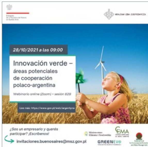
Folleto del seminario web «Innovaciones ecológicas: perspectivas de cooperación polaco-argentina», octubre de 2021 (foto de archivo de la embajada de Polonia en Buenos Aires).

Una forma interesante de cooperación entre Polonia y América Latina es el acuerdo bilateral sobre el programa Working Holiday Programme destinado a jóvenes de los países signatarios, entre 18 y 30 años. La participación en el programa permite conocer la cultura y el país visitado, combinando una estancia vacacional de un año con la posibilidad de obtener un empleo remunerado. Hasta ahora hemos firmado este tipo de acuerdos con Chile, Argentina y Perú y negociamos uno con Brasil.