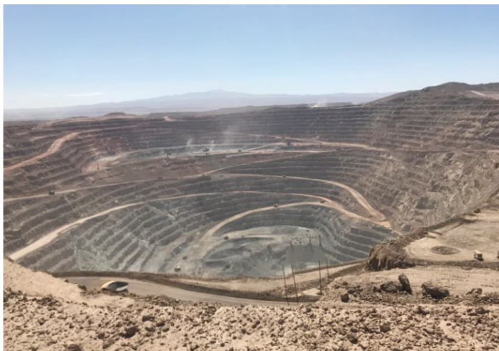
Mina de cobre Sierra Gorda en el desierto de Atacama, región de Antofagasta, Chile, febrero de 2020 (foto de archivo de la embajada de Polonia en Santiago).

En la mayoría de los países la lucha contra la pandemia se vio dificultada por los problemas estructurales: la pobreza, las desigualdades sociales, la ineficacia de los servicios de salud y la debilidad de las instituciones estatales. Otro problema que mencionar es la economía sumergida, con el número muy alto de personas contratadas de manera irregular que no disponían de ningún tipo de seguridad social en el caso de perder sus fuentes de ingresos. En consecuencia, fue extremadamente difícil tomar decisión del cierre de la economía. Además, para las personas que se vieron obligadas a elegir entre exponerse a las sanciones o pasar hambre, las posibilidades de respetar el confinamiento eran muy limitadas. Se calcula