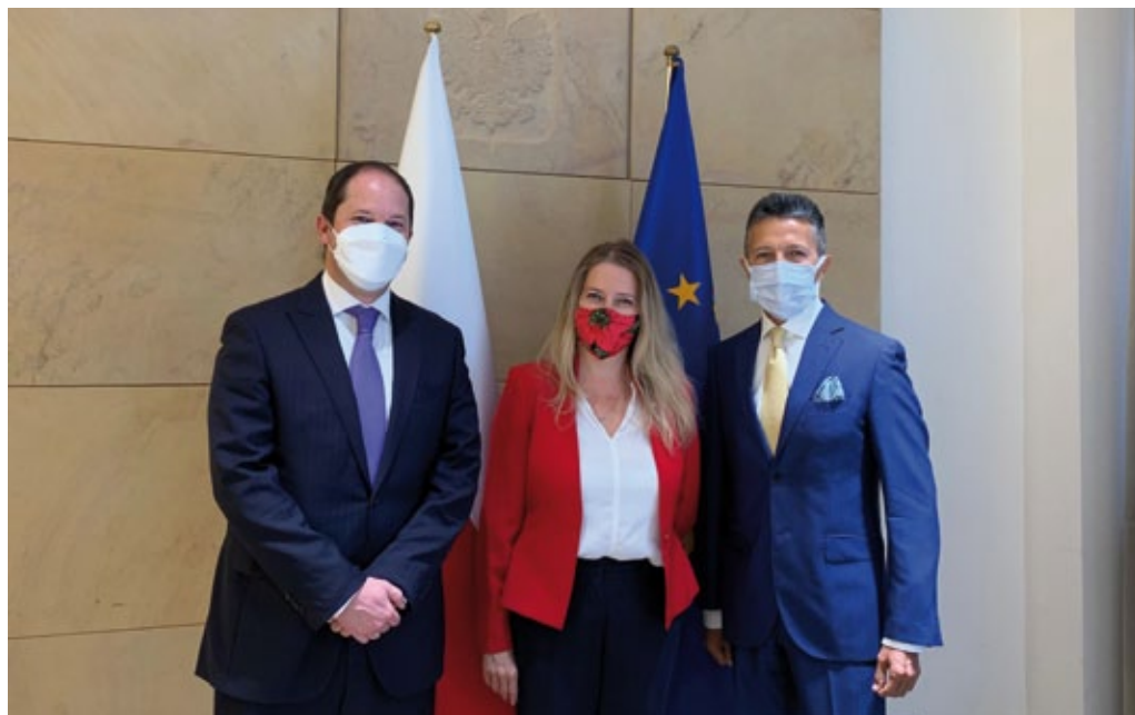
Visita de J. F. Espinosa, Director de Migración-Colombia del Ministerio de Relaciones Exteriores a Polonia, septiembre de 2021 (foto de archivo de la embajada de Colombia en Varsovia).