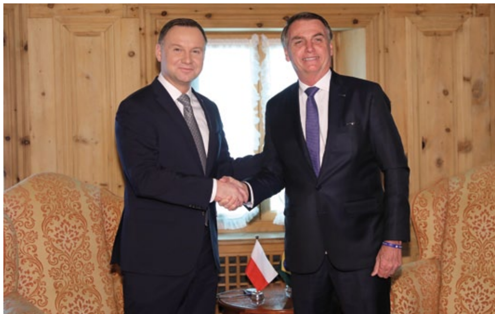
El presidente de la República de Polonia, A. Duda y el presidente de Brasil, J. Bolsonaro, durante una reunión en Davos, enero de 2019.

La reactivación de las relaciones políticas con Brasil fue un gran éxito de nuestra diplomacia. El Ministro de los Asuntos Exteriores de Polonia, Jacek Czaputowicz, participó en la ceremonia de investidura del presidente Jair Bolsonaro que tuvo lugar el 1 de enero de 2019. En esta ocasión se entrevistó con su homólogo Ernesto Araújo. El presidente Andrzej Duda se reunió con el presidente Bolsonaro durante el Foro Económico Mundial de Davos (24 de enero de 2019). Otras reuniones de alto nivel incluyeron una visita a Brasilia del Jefe del Gabinete del Presidente, el Ministro Krzysztof Szczerski; una visita de trabajo a Varsovia del Ministro Araújo y consultas políticas en Varsovia a nivel de viceministros de Asuntos Exteriores. La embajada de la República de Polonia en Brasilia ha entablado estrechas relaciones con el