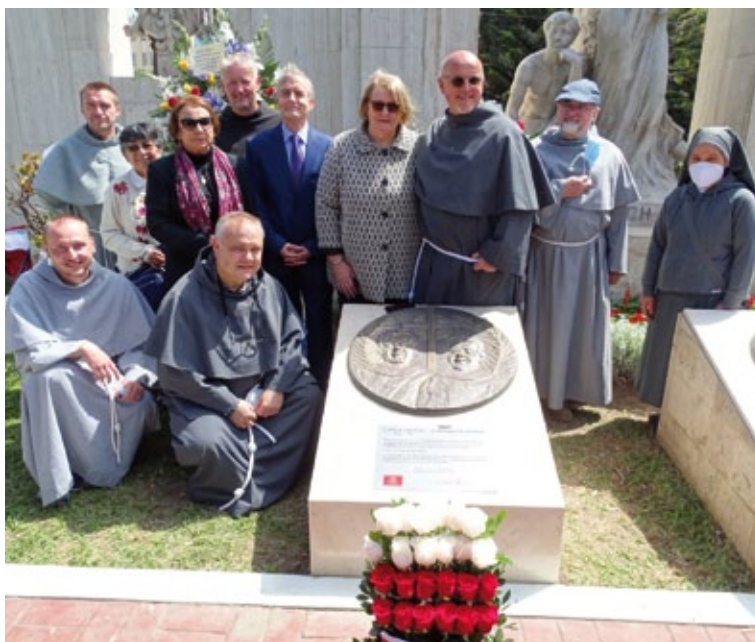
Inauguración del monumento a los Padres Polacos Franciscanos asesinados por el Sendero Luminoso en Pariacoto (Perú) en 1991, Lima, agosto de 2021.