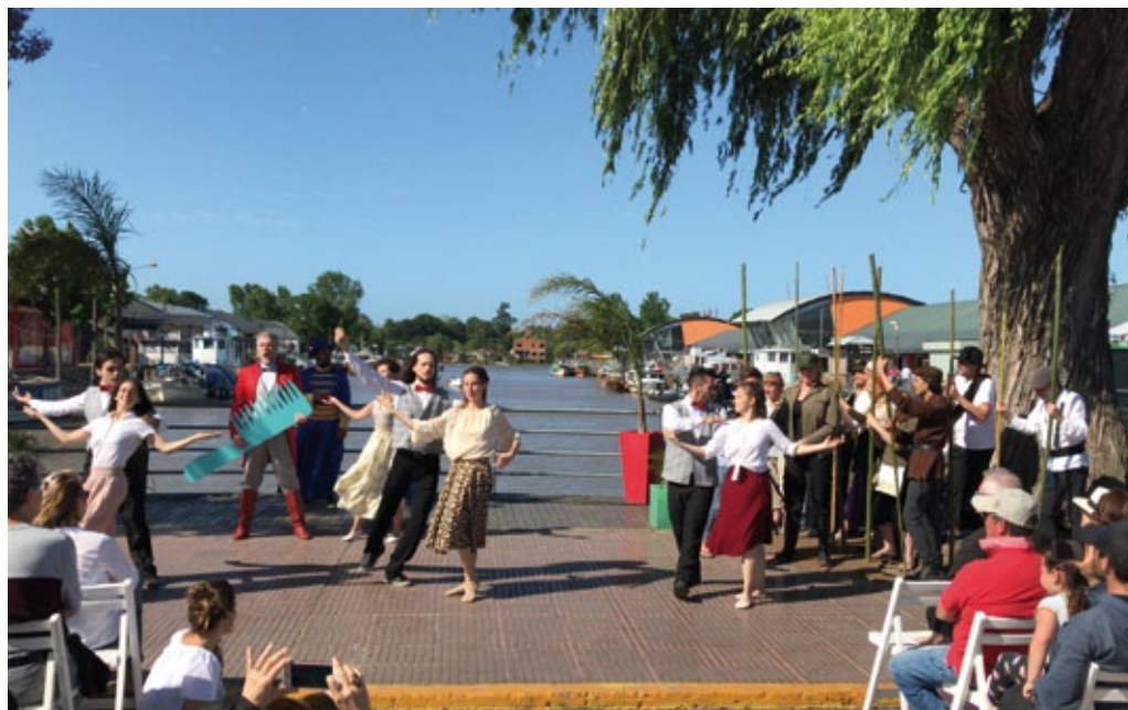
«Flis» de S. Moniuszko dirigida por M. Znaniński durante el festival Opera Tigre en Argentina, junio de 2019.