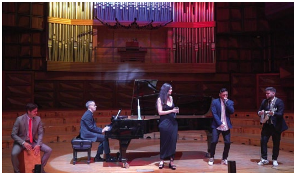
Gala musical con motivo del Día de la Independencia de Polonia en el salón S. Bolívar en la sede de CNASPM, Caracas, noviembre de 2021 (foto de archivo de la embajada de Polonia en Caracas).