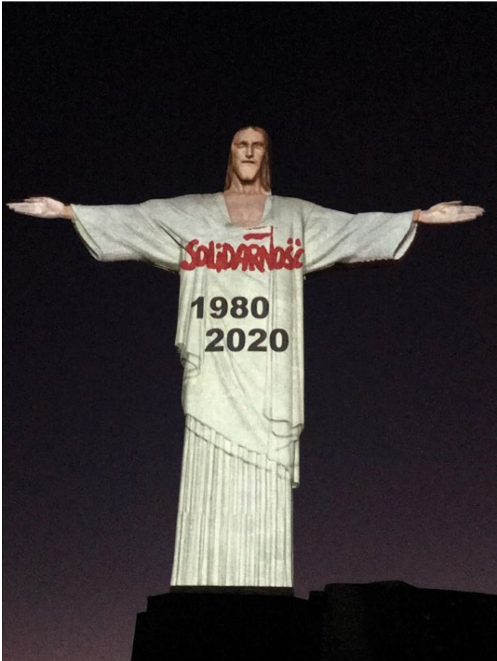
Iluminación de la estatua del Cristo Redentor en Río de Janeiro (Brasil) con motivo del 40o aniversario de la creación del sindicato polaco Solidaridad, agosto de 2020 (foto de archivo de la embajada de Polonia en Brasilia).