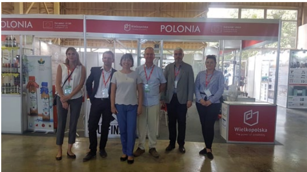
Feria Internacional de La Habana (Cuba), noviembre de 2019 (foto de archivo de la embajada de Polonia en La Habana).