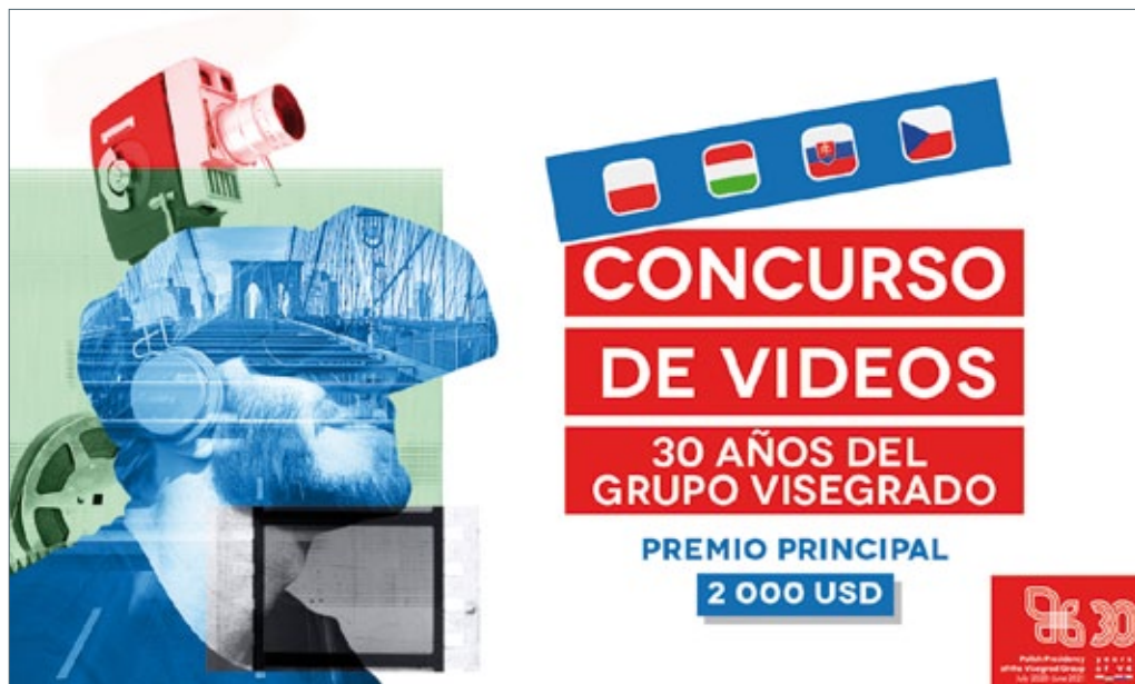
Concurso con motivo del 30o aniversario de la constitución del Grupo de Visegrado, preparado por la embajada de Polonia en México, septiembre de 2020.