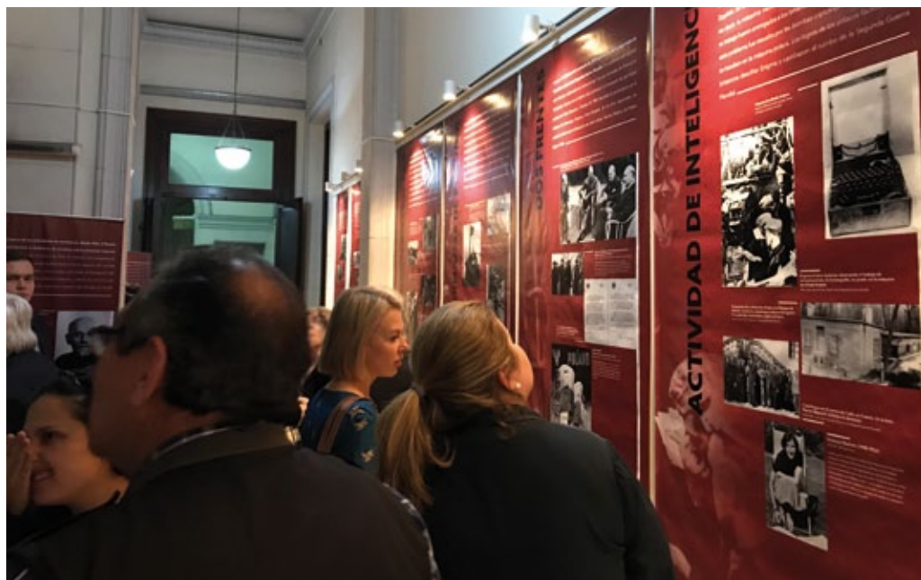
Inauguración de la exposición «Lucha y Sufrimiento» en el Archivo General de la Nación argentino, octubre de 2019 (foto de archivo de la embajada de Polonia en Buenos Aires).