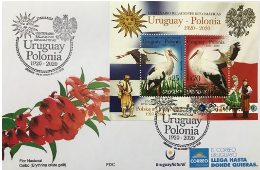
Sello postal conmemorativo con motivo del Centenario de relaciones Polonia-Uruguay

Después de que las potencias mundiales dejaran de reconocer el Gobierno Polaco en Londres en julio de 1945, no todos los países reconocieron el Gobierno Provisional de la Unión Nacional en Varsovia. Cuba mantuvo relaciones con el Gobierno Polaco en el exilio hasta 1959. La República Popular de Polonia y la República de Cuba establecieron relaciones diplomáticas en 1960. Las relaciones diplomáticas con Paraguay se reanudaron en 1991. Con los países de América Latina y el Caribe íbamos elevando progresivamente el grado de representación diplomática desde las legaciones hasta las embajadas, por ejemplo: en 1960, con México; en 1961, con Brasil; en 1964, con Uruguay; en 1969, con Perú; en 1972, con Costa Rica; y en 1979, con Honduras.