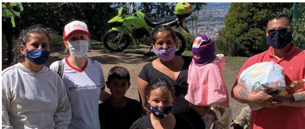
Acción #Polonia4Neighbors, Bogotá (Colombia), mayo de 2020 (foto de archivo de la embajada de Polonia en Bogotá).

La pandemia ha limitado en gran medida las posibilidades de contactos directos entre la comunidad polaca y las misiones diplomáticas. En la mayoría de los países de la región son los actos organizados por las misiones diplomáticas los que contribuyen de manera significativa a la integración de las comunidades polacas. Entre otras iniciativas, la campaña #Polonia4Neighbours, en marcha desde mediados de abril de 2020, ha contribuido a reforzar los lazos con la comunidad polaca en tiempos difíciles. En el marco de este