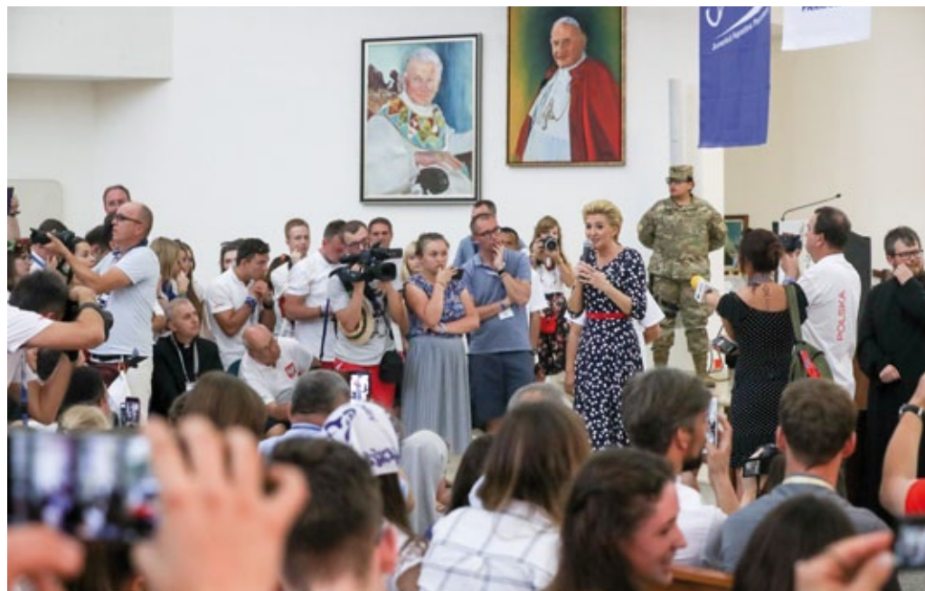
Esposa del presidente de la República de Polonia en la Jornada Mundial de la Juventud en Panamá, enero de 2019.