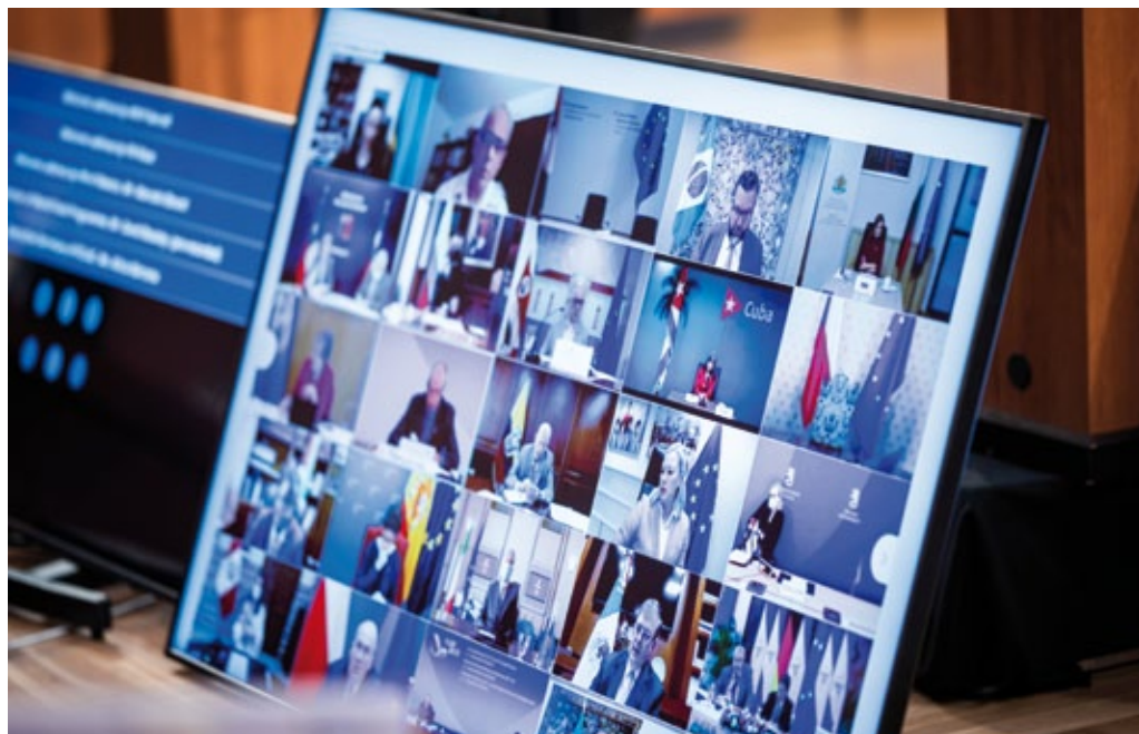
Reunión ministerial informal EU-América Latina y el Caribe en Berlín, diciembre de 2020

Argentina, Bolivia y Venezuela buscan el restablecimiento de la UNASUR, que no ha sido formalmente resuelta. Dan prueba de la intención de restablecer la integración regional en torno a un eje de izquierdas las palabras del presidente argentino, Alberto Fernández, quien dijo que era necesario reconstruir el bloque de UNASUR «libre de ideología».