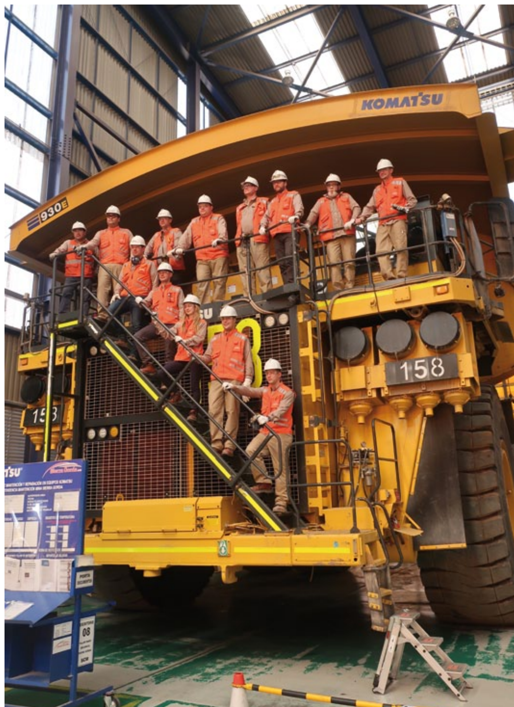
Delegación de representantes de KGHM en visita a la mina de cobre Sierra Gorda, Región de Antofagasta, Chile, febrero de 2020 (foto de archivo de la embajada de Polonia en Santiago).