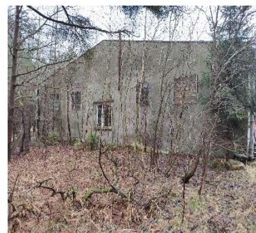
Ściana od strony północnej