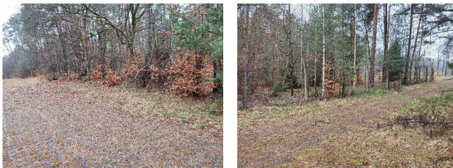
wjazd oraz część placu z płyt betonowych (ażurowych)