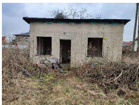
Strona zachodnia budynku