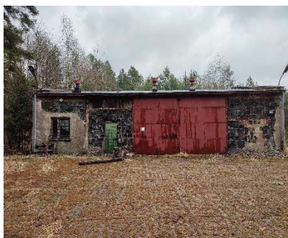
Ściana od strony zachodniej