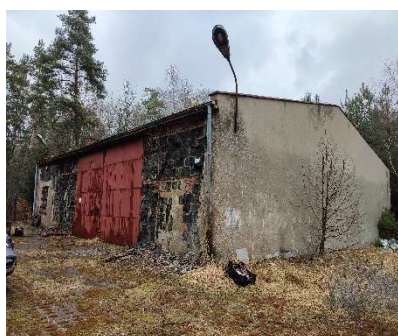
Ściana od strony południowej