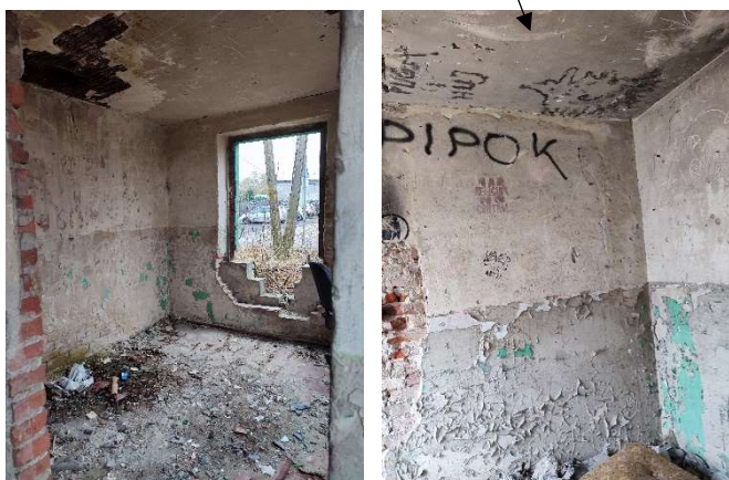
pomieszczenia wewnątrz budynku