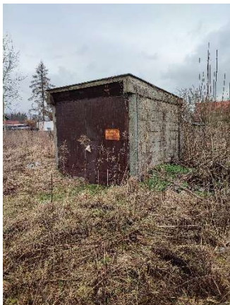
Strona zachodnia budynku