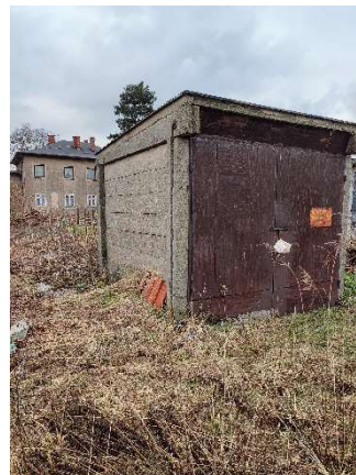
Strona północna budynku