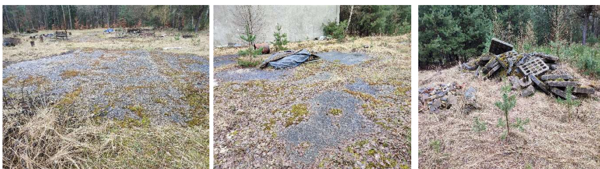
Plac-pozostałości po nakładkach asfaltowych