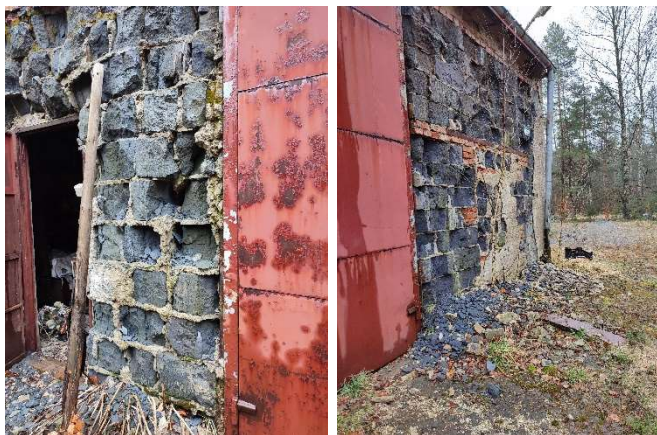
Ubytki muru od strony zachodniej