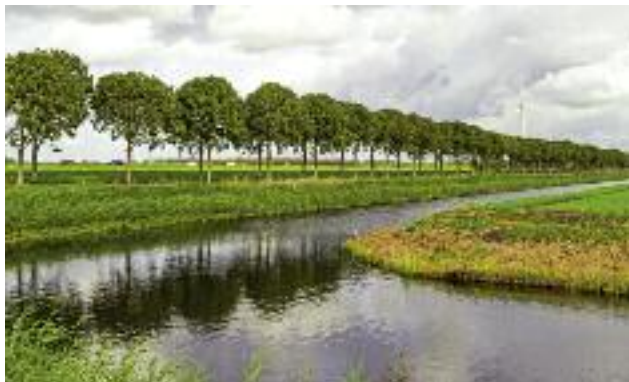
W rezerwie celowej budżetu państwa, środki na realizację zadań z zakresu utrzymania urządzeń melioracyjnych zostały w tym roku zwiększone o 50 mln zł