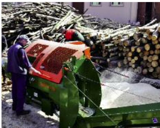
Udzielana będzie pomoc na rozwój przedsiębiorczości w ramach poddziałania „Wsparcie inwestycji w przetwarzanie produktów rolnych, obrót nimi lub ich rozwój”

wano wsparcie do 500 tys. zł w zakresie rozwoju usług rolniczych . Realizacja tego poddziałania tworzy warunki dla rozwoju mikroprzedsiębiorstw w obszarze usług dla rolnictwa oraz poprawy możliwości zatrudnienia, przyczyniając się do zrównoważonego rozwoju społeczno-gospodarczego obszarów wiejskich. Nabory na to działanie planowane są do przeprowadzenia w październiku 2016 r.