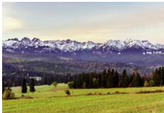
Na przełomie 2016 i 2017 r. planowane jest przeprowadzenie uzgodnień ze służbami KE w sprawie nowej delimitacji ONW

● zmniejszenie obciążeń administracyjnych dla rolników poprzez ograniczenie informacji wymaganych przy wypełnianiu wniosku o przyznanie płatności;