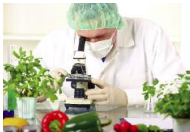
Koncepcję zmian w organizacji i funkcjonowaniu służb inspekcyjnych opracowuje specjalny Zespół do spraw reformy instytucjonalnej systemu bezpieczeństwa żywności

Zarządzeniem nr 7 z dnia 7 marca 2016 r. powołany został Zespół do spraw reformy instytucjonalnej systemu bezpieczeństwa żywności w zakresie należącym do kompetencji IJHARS oraz Inspekcji Handlowej, dotyczącym zadań, organizacji i finansowania nowotwo-