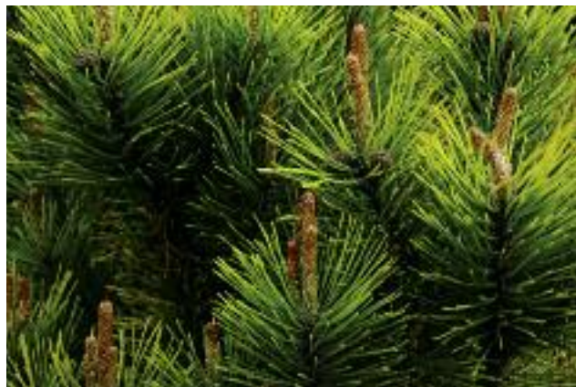
Wprowadzone uproszczenia dotyczą także inwestycji w rozwój obszarów leśnych