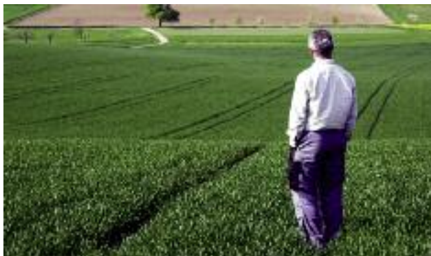
Głównym celem ustawy o wstrzymaniu sprzedaży nieruchomości Zasobu Własności Rolnej Skarbu Państwa oraz o zmianie niektórych ustaw jest realna ochrona polskiej ziemi przed niekontrolowanym wykupem

osobiście co najmniej przez 5 lat gospodarstwo rolne o powierzchni nie przekraczającej 300 ha użytków rolnych i zamieszkujący w tym gospodarstwie,