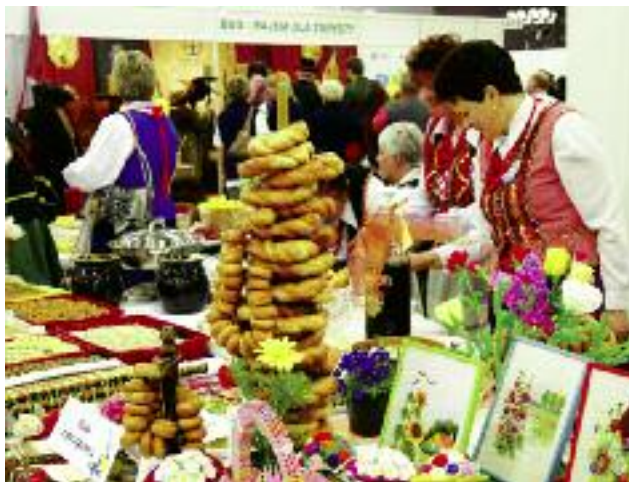
MRiRW zaproponowało uproszczenia m.in. w zakresie realizacji projektów promocyjnych

wzięcia wchodzić liczne imprezy towarzyszące, w szczególności: konferencje, seminaria, warsztaty, wizyty i wyjazdy studyjne czy konkursy dla wystawców i zwiedzających;