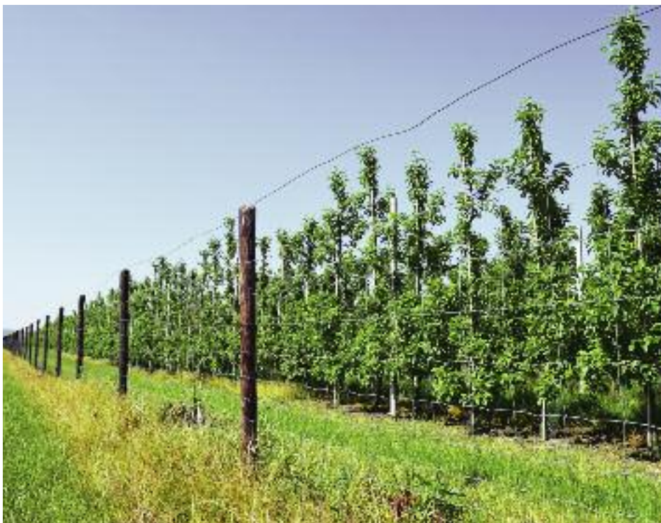
Regulacja, zabraniająca zakupu ze środków PROW 2014-2020 maszyn czy urządzeń tego samego rodzaju, jak nabyte w ramach PROW 2007-2013, nie dotyczy zakładania sadów i np. inwestycji w budynki

darstwo od rolnika, który korzystał z pomocy na „Modernizację gospodarstw rolnych” w ramach PROW 2007-2013. W przypadku, gdy następcą lub nabywcą przejął gospodarstwo po upływie 5-letniego okresu związania z celem, określonym