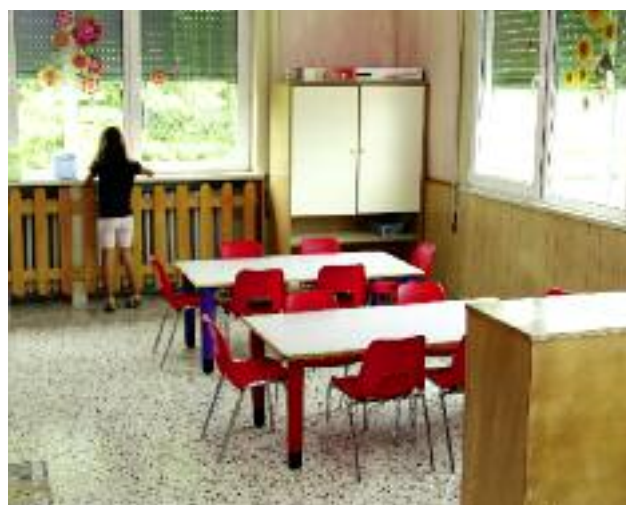
Rozważana jest możliwość przekazania części nieruchomości, wchodzących w skład Zasobu Własności Skarbu Państwa, w trwałe zarząd resortowych szkół rolniczych