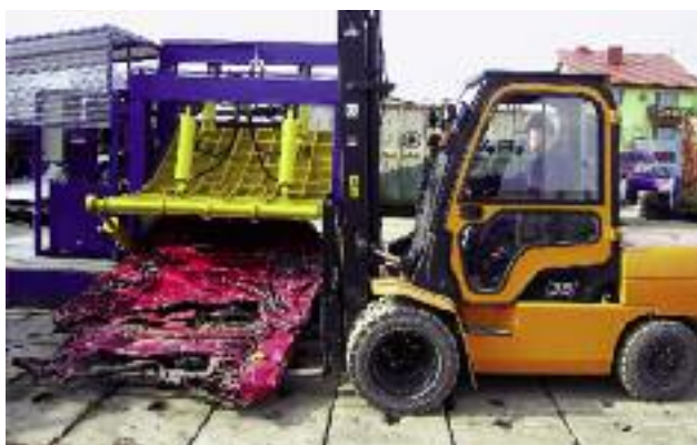
Na rozpoczęcie pozarolniczej działalności gospodarczej na obszarach wiejskich można otrzymać premię w ramach PROW 2014-2020

Realizacja tego celu, w ramach PROW 2014-2020, odbywa się poprzez poddziałanie „Pomoc na rozpoczęcie pozarolniczej działalności gospodarczej na obszarach wiejskich” typ operacji Premie na rozpoczęcie działalności pozarolniczej . Przy wyborze operacji do wsparcia, w ramach ww. poddziałania, preferowani będą m.in. beneficjenci poddziałania „Płatności na rzecz rolników kwalifikujących się do systemu dla małych gospodarstw, którzy trwale przekazali swoje gospodarstwo rolne innemu rolnikowi” PROW 2014-2020. Przekazanie małego gospodarstwa, na zasadach określonych w PROW 2014-2020,