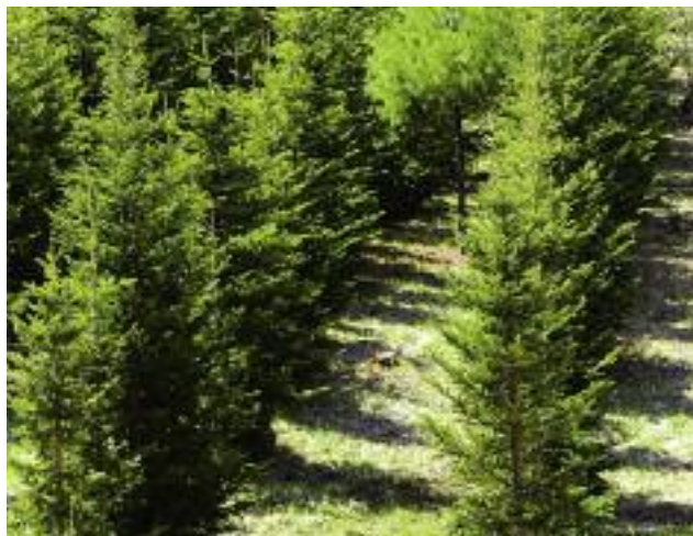
Uproszczone zostały procedury ubiegania się o przyznanie pomocy w ramach działania zalesieniowego PROW 2014-2020.