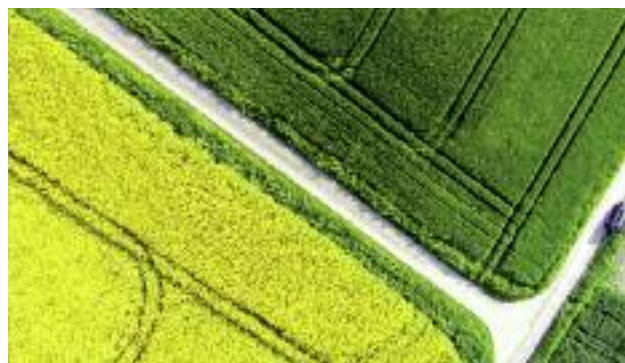
Przygotowane zostały zmiany legislacyjne, które przyczynią się do usprawnienia prowadzenia postępowań scaleniowych, w tym głównie do ich przyspieszenia

W celu promocji najlepszych rozwiązań w zakresie scaleń gruntów, zarówno pod względem gospodarczym, technicznym i organizacyjnym, organizowany jest corocznie ogólnopolski konkurs jakości prac scaleniowych, połączony z seminarium o zasięgu ogólnokrajowym, w ramach którego przyznawane są nagrody Ministra Rolnictwa i Rozwoju Wsi. W 2015 r. zaplanowano środki w wysokości 40 tys. zł.