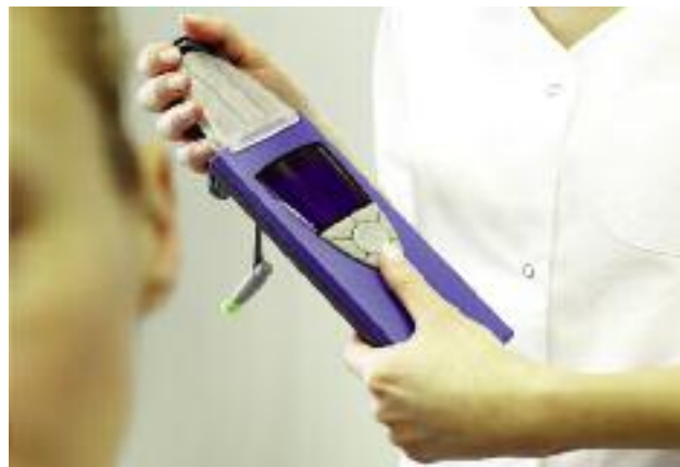
Zgodnie z ustawą o ubezpieczeniu rolników, liczne programy profilaktyczne dedykowane są także dzieciom, jak np. badanie słuchu

Kontynuowane są wszystkie działania, przewidziane ustawą o ubezpieczeniu społecznym rolników , w tym rehabilitacja lecznicza rolników w zakładach własnych KRUS, liczne programy profilaktyczne, dedykowane ubezpieczonym oraz świadczeniobiorcom, a także dzieciom z rodzin rolniczych, tj. np. badanie słuchu dla