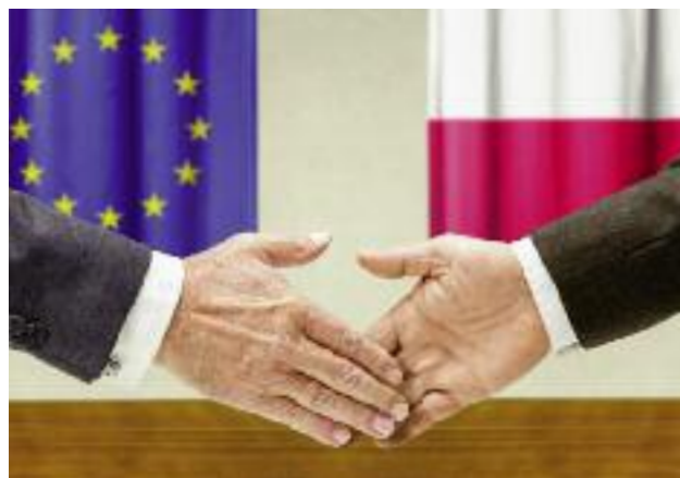
Na wspieranie uczestnictwa polskich organizacji rolniczych, reprezentujących interesy zawodowe rolników indywidualnych na forum, przeznaczono w tegorocznym budżecie dotację celową w wysokości 4 mln zł

Reprezentacja interesów polskiego rolnictwa na forum unijnym wyraża się przede wszystkim poprzez przedstawicielstwo polskich organizacji rolniczych w COPA i COGECA – najważniejszych ekonomicznych grup interesu, działających przy Komisji Europejskiej, prowadzących lobbing na rzecz rolnictwa i producentów rolnych w krajach członkowskich UE. Polskie organizacje rolnicze aktywnie uczestniczą w pracach tych organizacji, w szczególności angażowały się w tworzenie pakietu legislacyjnego, dotyczącego WPR na lata 2014-2020. W związku ze zbliżającym się przeglądem mechanizmów WPR udział polskich organizacji rolniczych