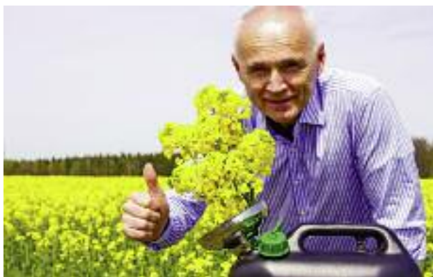
Biopaliwo można otrzymywać z odpowiednio przetworzonych roślin oleistych, jak rzepak, słonecznik czy soja