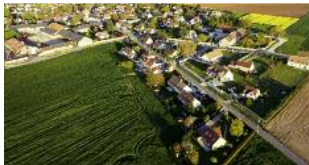
Poselski projekt ustawy o zmianie ustawy o ochronie gruntów rolnych i leśnych, przewiduje zwolnienie z obowiązku stosowania przepisów tej ustawy w odniesieniu do gruntów rolnych stanowiących użytki rolne, położonych w granicach administracyjnych miast

oraz niektórych innych ustaw (Dz. U. poz. 337) wprowadzono obowiązek posiadania na dzień 31 maja danego roku tytułu prawnego do gruntów Zasobu Własności Rolnej Skarbu Państwa, do których rolnik ubiega się o płatności. W konsekwencji Minister Rolnictwa i Rozwoju Wsi przygotował zmianę rozporządzeń wykonujących ww. przepisy: