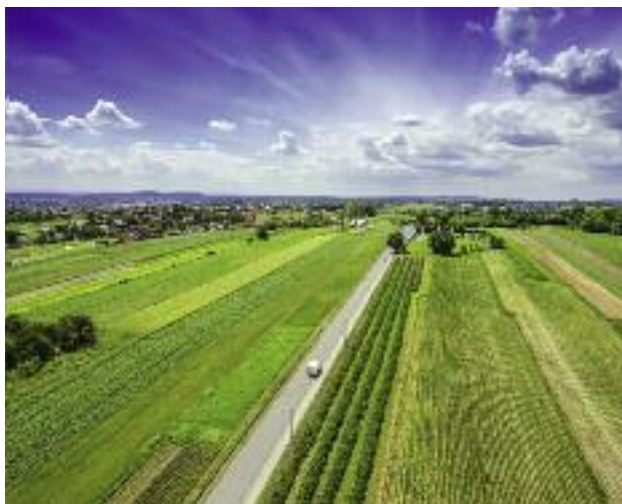
W projekcie Paktu dla obszarów wiejskich przewiduje się m.in. działania, dot. rewitalizacji obszarów defaworyzowanych, w tym obszarów popegeerowskich

MRiRW bierze aktywny udział w pracach nad RPO 2014-2020, zabiegając o odpowiednie uwzględnienie problematyki wsparcia dla obszarów po byłych PGR w dokumentach programowych i wdrożeniowych, w ramach prac Komitetów Monitorujących.