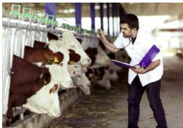
Podstawę do wypracowania jednolitego systemu kontroli w łańcuchu żywnościowym będą stanowić m.in. analizy obowiązujących przepisów prawa z zakresu urzędowych kontroli żywności

Realizacja tego działania wymaga przeprowadzenia analiz, dotyczących m.in. obowiązujących przepisów prawa z zakresu urzędowych kontroli żywności, które będą stanowić podstawę do wypracowania propozycji jednolitego i zintegrowanego systemu kontroli w łańcuchu rolno-spożywczym, uwzględniającego zarówno zakres kompetencji, jak i strukturę nowych organów kontrolnych.