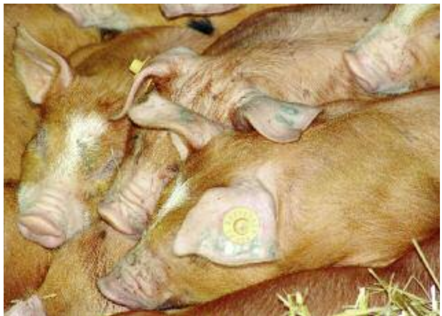
W związku z zapobieganiem szerzeniu się afrykańskiego pomoru świń, rolnicy z woj. podlaskiego, którzy zdecydowali się na rezygnację z chowu i hodowli trzody chlewnej w 2016 r., mogą starać się o rekompensaty

Biuletyn informacyjny nr 6/2016 (189). Wydawany przez Ministerstwo Rolnictwa i Rozwoju Wsi oraz Agencję Restrukturyzacji i Modernizacji Rolnictwa.