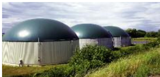
W ramach prac, w zakresie promocji biopaliw i innych paliw odnawialnych, Minister Rolnictwa i Rozwoju Wsi zaproponował wsparcie wykorzystania biogazu rolniczego w transporcie

MRiRW wskazywało na potrzebę uwzględnienia tematyki biopaliw w ramach prac badawczych, prowadzonych przez Instytut Technologiczno-Przyrodniczy oraz Instytut Biotechnologii Przemysłu Rolno-Spożywczego. Ponadto w ramach zmian legislacyjnych, Minister Rolnictwa zaproponował nowelizację rozporządzenia Ministra Gospodarki z dnia 22 stycznia 2009 r. w sprawie wymagań jakościowych dla biopaliw ciekłych w zakresie określenia wymagań jakościowych dla skroplonego biometanu oraz sprężonego biometanu, w celu uniemożliwienia stosowania tych paliw w transporcie. MRiRW zaproponowało, aby wykonywanie działalności gospodarczej, polegającej na sprzedaży biogazu rolniczego do wykorzystania w transporcie, odbywało