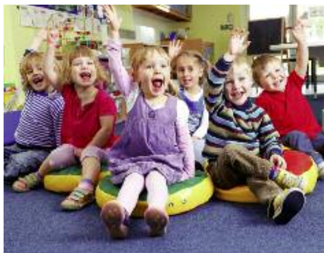
W związku z deficytem usług opiekuńczych planowane są działania, mające na celu m.in. rozwój klubów dziecięcych, punktów przedszkolnych i świetlic

tecznych w działające i inicjowane przedsięwzięcia kooperacyjne (m.in. klastry) w obszarze aktywizowania środowisk lokalnych i rozwoju obszarów wiejskich. Modelowym przykładem są tutaj wioski tematyczne, np. w woj. warmińsko-mazurskim i zachodniopomorskim.