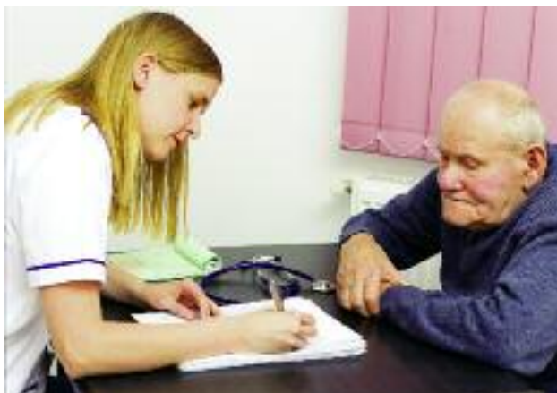
Podjęte zostały starania, aby objąć medycyną pracy osoby związane z rolnictwem w szerszym wymiarze, niż dotychczas

MRiRW bierze aktywny udział w pracach nad RPO 2014-2020, zabiegając o odpowiednie uwzględnienie