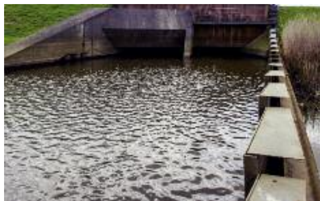
Planowane jest przygotowanie programu rozwoju małej energetyki wodnej w połączeniu z działaniami przeciwpowodziowymi, zwiększającymi retencję wody w glebie

Minister Rolnictwa i Rozwoju Wsi zwrócił się do Ministra Energii, który odpowiada za koordynację działań, wynikających z dokumentu rządowego pt.: Kierunki rozwoju biogazowni rolniczych w Polsce w latach 2010-2020 , z wnioskiem o aktualizację tego dokumentu i wyznaczenie nowych zadań. Wśród propozycji przedstawione zostały następujące zagadnienia: