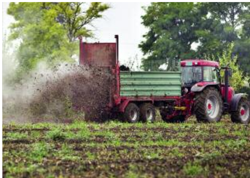
Zalecane jest, aby plan nawozowy był opracowany i stosowany od pierwszego sezonu wegetacyjnego objętego realizacją biznesplanu

szkoły zawodowej, szkoły średniej lub studiów pierwszego, drugiego stopnia oraz jednolitych studiów magisterskich. Wówczas przyznawane są punkty, które mają wpływ na kolejności przysługiwania pomocy. Wyjątkowo dopuszcza się możliwość uzupełnienia wykształcenia w okresie 36 miesięcy od dnia doręczenia decyzji,