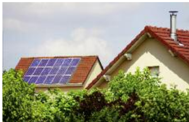
Finansowanie, w ramach poddziałania „Wsparcie inwestycji w przetwarzanie produktów rolnych, obrót nimi lub ich rozwój”, może być przyznane na inwestycje dot. wytwarzania energii ze źródeł odnawialnych do własnego użytku

Rozporządzenie Ministra Rolnictwa i Rozwoju Wsi, regulujące zasady przyznawania i wypłaty pomocy w ww. poddziałaniu, znajduje się obecnie w konsultacjach publicznych. Po zakończeniu procesu legislacyjnego i opublikowaniu rozporządzenia, Samorządy Województw będą mogły uruchomić nabory na operacje typu Inwestycje w targowiska lub obiekty budowlane przeznaczone na cele promocji lokalnych produktów . Planuje się, że pierwsze nabory wniosków odbędą się w lipcu 2016 r.