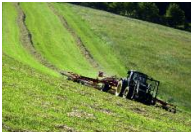
W PROW 2014-2020 zostały już m.in. wprowadzone uproszczenia w zakresie płatności dla obszarów z ograniczeniami naturalnymi.