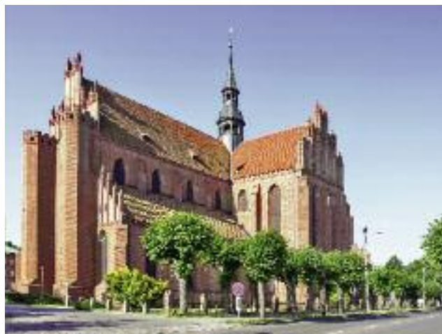
Jednostki organizacyjne, nie mające osobowości prawnej, w tym kościoły, mogą ubiegać się o pomoc w zakresie, m.in. wzmocnienia kapitału społecznego i rozwoju przedsiębiorczości na obszarze wiejskim

Instrumentem, aktualnie umożliwiającym wsparcie podmiotów ekonomii społecznej, jest poddziałanie „Wsparcie na wdrażanie operacji w ramach strategii rozwoju lokalnego kierowanego przez społeczność” w ramach inicjatywy Leader (RLKS – rozwój lokalny kierowany przez społeczność). Jednostka organizacyjna, nie posiadająca osobowości prawnej (organizacje pozarządowe, spółdzielnie, kościoły), może ubiegać się o pomoc w zakresie, m.in. wzmocnienia kapitału społecznego i rozwoju przedsiębiorczości na obszarze wiejskim, objętym strategią rozwoju lokalnego, kierowanego przez społeczność.