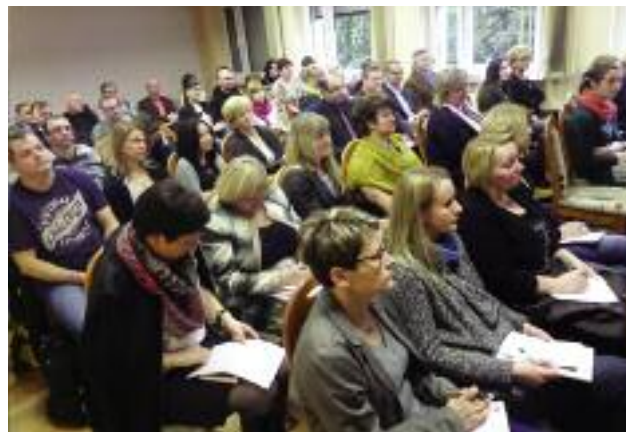
ARiMR uczy również doradców, którzy będą pomagali rolnikom w wypełnianiu wniosków o przyznanie dopłat bezpośrednich, Poznań 12 lutego 2015 r.

W Centrum Doradztwa Rolniczego przygotowywane są metodyki świadczenia 17 rodzajów usług doradczych. Metodyki te tworzą system standardów świadczenia doradztwa w poszczególnych dziedzinach, który służy w szczególności potrzebom PROW 2014-2020, ale może mieć też zastosowanie przy świadczeniu usług niezależnie. MRiRW zarezerwowało, w ramach pomocy technicznej, środki na szkolenia dla doradców. Od marca 2016 r. CDR w Brwinowie, jako instytucja odpowiedzialna za doskonalenie zawodowe doradców rolniczych, na zlecenie MRiRW prowadzi szkolenia uzupełniające dla doradców rolnośrodowiskowych i ekspertów przyrodniczych.