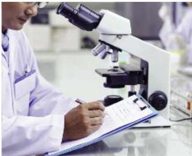
Polska chce wypracować rozwiązania, które pozwalałyby m.in. na zwiększenie udziału jednostek naukowo-badawczych w środkach finansowych w ramach programu Horyzont 2020

przeprowadzi diagnozę barier w tym zakresie oraz zdefiniuje i zastosuje możliwe sposoby poprawy tej sytuacji. Stanowisko zostało zaprezentowane przez Ministra Rolnictwa na posiedzeniu Rady UE ds. Rolnictwa i Rybołówstwa w grudniu 2015 r. oraz w dniu 15 lutego 2016 r.