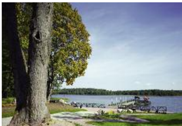
W ramach działania Leader udzielane jest m.in. wsparcie na realizację operacji udostępniania zasobów przyrodniczych i turystycznych obszarów wiejskich

Równolegle trwają przygotowania do uruchomienia wdrażania pomocy w ramach PROW 2014-2020 w zakresie pomocy samorządom lokalnym na inwestycje w obiekty pełniące funkcje kulturalne lub kształtowanie przestrzeni publicznej . Przygotowano projekt rozporządzenia Ministra Rolnictwa i Rozwoju Wsi w sprawie szczegółowych warunków i trybu przyznawania, wypłaty oraz zwrotu pomocy finansowej w ramach poddziałania „Wsparcie badań i inwestycji związanych z utrzymaniem, odbudową i poprawą stanu dziedzictwa kulturowego i przyrodniczego wsi, krajobrazu wiejskiego i miejsc o wysokiej wartości przyrodniczej, w tym dotyczące powiązanych aspektów społeczno-gospodarczych oraz środków w zakresie świadomości środowiskowej” oraz w ramach poddziałania „Wsparcie inwestycji w tworzenie, ulepszanie i rozwijanie podstawowych usług lokalnych dla ludności wiejskiej, w tym rekreacji, kultury, i powiązanej infrastruktury” . Trwają jego uzgodnienia. Nabory na ten typ operacji zaplanowano na kwiecień 2017 r.