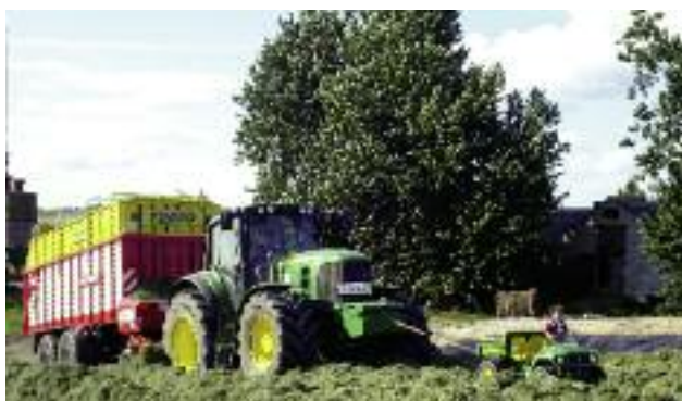
W zakresie rolnictwa ekologicznego wprowadzono możliwość utworzenia jednego rejestru zabiegów agrotechnicznych zarówno na potrzeby działania, jak i jednostki certyfikującej

Podjęto również działania w zakresie następujących uproszczeń dla rolników w ramach poddziałania Pomoc w rozpoczęciu działalności gospodarczej na rzecz młodych rolników, zgodnie z rozporządzeniem