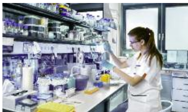
Raport o rozwoju społeczno-gospodarczym, regionalnym oraz przestrzennym będzie m.in. zawierał zagadnienia dotyczące znaczenia dla ochrony zdrowia społeczeństwa sprawnego funkcjonowania systemu bezpieczeństwa żywności

W ramach ww. prac przygotowano wstępny projekt Paktu w perspektywie krótkookresowej . Równolegle zainicjowano prace nad Paktem w części długookresowej. W ramach dalszych prac planuje się realizację następujących zadań: