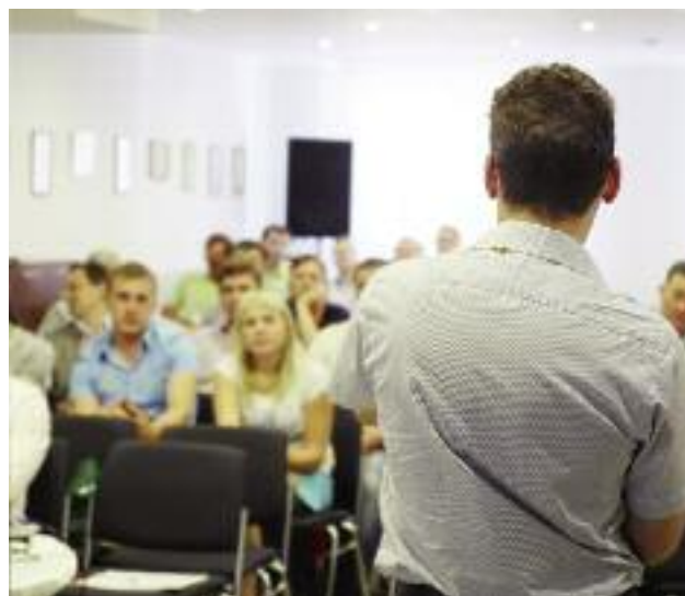
Opracowany został Plan operacyjny SIR na lata 2016-2017 , w którym m.in. zaplanowano zwiększenie dostępu do informacji o innowacyjnych rozwiązaniach poprzez szkolenia i indywidualne konsultacje

Realizując zadania SIR, ośrodki doradztwa rolnicze-