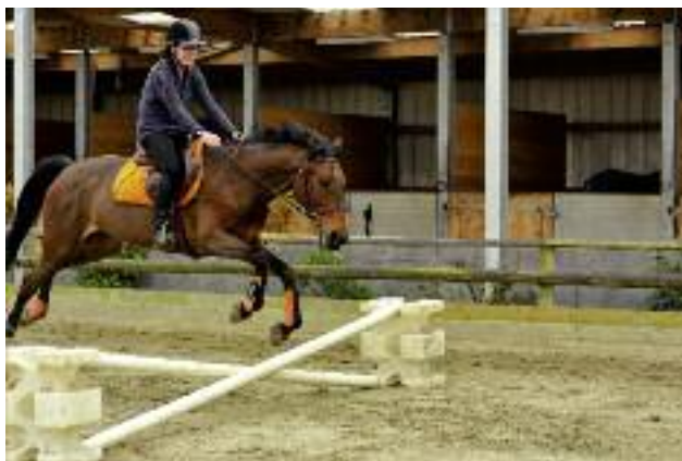
W szkołach rolniczych wprowadzono nowe zawody m.in. jeździec

wy o systemie oświaty. Skierowano wystąpienie do 10 starostów i prezydentów miast, z prośbą o rozważenie możliwości przekazania prowadzenia 10 szkół rolniczych. Wystąpiono także do Ministra Edukacji Narodowej oraz do Ministra Finansów w sprawie wyjaśnienia sposobu naliczania i przekazywania subwencji oświatowej dla przyjmowanych szkół rolniczych;