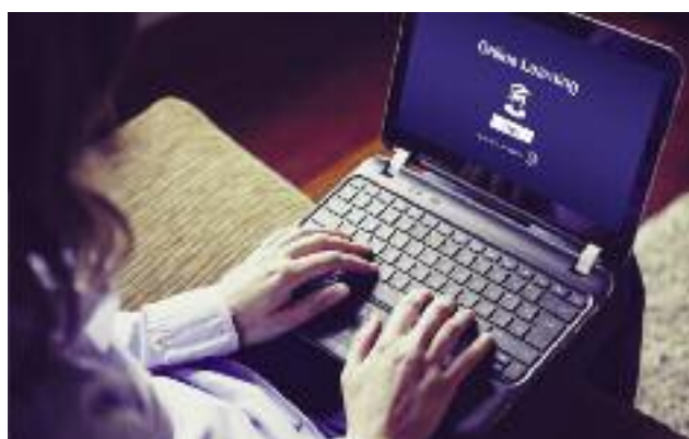
Interesującymi formami edukacji na obszarach wiejskich mogą być kursy e-learningowe i kształcenie z wykorzystaniem technik multimedialnych

MRiRW prowadzi stałą analizę przepisów Ministra Edukacji Narodowej oraz Ministra Nauki i Szkolnictwa Wyższego, dotyczące kształcenia na odległość (kursy