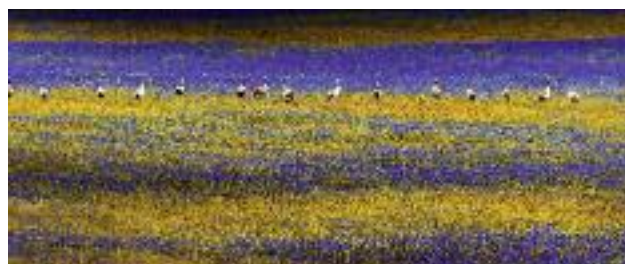
W zakresie Działania rolno-środowiskowo-klimatycznego uproszczenia dotyczą między innymi cennych siedlisk i zagrożonych gatunków ptaków