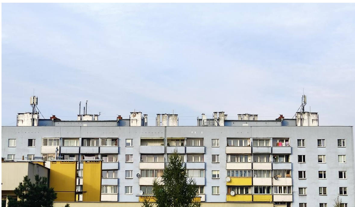
Fot. 1: Widoki anten stacji bazowej: ID: 1570, zlokalizowanej; ul. ks. Piotra Ściegiennego 70, Kraków